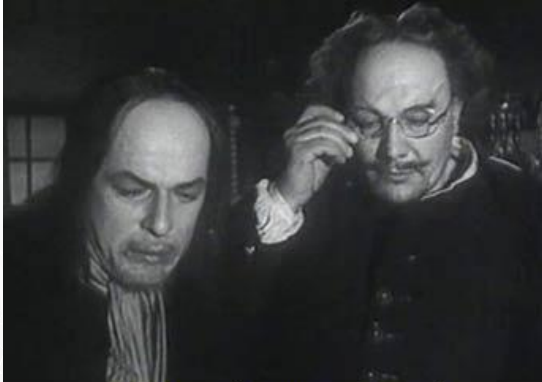
Петр Первый и царевич Алексей (кадр из фильма «Петр Первый», 1938г., СССР)