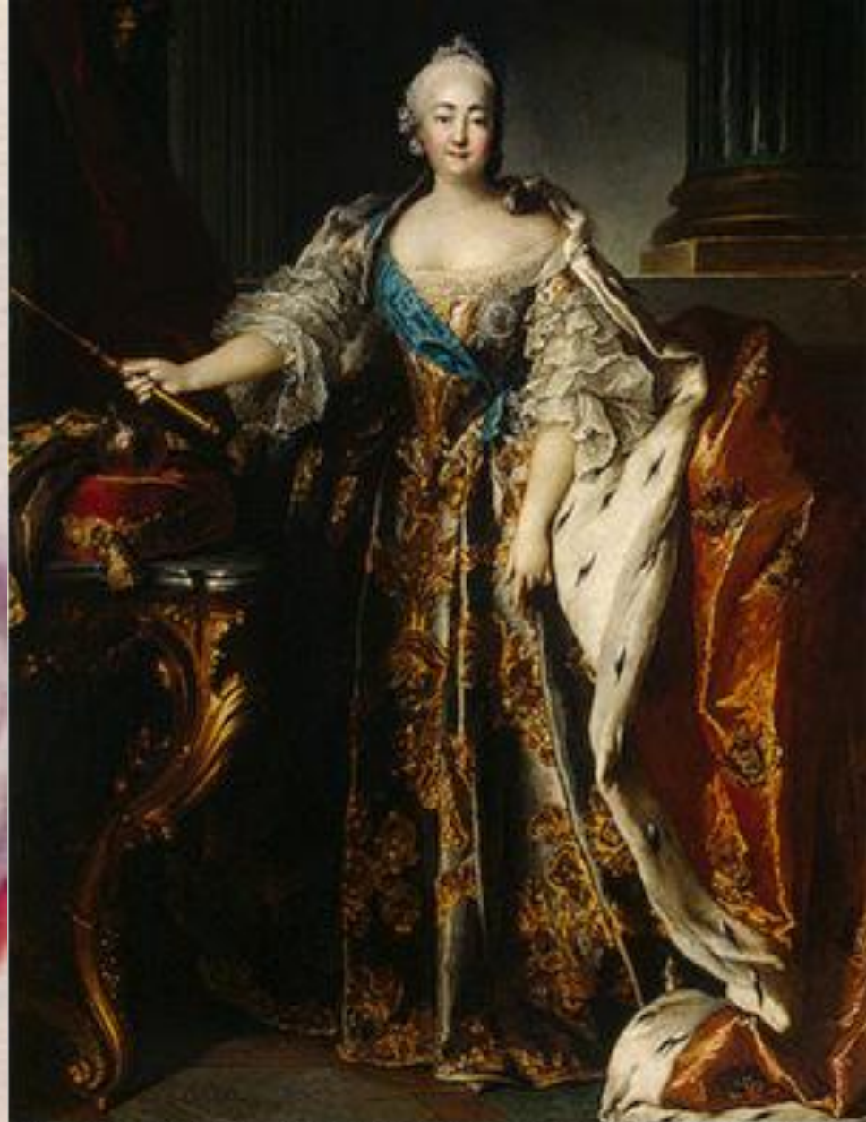
Портрет императрицы Елизаветы Петровны. Токе. Эрмитаж