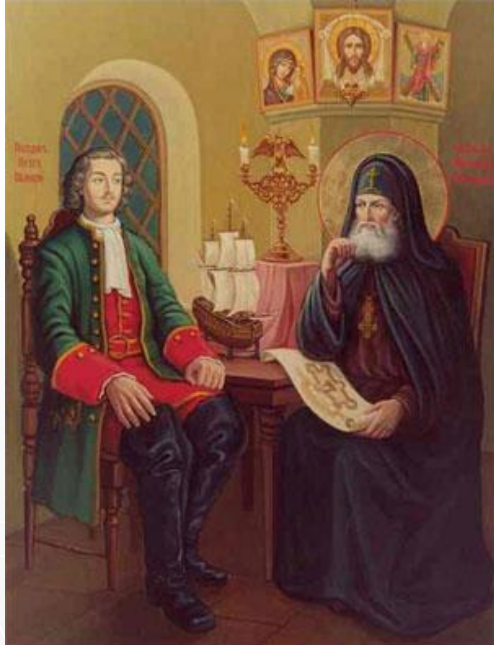
Император Петр Великий и Святитель Митрофан Воронежский