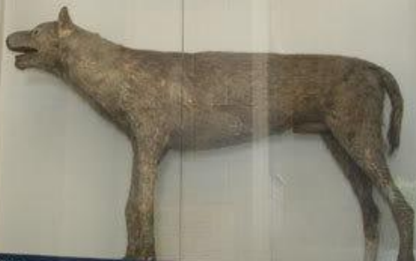
Собака породы буленбейцер /быкодав/ по кличке Тиран.