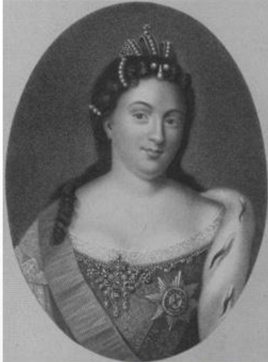
Императрица Екатерина Первая, супруга Императора Всея Руси Петра Первого.