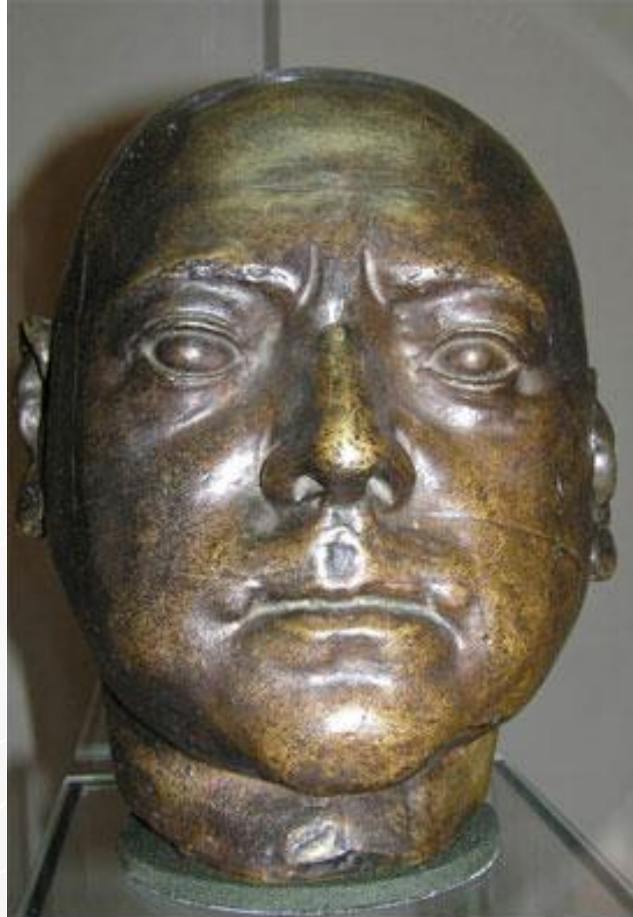
Голова Петра Первого, отлитая по маске, сделанной при его жизни