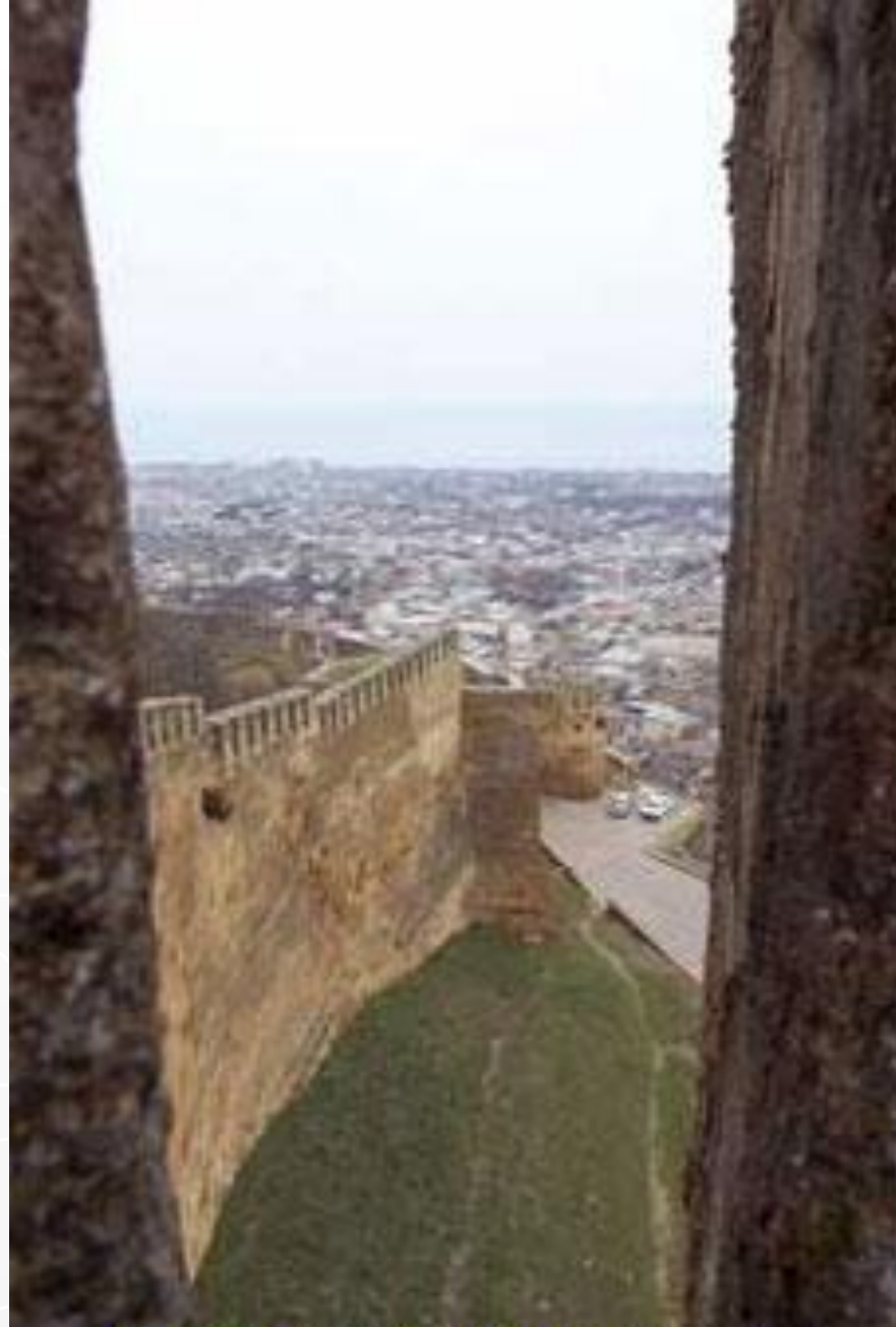
Вид на Дербент с городской стены