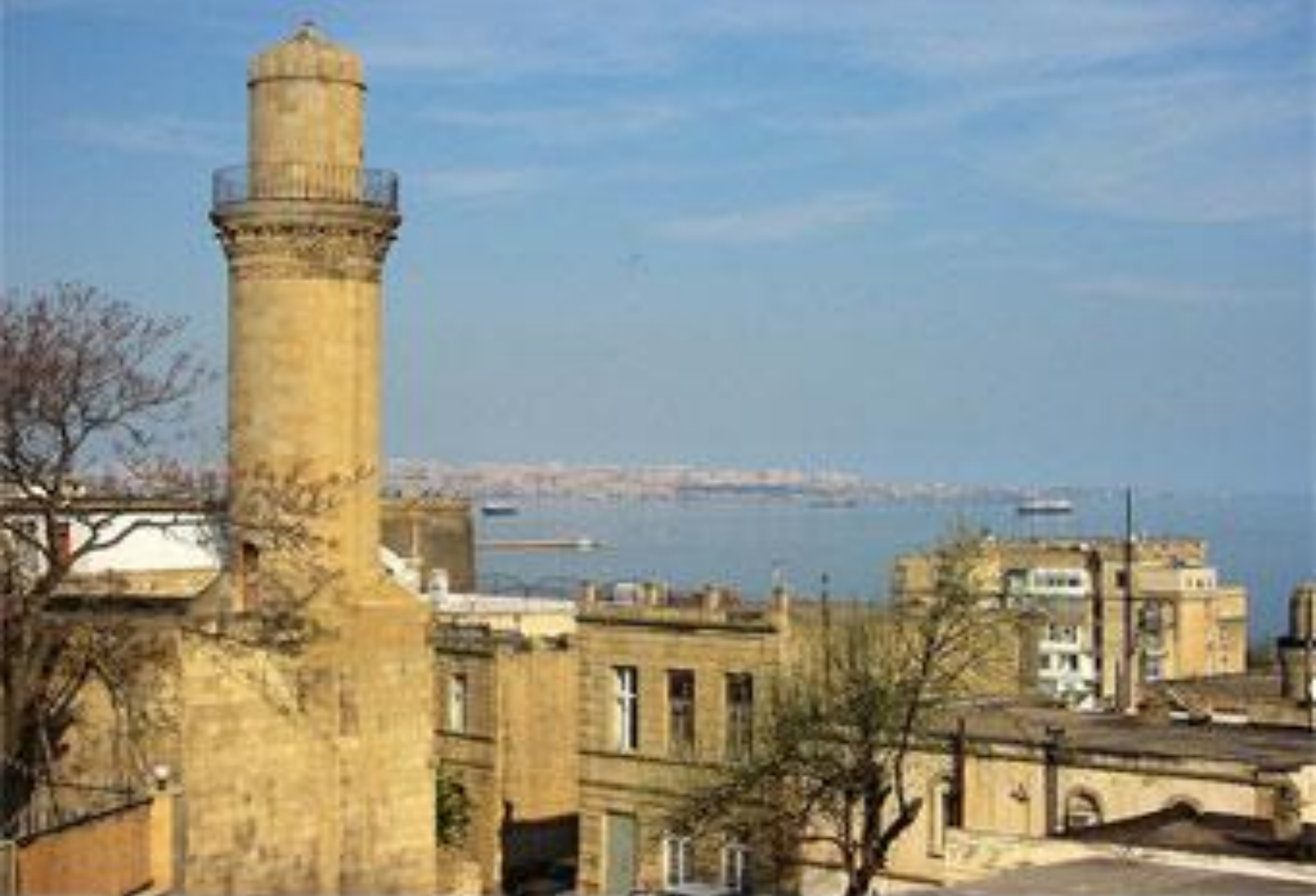
Историческая часть Баку, вид на Каспийское море