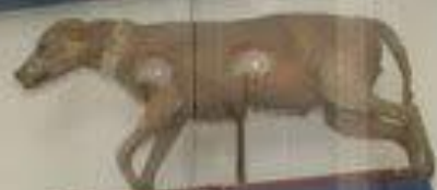
Собака породы гладкошерстный терьер по кличке Лизетта