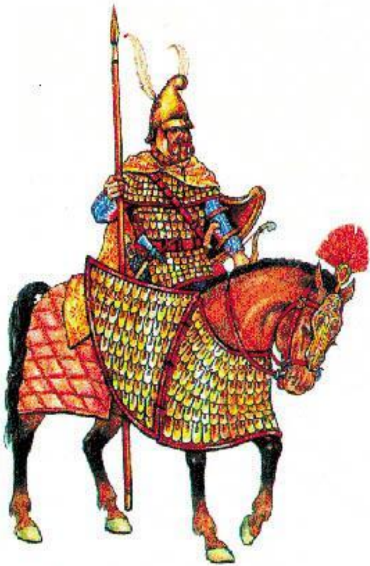
Тяжеловооруженный персидский воин (клинбарий)