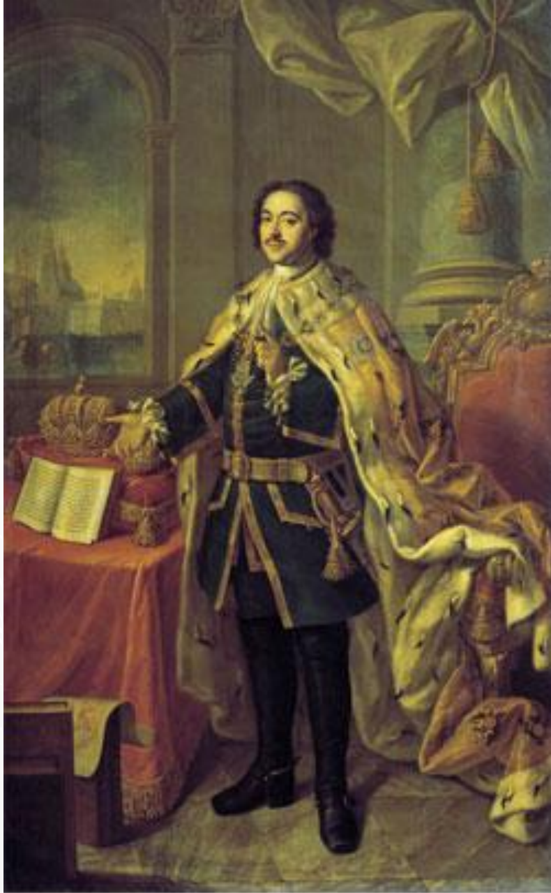
Император Петр Великий. Алексей АНТРОПОВ, 1770г. Холст, масло. 268x159 см