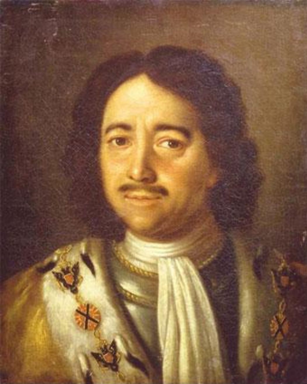
Портрет Петра I Алексей Петрович Антропов