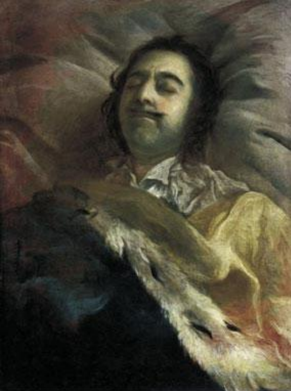
«Пётр I на смертном одре.» Никитин И. Н.