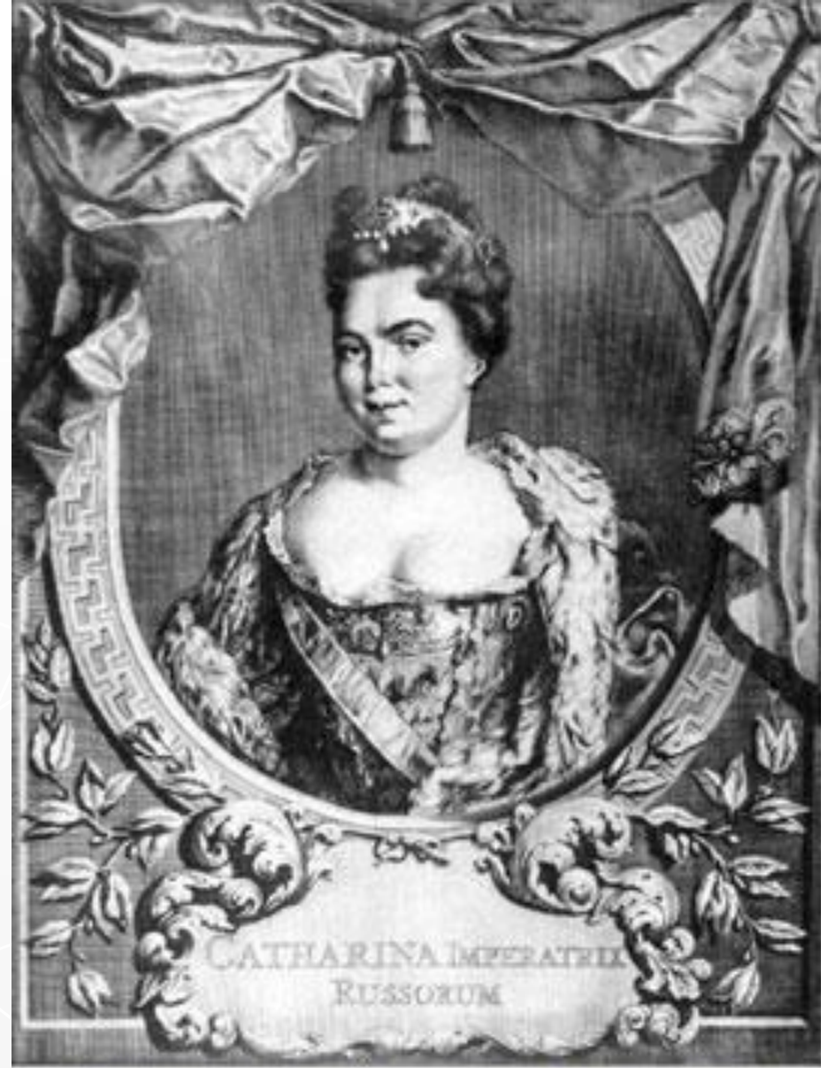
Прижизненный портрет Екатерины Первой. Гравюра Я.Хубракена по оригиналу К.Моора. 1718 г.