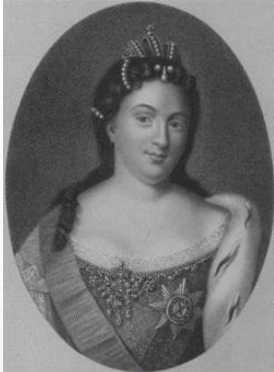
Императрица Екатерина Первая, супруга Императора Всея Руси Петра Первого.