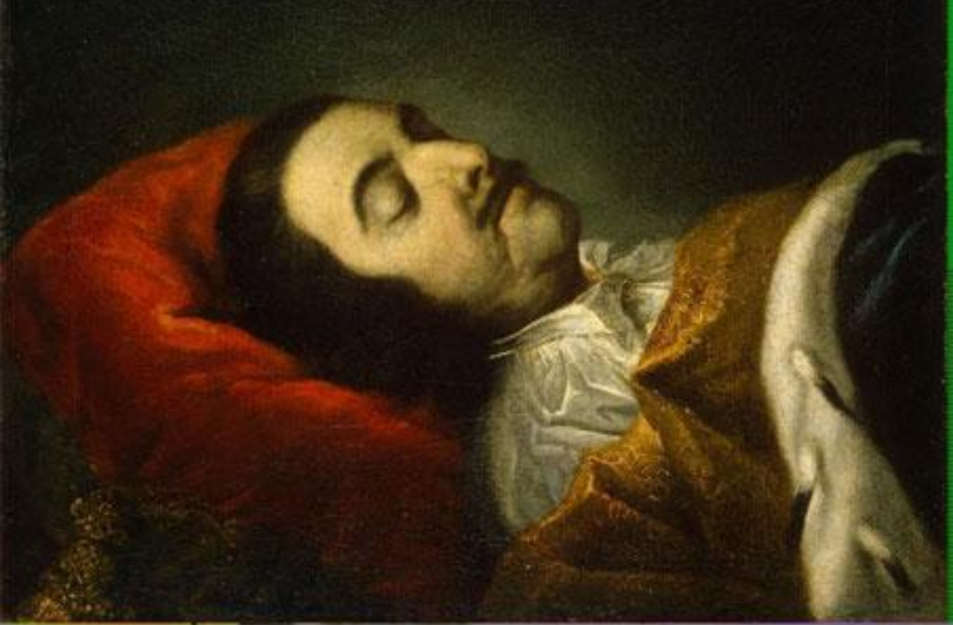
Портрет Петра I на смертном одре. Таннауер И.Г. 1725г.