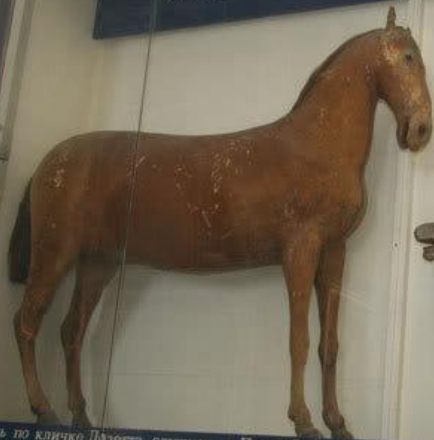
Лошадь по кличке Лизетта, служившая Петру I во время Полтавской баталии.