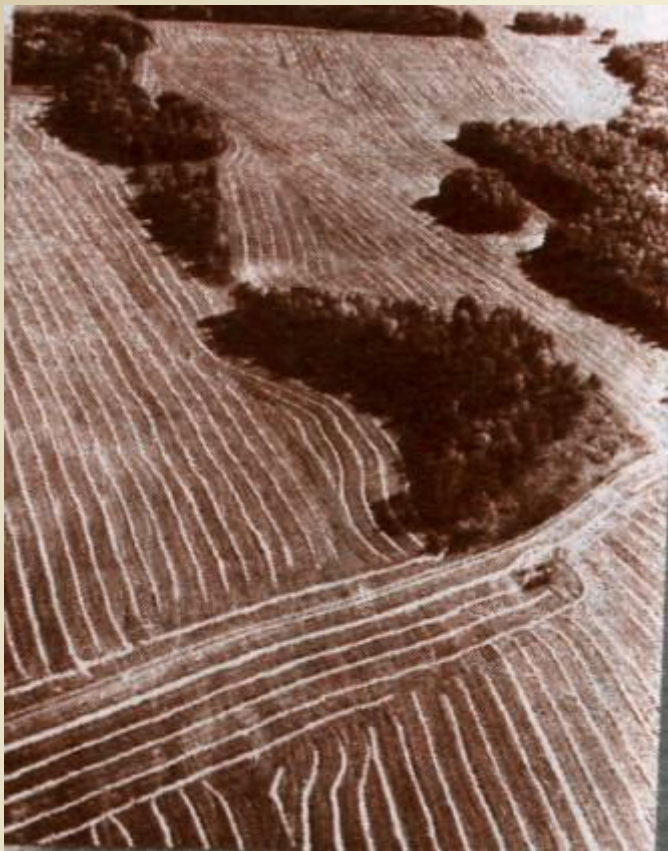
Жатва в совхозе «Петропавловский»

Символическую эстафету целинной эпопее 60-х передал один из пионеров второй целины совхоз «Петропавловский» (Верхнеуральский р-н). В 1953г. Он стал одним из крупнейших производителей зерна в стране. В Челябинской области «третья целина» началась в январе 1954г. , когда города взяли шефство над целинными районами и начали создавать тракторные и тракторно-полеводческие бригады. На весенние полевые работы выехали 7,5тыс. добровольцев из городов области. МТС и совхозы получили почти 7тыс. тракторов и комбайнов, более 5,5 тыс. единиц различной с/х техники. Были электрифицированы 384 колхоза и все МТС. За 1954-1955гг было поднято 724тыс.га новых земель вместо 440тыс. запланированных.