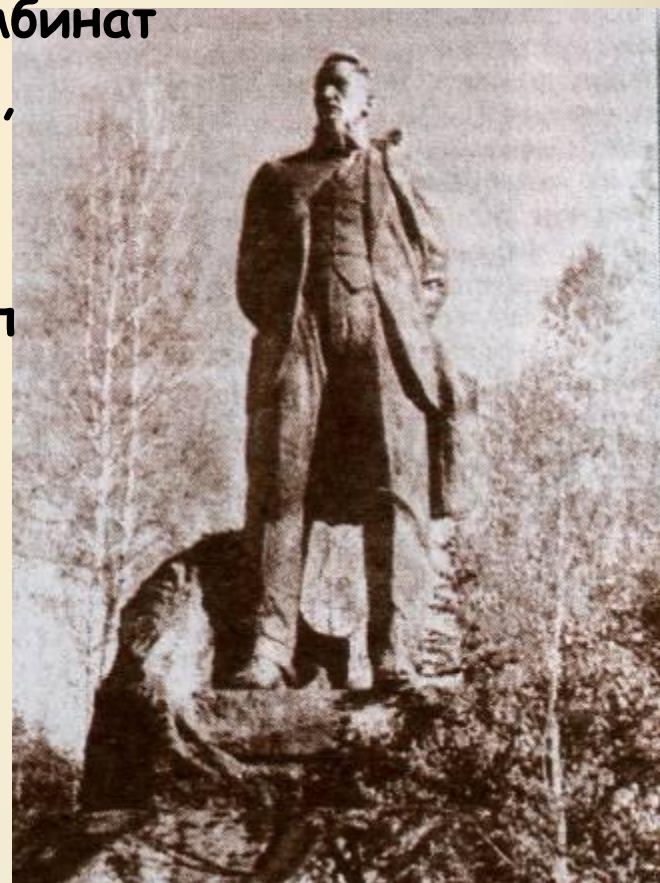
Памятник И.В.Курчатову. г. Снежинск