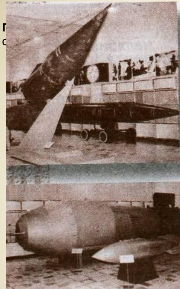
Головная часть ракеты Р-13 и водородная супербомба РДС-202. Экспонаты музея ядерного оружия в Снежинске.