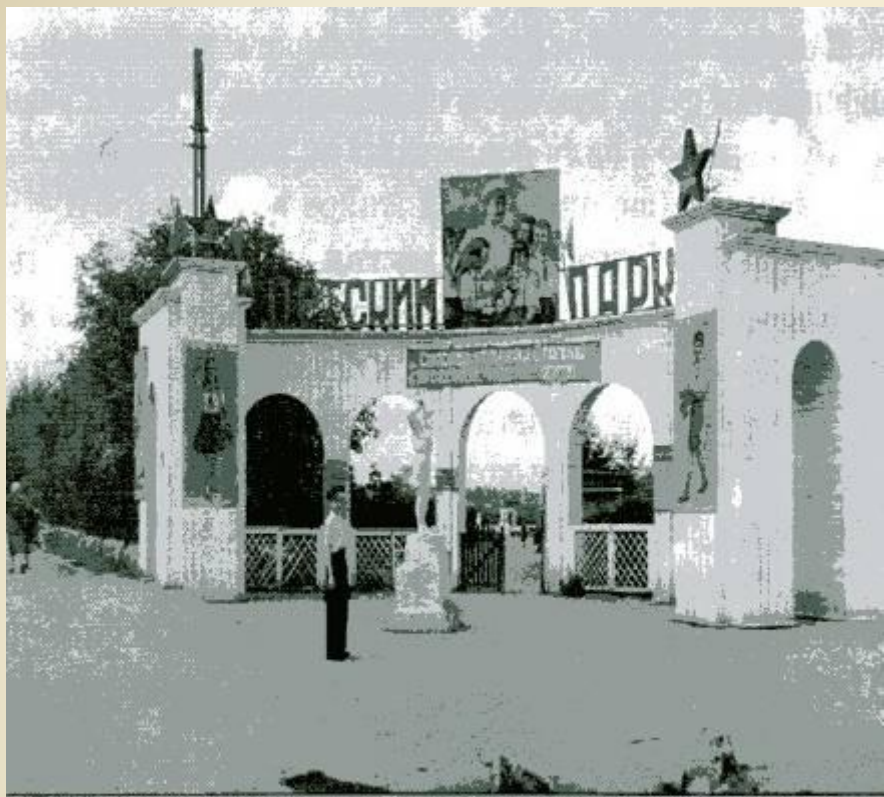
Вход в детский парк культуры и отдыха, г. Челябинск, 1948 г.

Декабрь 1958г принят закон о переходе ко всеобщему восьмилетнему образованию, а с 1959г. началась реформа по реорганизации школ с целью их политехнизации. В школах вводится обязательное производственное обучение. В 1964г. был осуществлен переход школ к десятилетнему обучению. К 1965г. В Челябинске было 12 начальных, 28 восьмилетних, 35 средних школ и 48 школ рабочей молодежи.