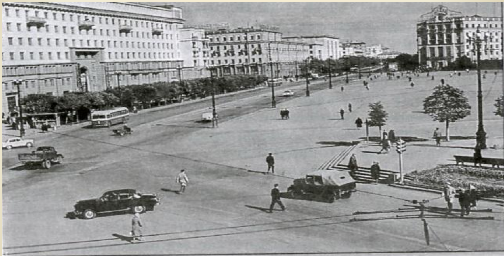
г. Челябинск, пл. Революции, начало 1960-х гг.