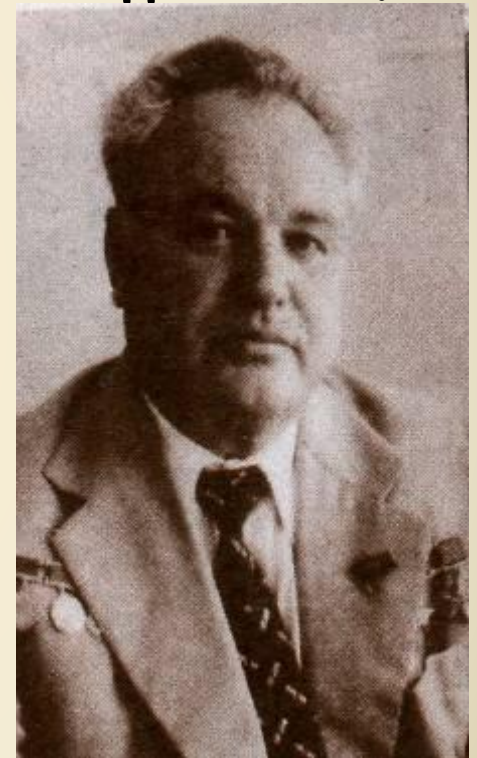
В.П.Макеев 1924-1985, конструктор баллистических ракет, академик, дважды Герой Соц. Труда.

В 1940-50-е гг. мало кто из ученых имел четкое представление о вреде радиоактивности. Поэтому в эти годы регион не раз постигали аварии на секретных объектах. Самая крупная авария произошла в 1957г. После термического взрыва в хранилище радиоактивных отходов, были заражены территории Челябинской, Свердловской, Тюменской областей. Облучению подверглось более 270 тыс. человек.