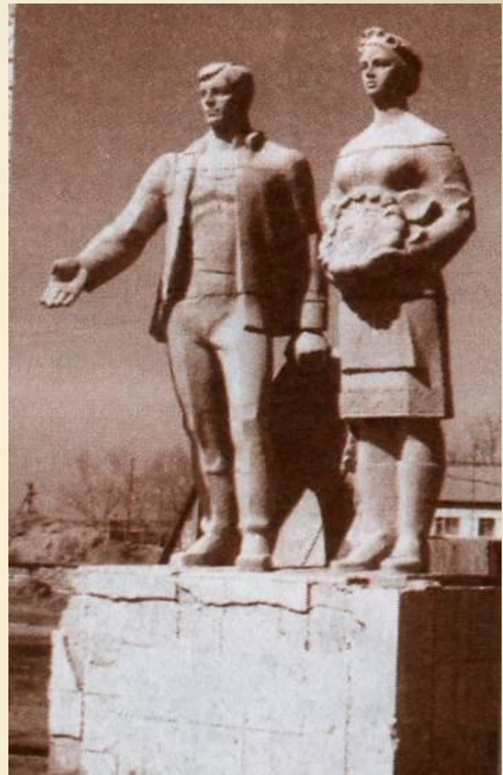
Памятник первоцелинникам. Пос. Маяк, Брединский р-он.

Постепенно улучшалось положение дел и в животноводстве. Колхозы и совхозы Урала удвоили продажу своей продукции государству. В середине 1960-х гг. на Южном Урале были созданы областные тресты всесоюзного объединения «Птицепром».