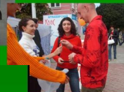
Фестиваль по пропаганде здорового образа жизни «!»