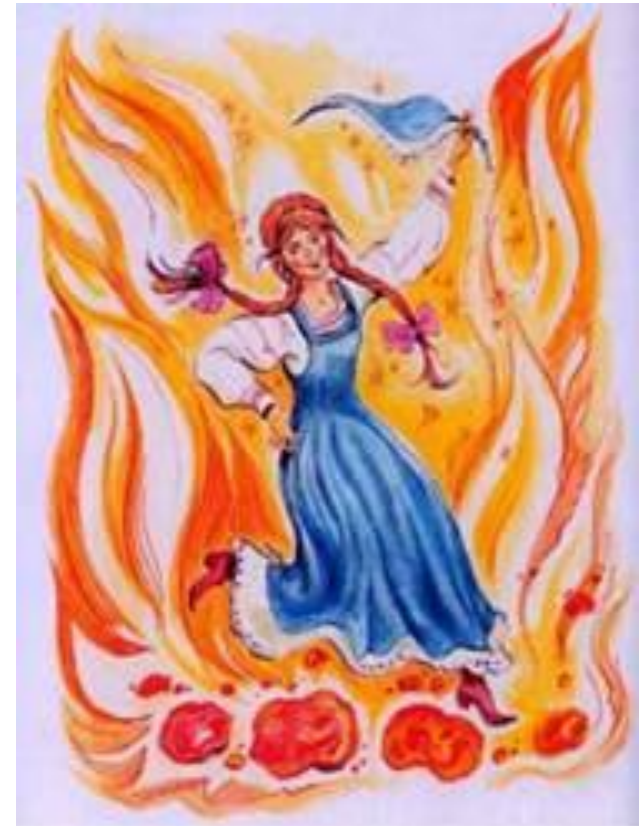
«Огневушка-поскакушка» В. Челак