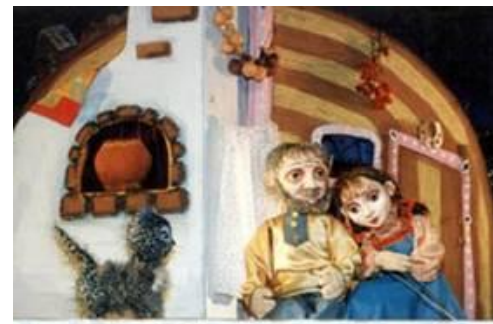
Спектакль Омского кукольного театра «Серебряное копытце»