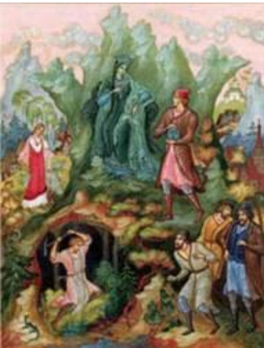
«Медной горы Хозяйка» К. Кукулиева