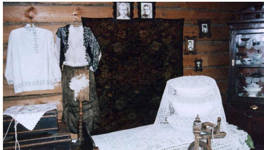
Комната в доме Бажовых, Сысерть