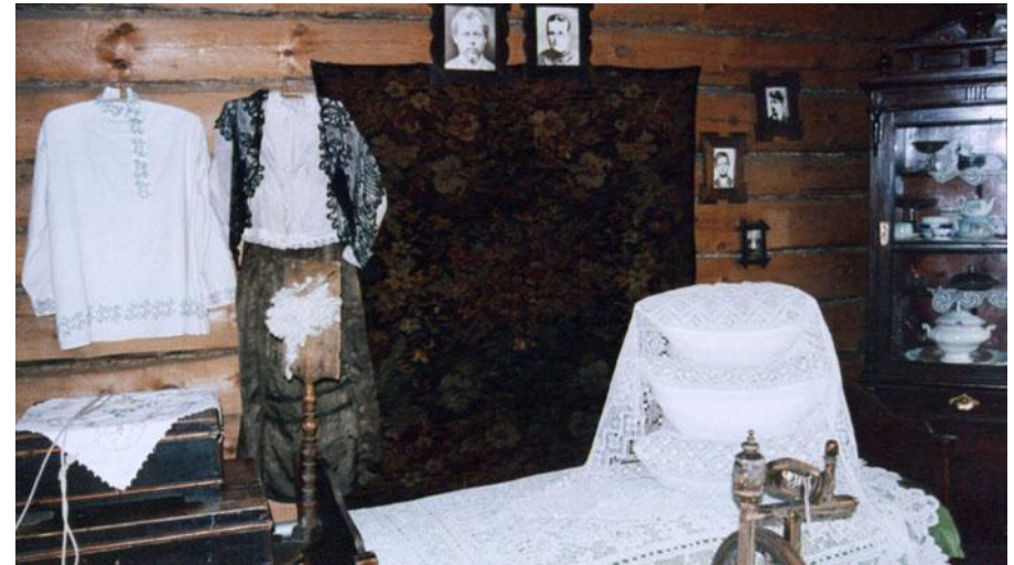
Комната в доме Бажовых, Сысерть