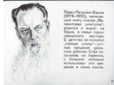
Павел Петрович Бажов (1879–1950), написавший книгу сказов «Малахитовая шкатулка», родился и вырос на Урале, в семье горнозаводского мастера. С детства он полюбил «таинные сказы» – устные предания уральских рабочих. Став писателем, он бережно, с большой любовью использовал эти предания в своих книгах.