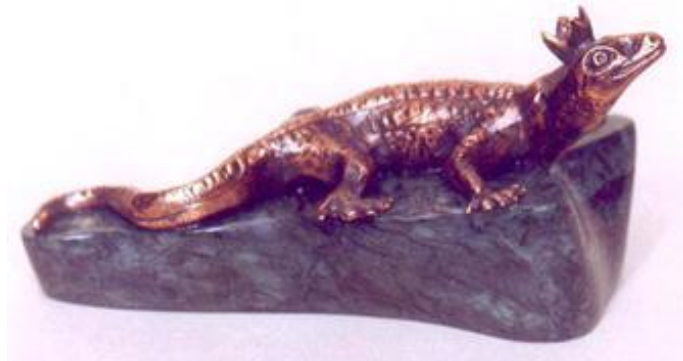
Хозяйка Медной горы, бронза. А.Н. Четвериков