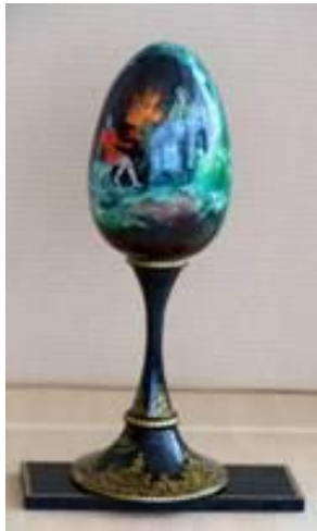
Пасхальное яйцо «Хозяйка Медной горы», дерево. В.А. Панин. Палех, 2003.

Сказы Павла Петровича Бажова так умны и так красивы, что композиторы сочиняют к ним музыку, художники рисуют иллюстрации.