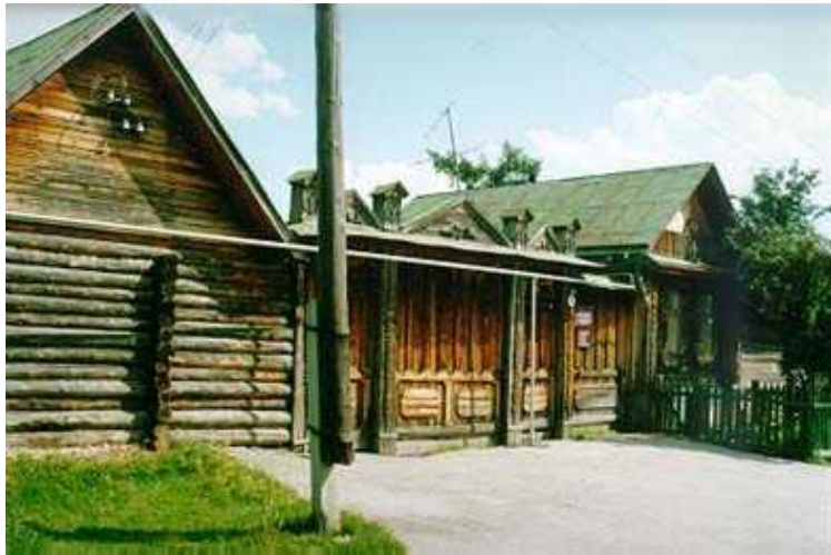
Дом Бажовых, Сысерть

«...Родился 27 января (15 по старому стилю) 1879 г. в Сысертском заводе бывшего Екатеринбургского уезда, Пермской области. Отец по сословию считался крестьянином, но работал на заводе... мать кроме домашнего хозяйства занималась рукоделием «на заказчика».