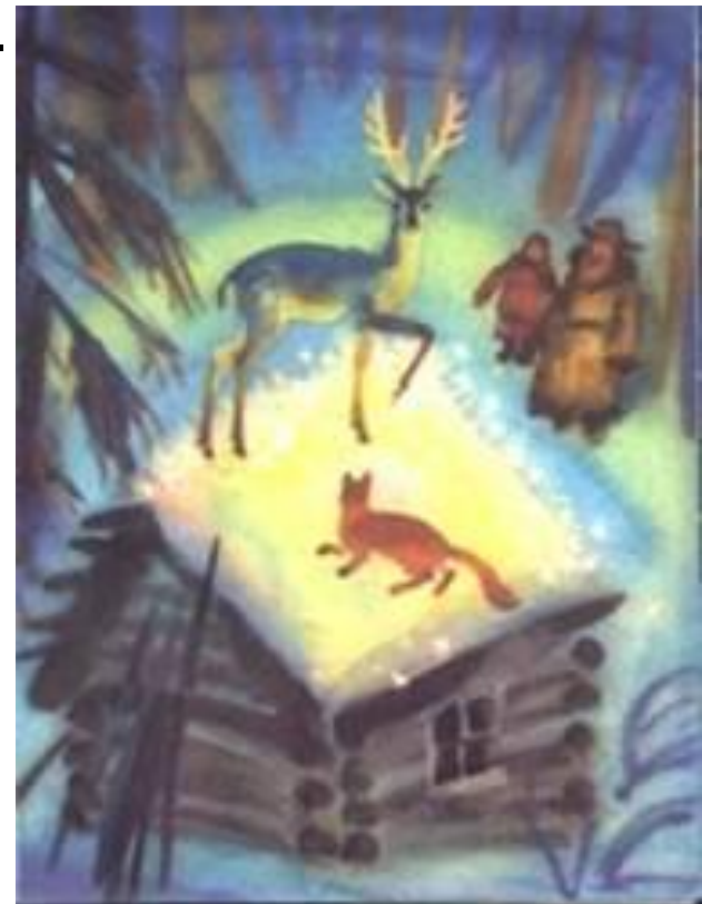
«Серебряное копытце» Г. Мосин