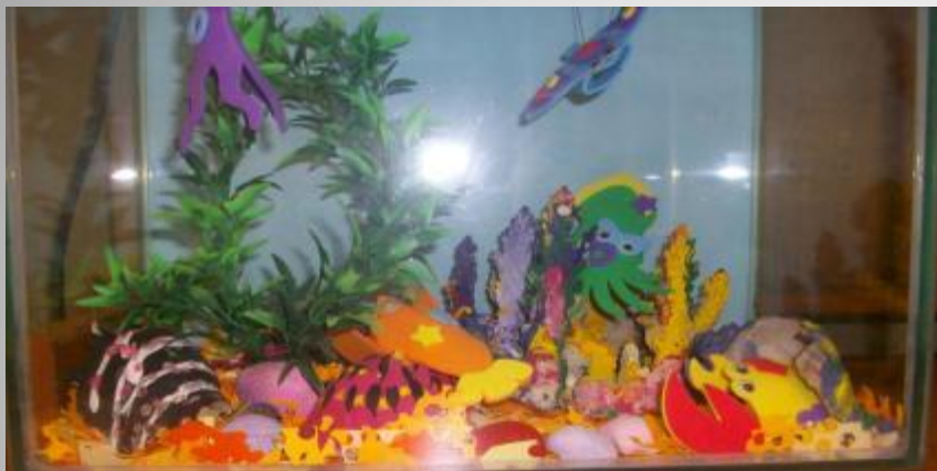
Знакомим с обитателями аквариума