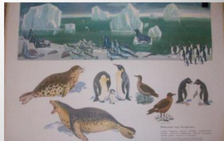
Знакомим с животными Севера