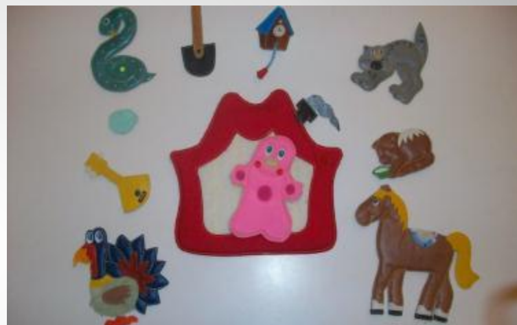
«Сказка о весёлом язычке»