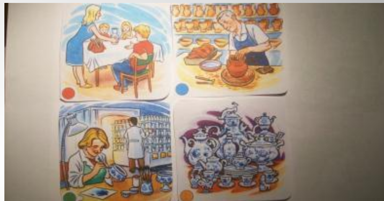
Составляем рассказы по серии сюжетных картинок