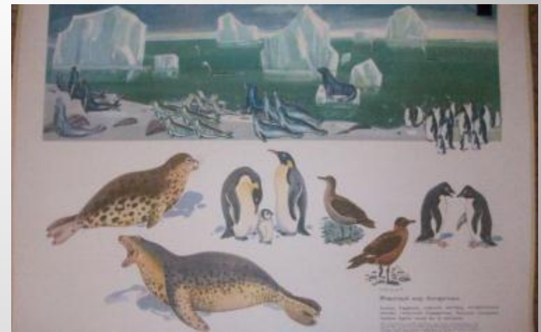
Знакомим с животными Севера