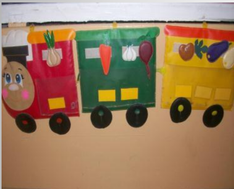
Д/И «Загрузи овощи в вагоны»