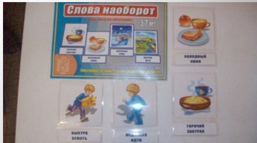
Наречиями «Быстро – медленно»