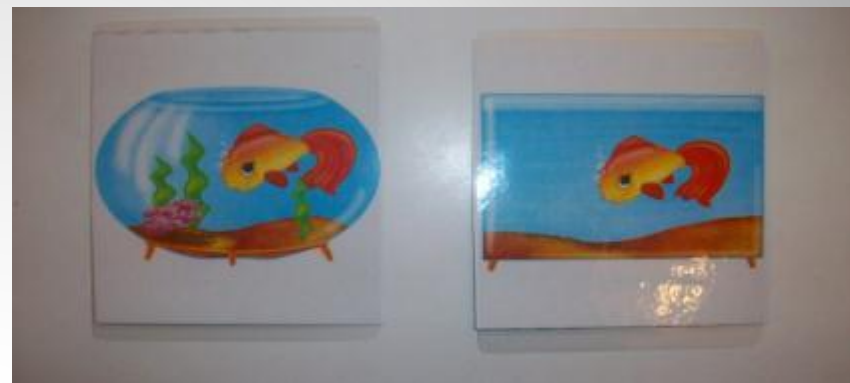
Наречиями «Слева – справа»