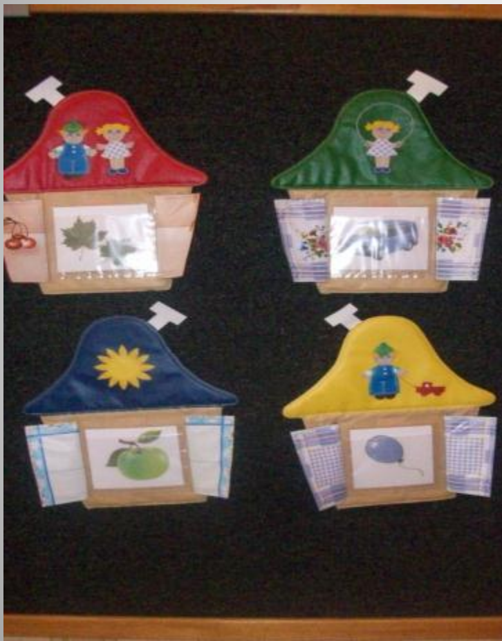
Местоимения «Мой, моя, мои»