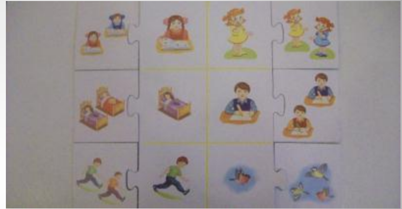
Изменяем глаголы по числам