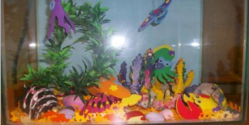
Знакомим с обитателями аквариума