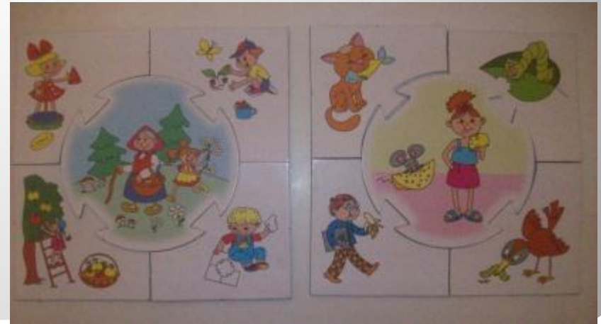
Играем в настольные игры