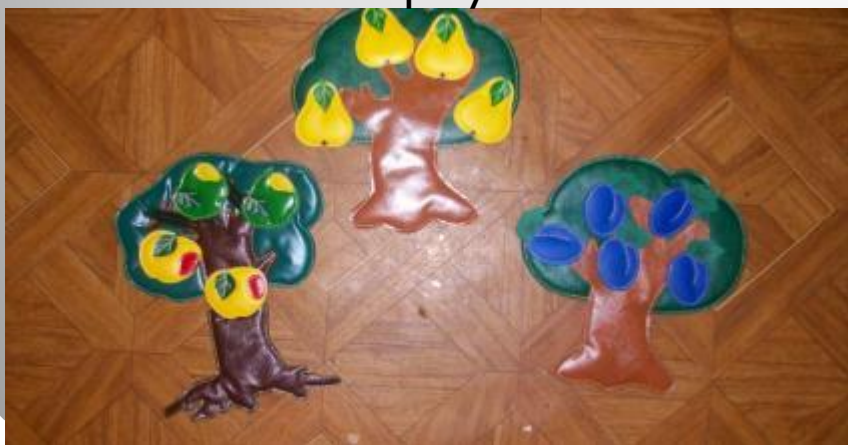
Знакомим с фруктами