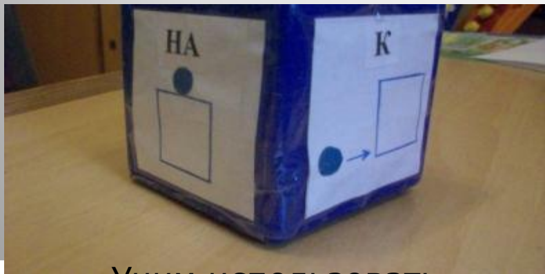
Учим использовать предлоги