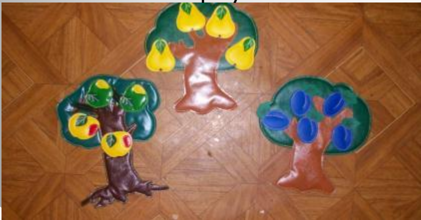
Знакомим с фруктами