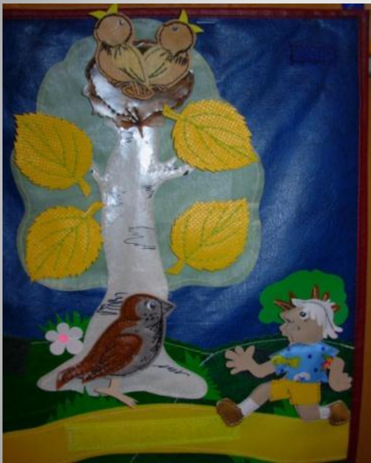
Над высотой голоса