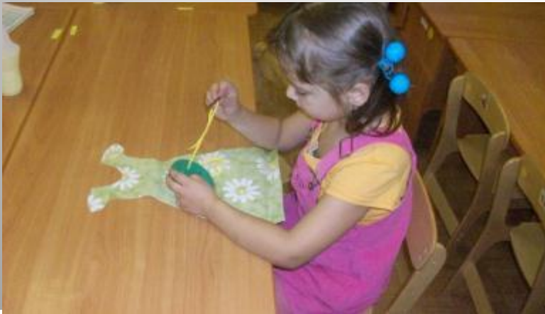
Отрабатываем приставочные глаголы («Я пришиваю пуговицу»)