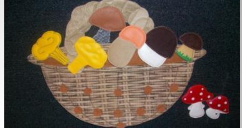
Знакомим с грибами