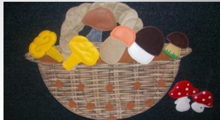
Знакомим с грибами