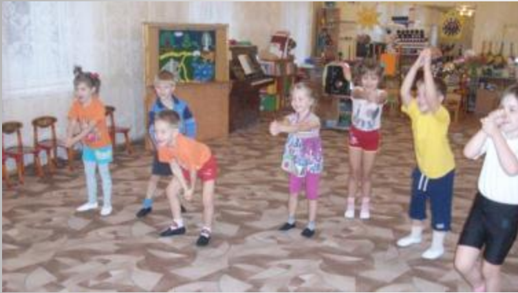
Описываем то, что делаем