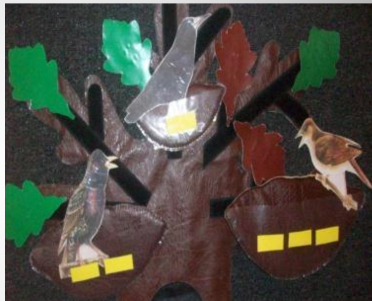
Д/И «Найди гнездо для птицы »