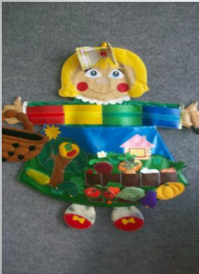
«Маша – огородница»