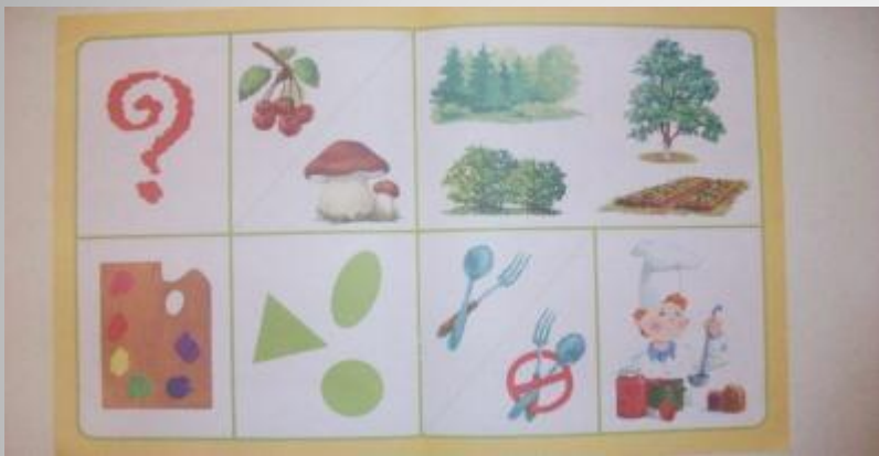
Описываем предметы по схемам