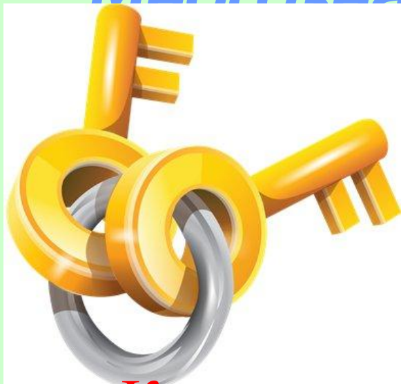
Ключ (от замка)