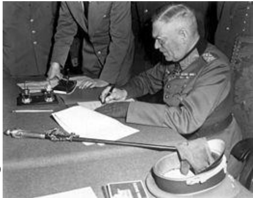
Вильгельм Кейтель подписывает Акт о безоговорочной капитуляции Германии

9 мая в 0:43 по московскому времени генерал-фельдмаршал Вильгельм Кейтель, а также представитель люфтваффе генерал-полковник Штумпф и Кригсмарине адмирал фон Фридебург, имевшие соответствующие полномочия от Дёница, подписали ещё один Акт о безоговорочной капитуляции Германии, который вступил в силу 9 мая с 00:00 по московскому времени.