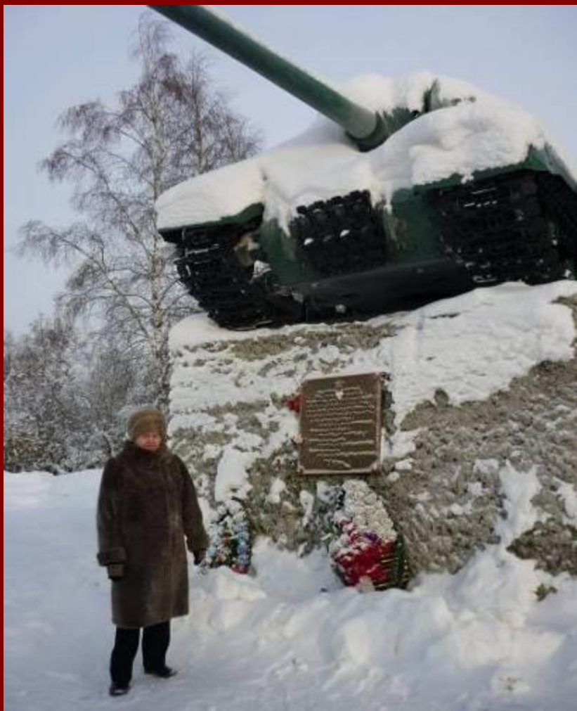
У памятника танкистам ст. лейтенанта З.Г. Колобанова