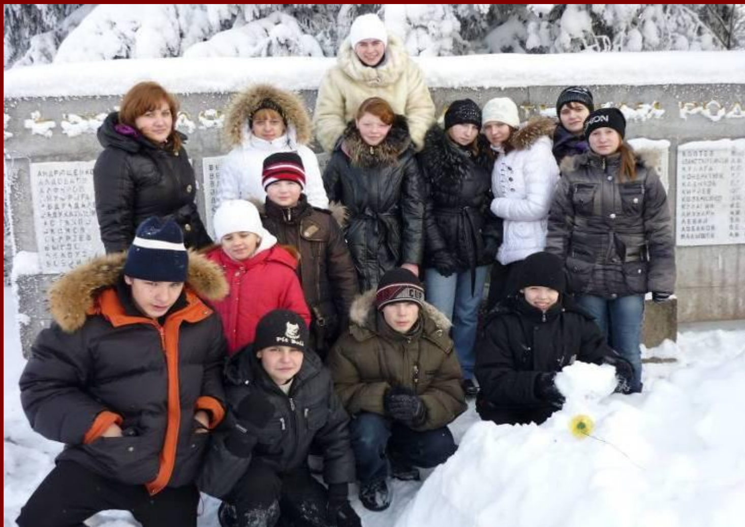
У памятника курсантам, погибшим в 1941 году. Большие Борницы