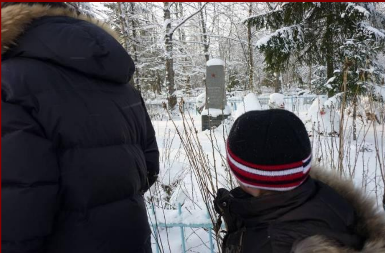
На братском захоронении в Никольском