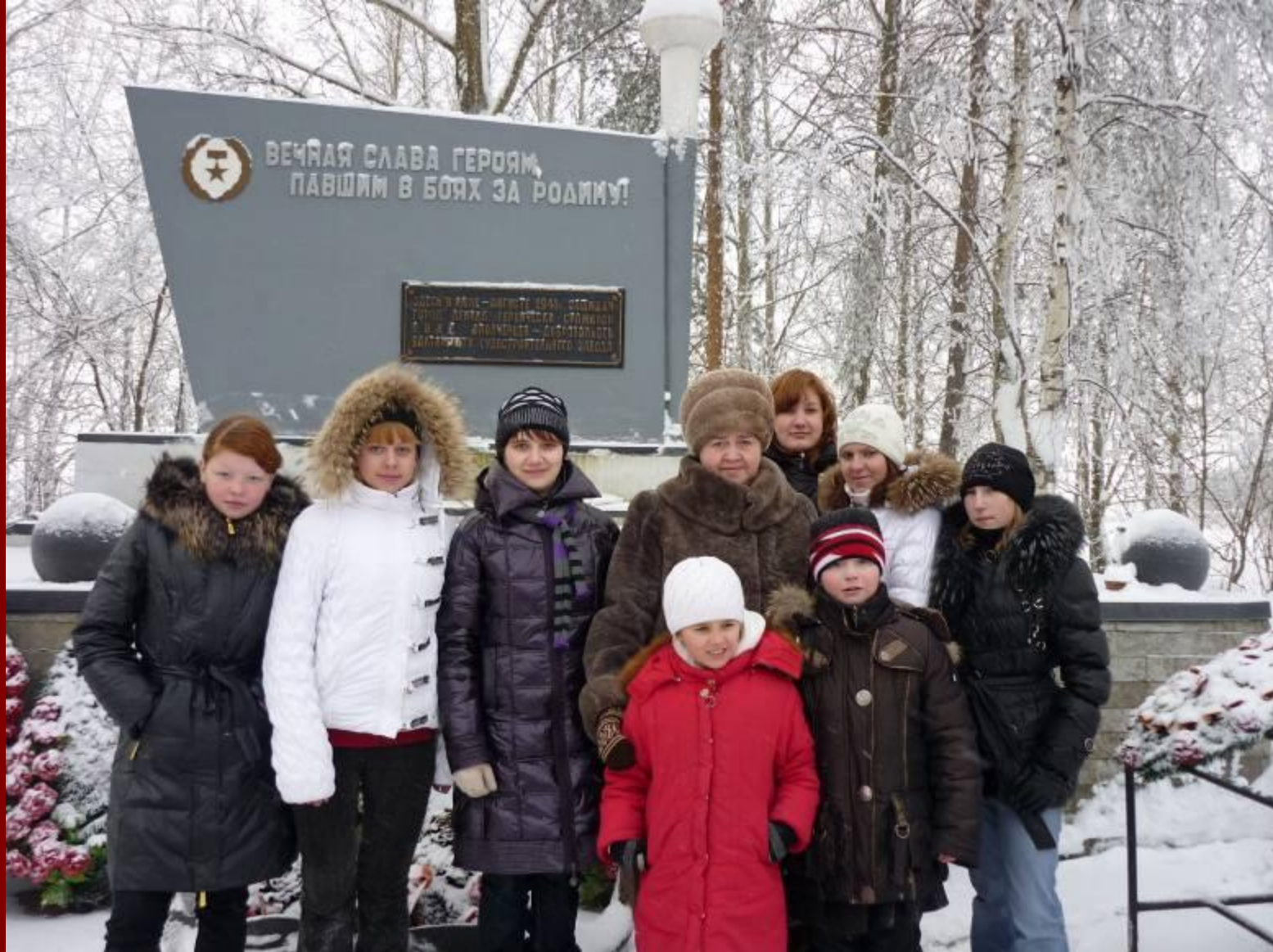
У памятника ополченцам, погибшим в 1941г. Деревня Пижма.