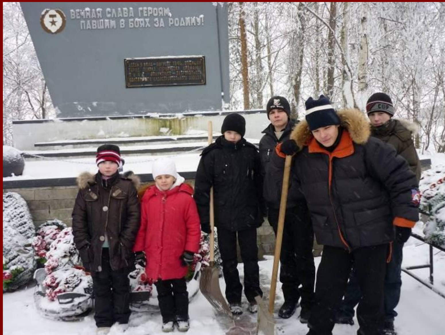
У памятника защитникам, погибшим в 1941 году