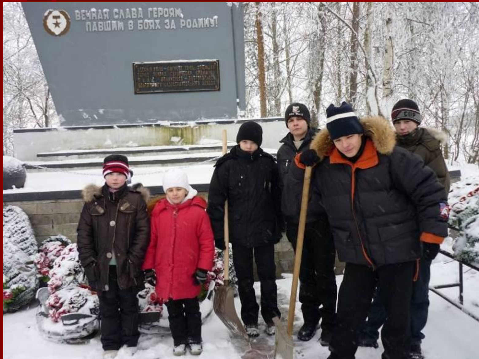
У памятника защитникам, погибшим в 1941 году