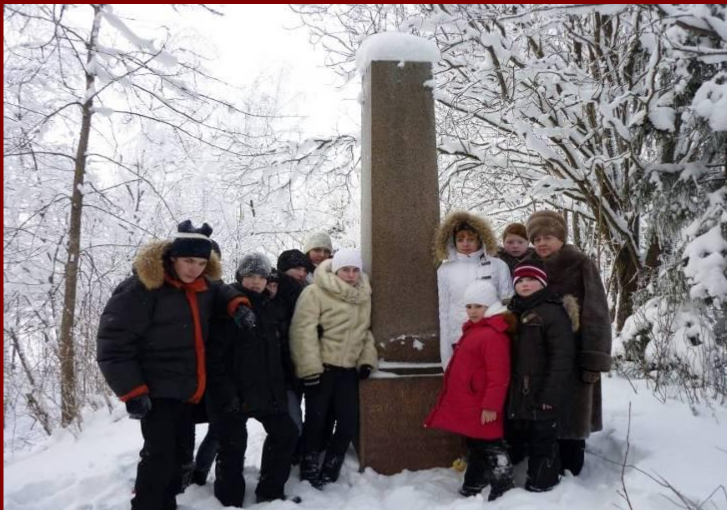
с. Никольское. У памятника больным, погибшим от рук фашистских палачей в 1941 году.