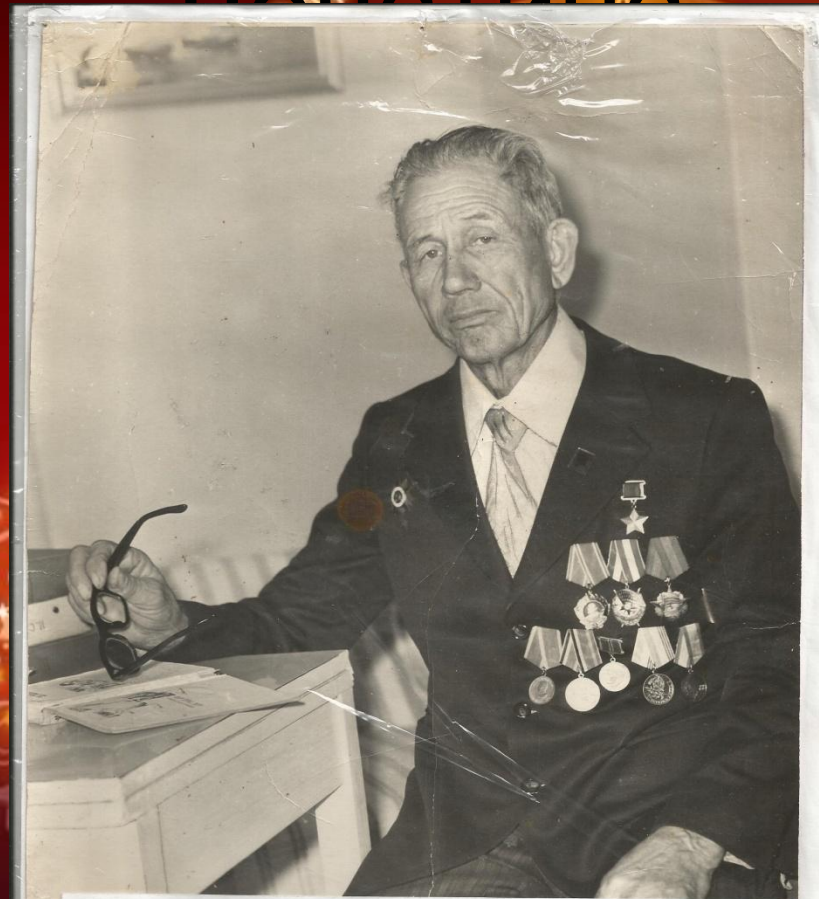
Герой Советского Союза Лопатин Георгий Дорофеевич

23 августа 2003 г. ЕАО отметила 90-летие Г.Д.