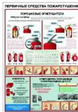
стенды ГО и ЧС