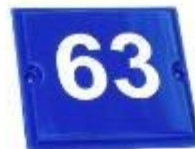
номер дома (серия "Таун", 22x20см)