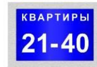
указатель номеров квартир на подъезде (30x20см)