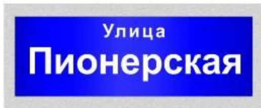
название улицы (60x20см)