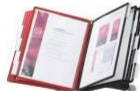
перекидные рамочные системы