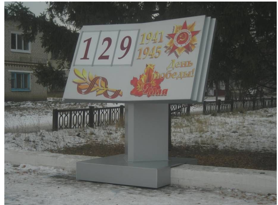
Производство малых архитектурных форм: Календарь «До дня победы осталось»