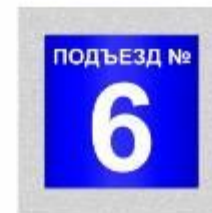
номер подъезда (20x20см)