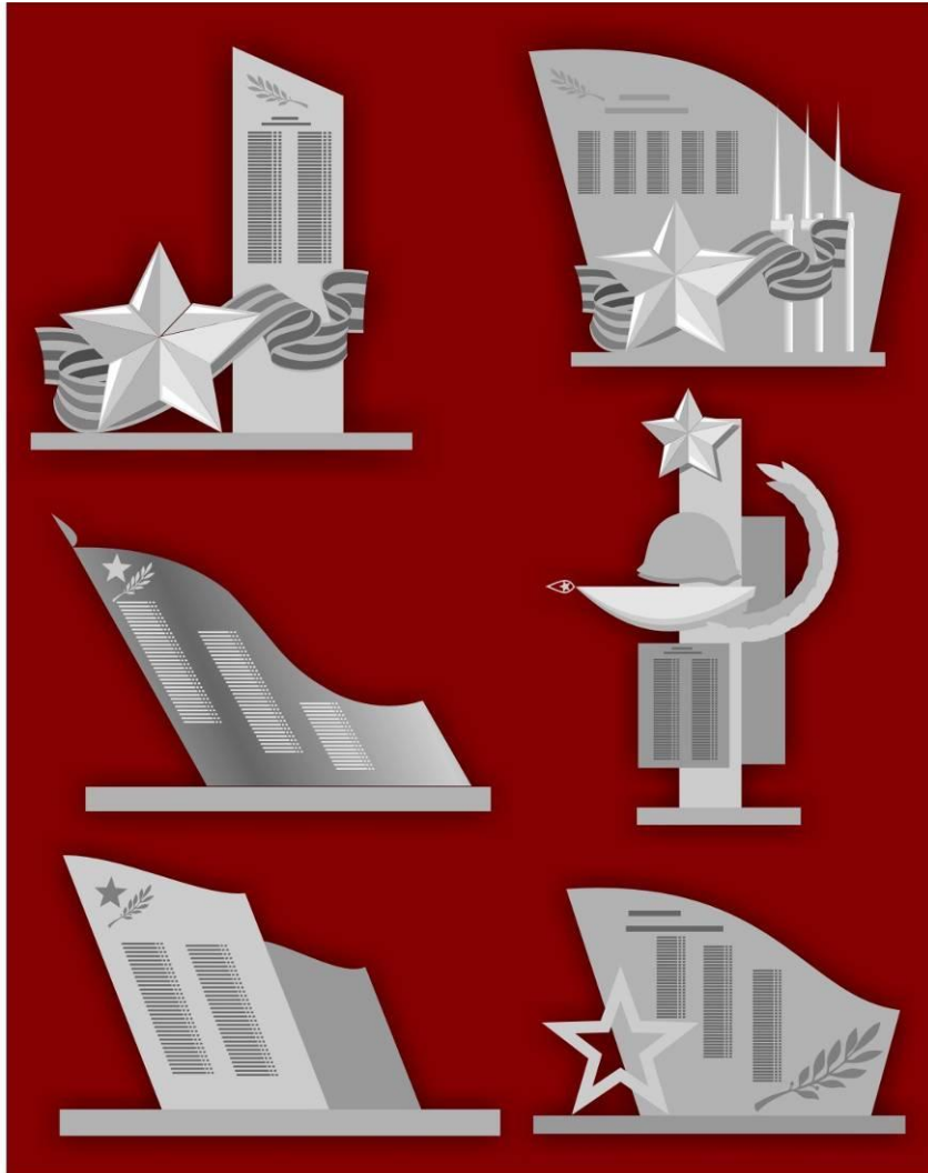
Варианты мемориальных композиций