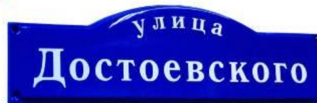
название улицы (серия "Сити", 82x25см)