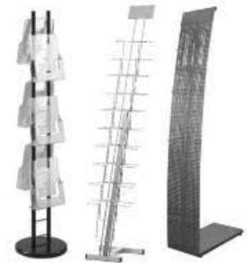
стойки для печатной продукции