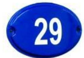
номер дома (серия "Сити", 29x20см)