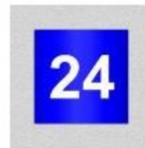
номер дома (20x20см)