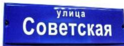
название улицы (серия "Таун", 62x20см)