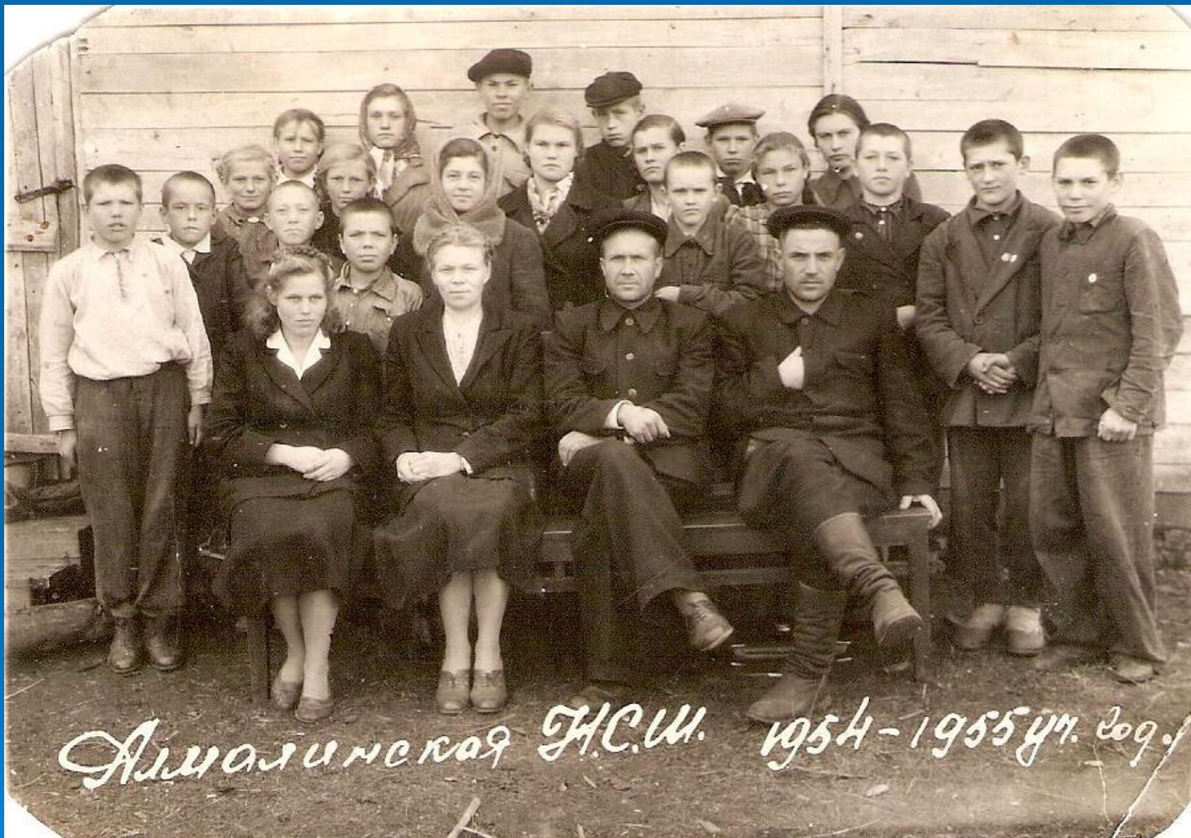
Алмалынская Ш.С.Ш. 1954-1955 уч. год.