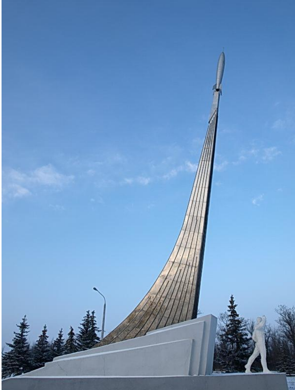
Место приземления Ю. Гагарина