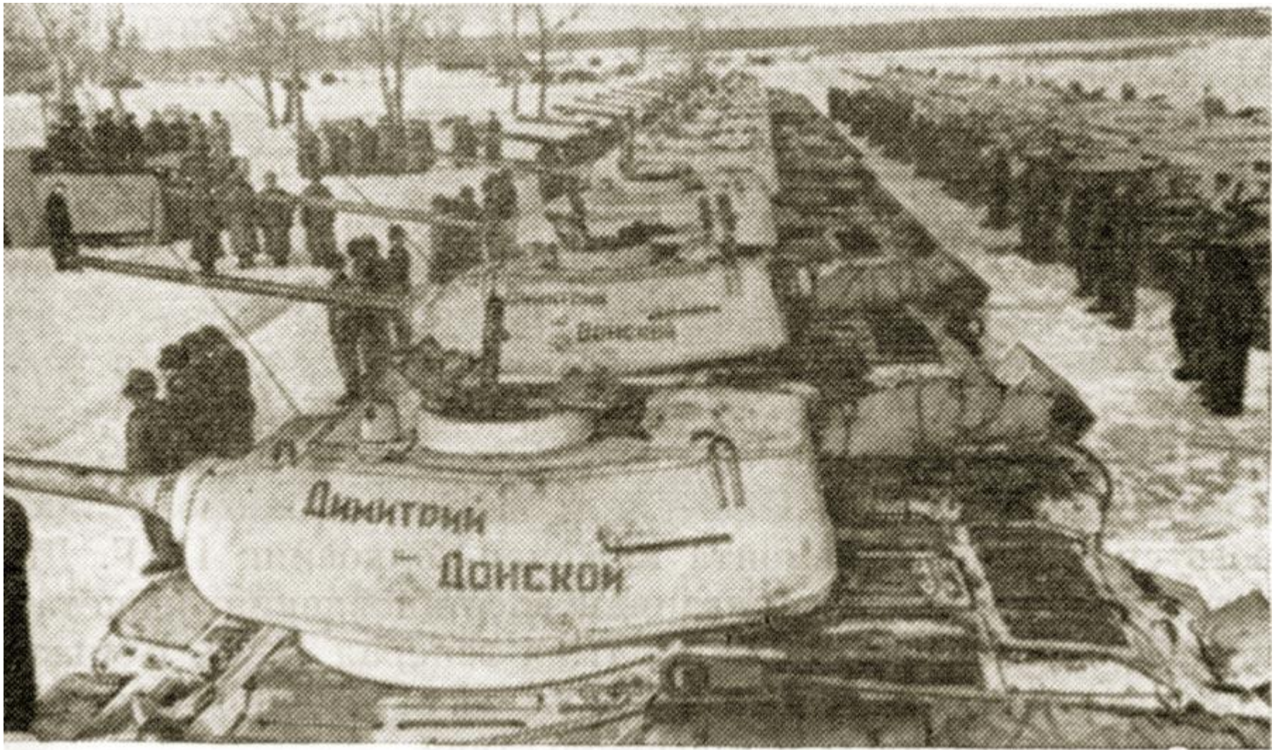
Передача воинам 1-й танковой армии колонны «Димитрий Донской»