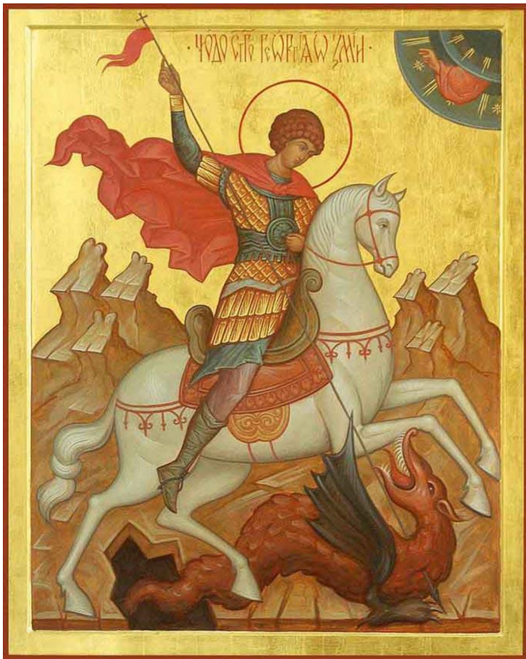
Святой Георгий Победоносец. Икона