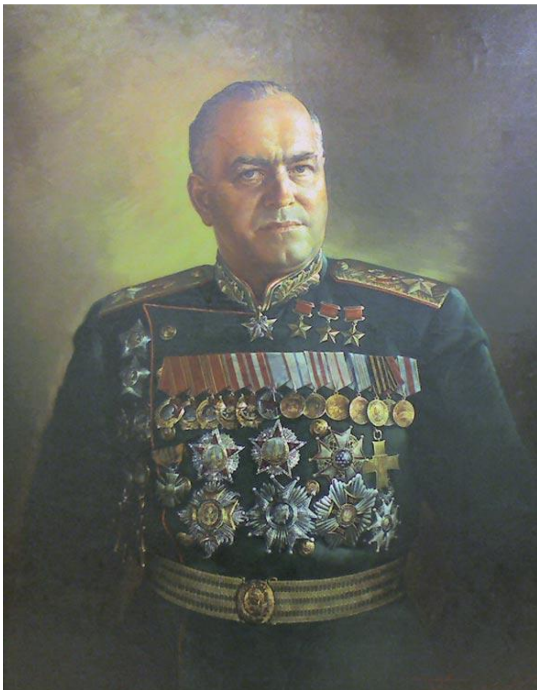
Маршал Георгий Константинович Жуков