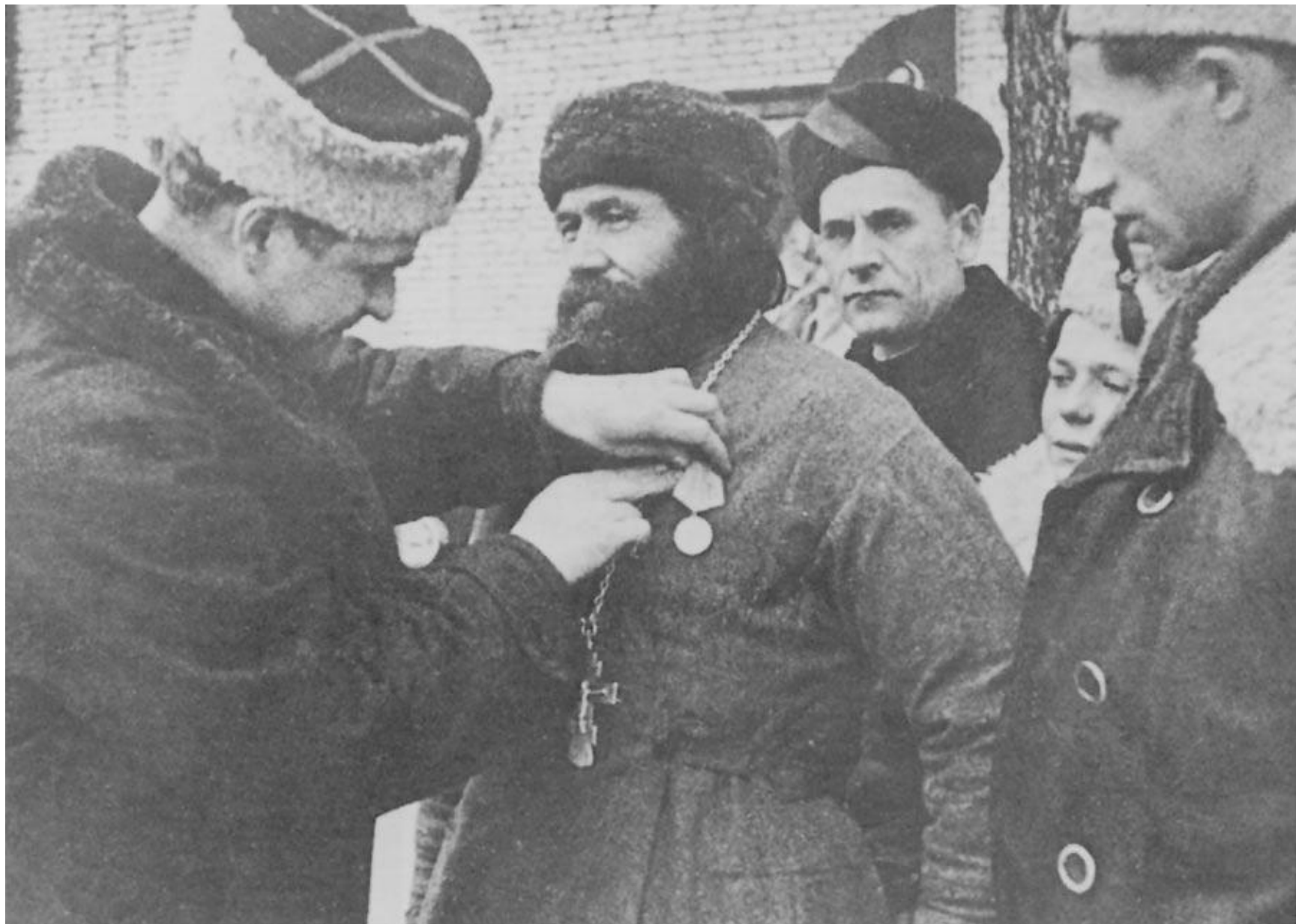
Вручение священнику медали в партизанском отряде. Фото 1943 г.