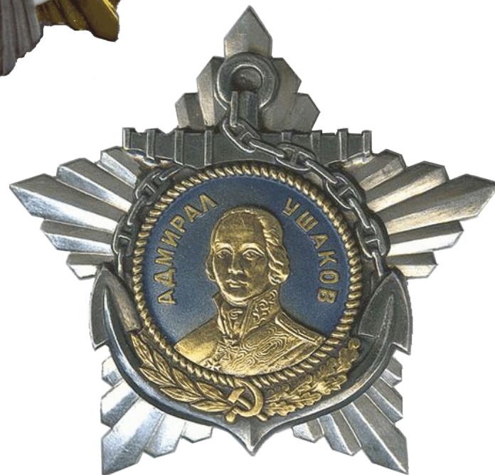
Ордена в честь великих русских полководцев. Учреждены в 1942 году