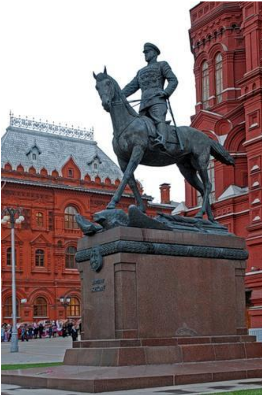
Памятник маршалу Георгию Жукову на Манежной площади в Москве