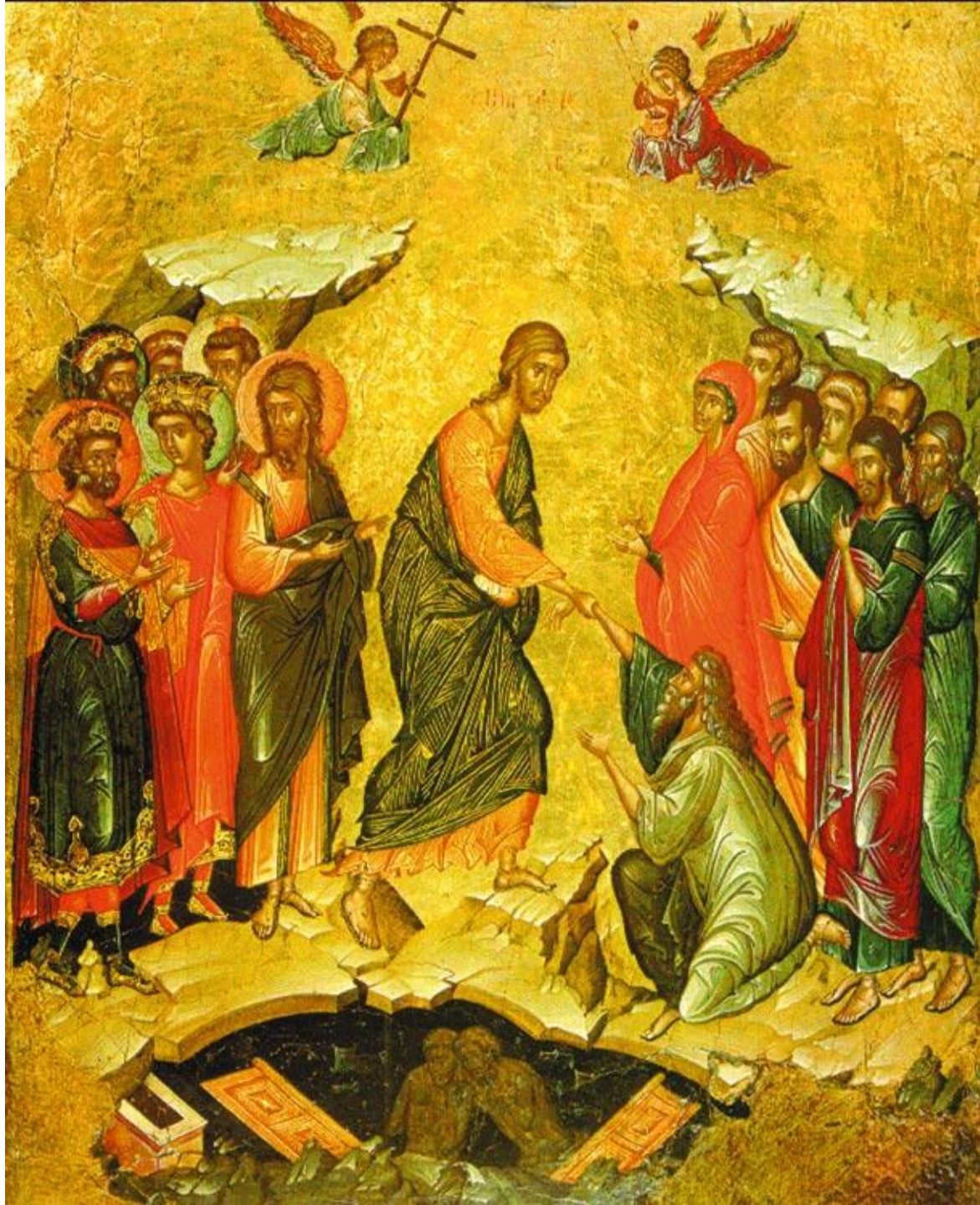
Воскресение Христово. Икона. XVI в.