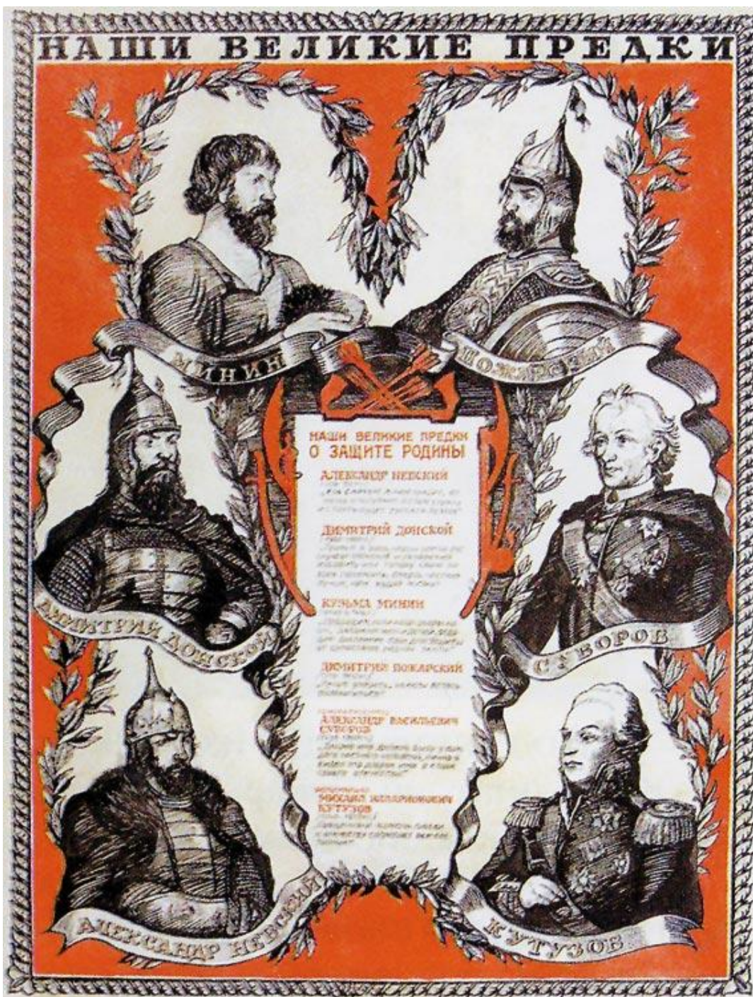
Патриотический плакат времён Великой Отечественной войны