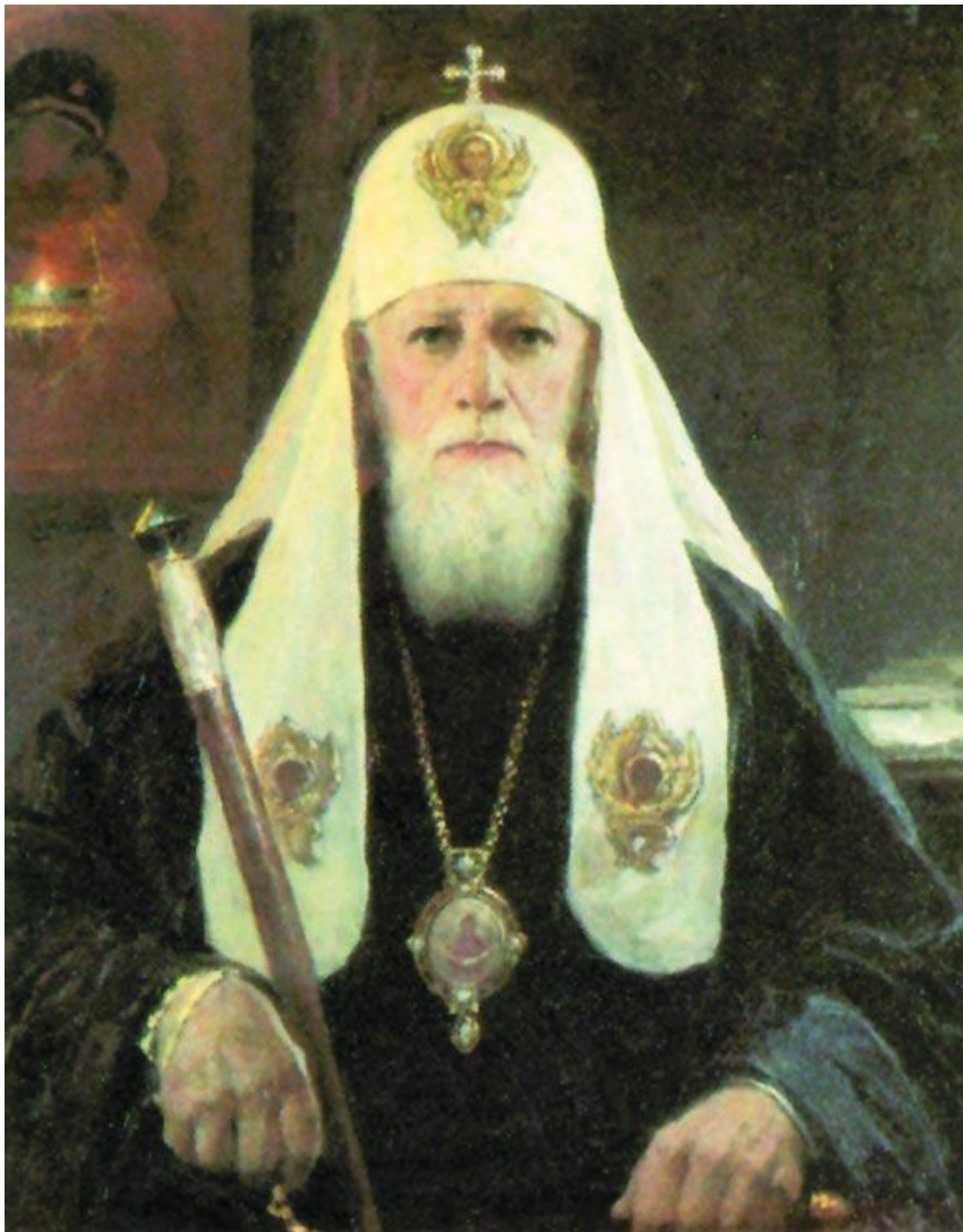
Патриарх Московский и всея Руси Алексий I