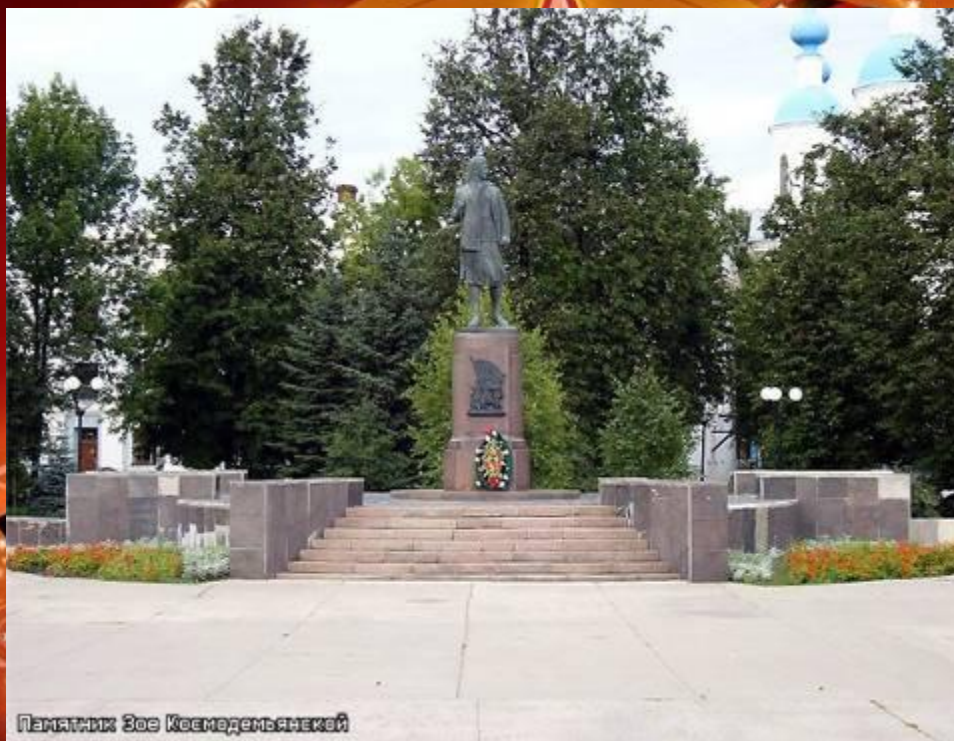
Памятник Зое Космодемьянской в г. Тамбове