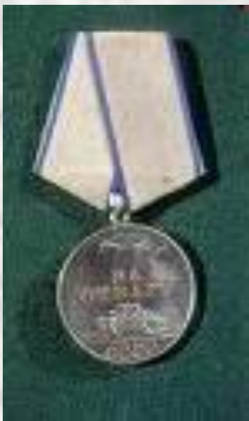
Медаль «За отвагу»