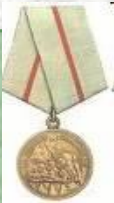
Медаль «За оборону Сталинграда»