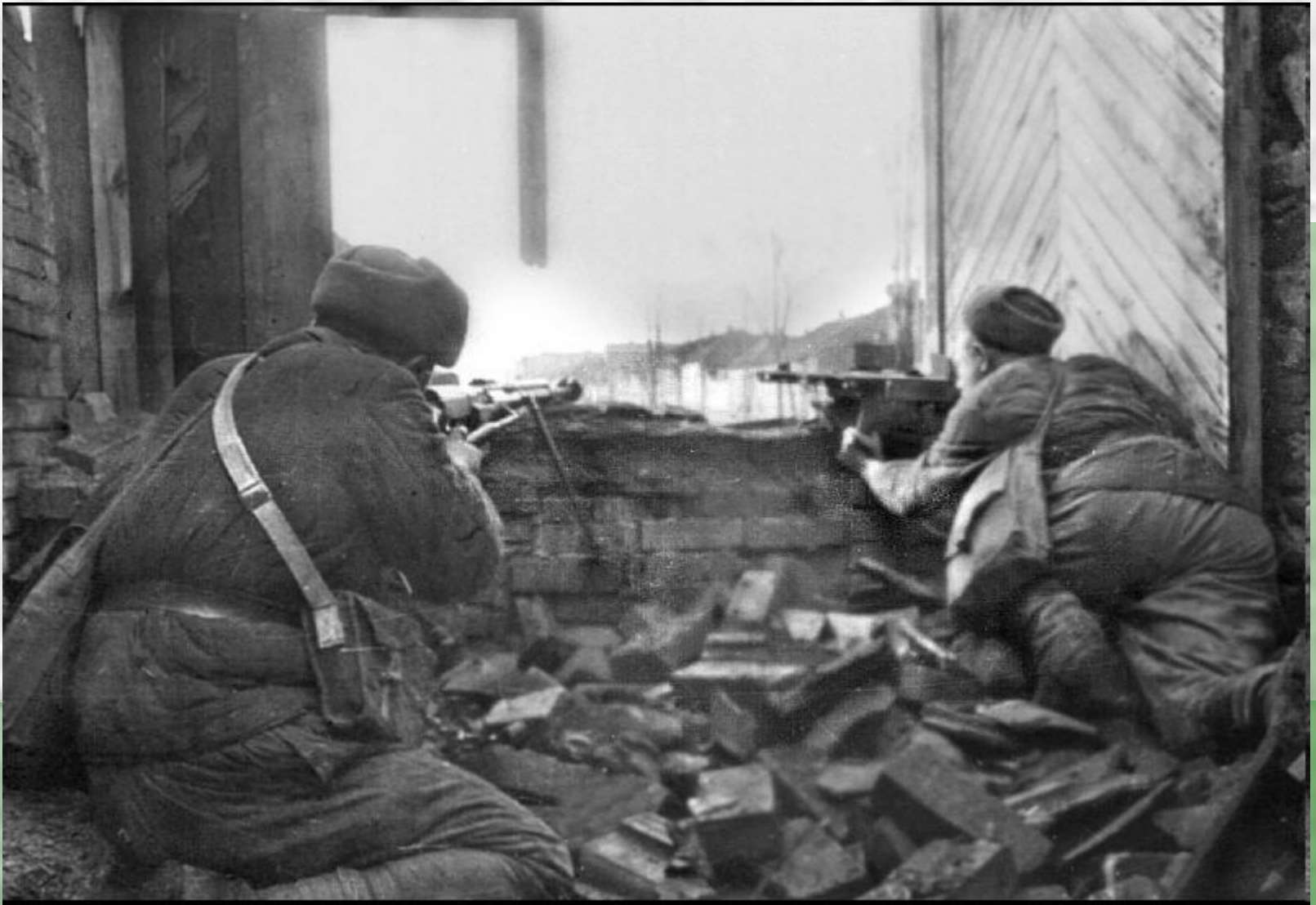
Будни Сталинградской битвы