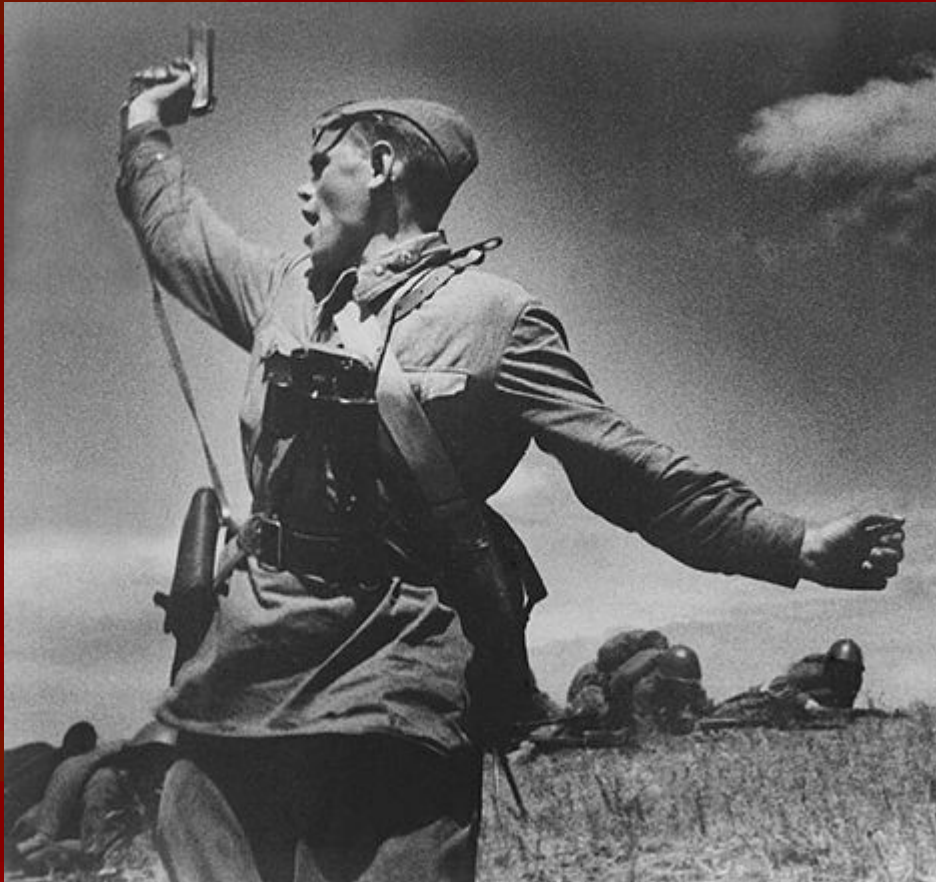
Фото, 1942 год.

да, солдат, а не генерал - главная фигура на войне.