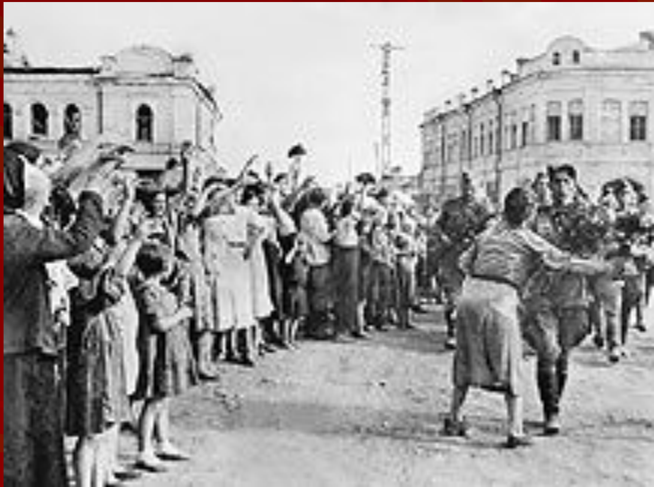
Фото. Жители Орла встречают победителей.