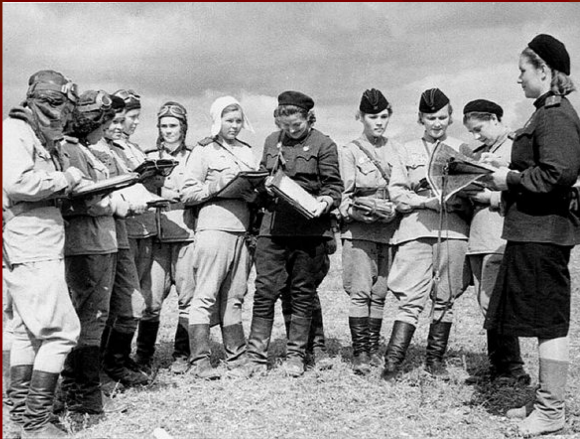
Летчицы 46-го гвардейского легкобомбардировочного полка. 1943 год.