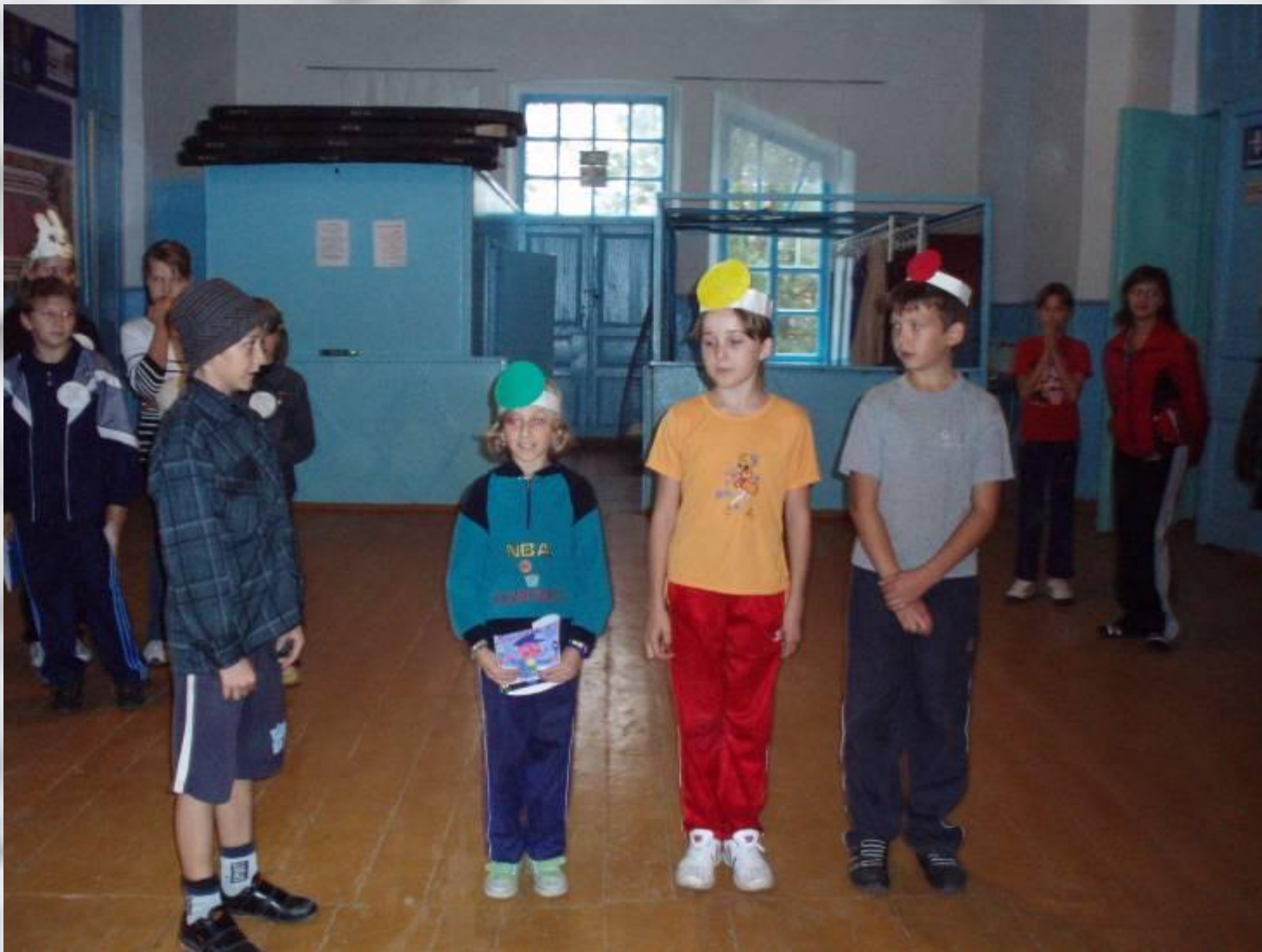
Команда ЮИД «Красный, желтый, зеленый» 5 «Б» класс