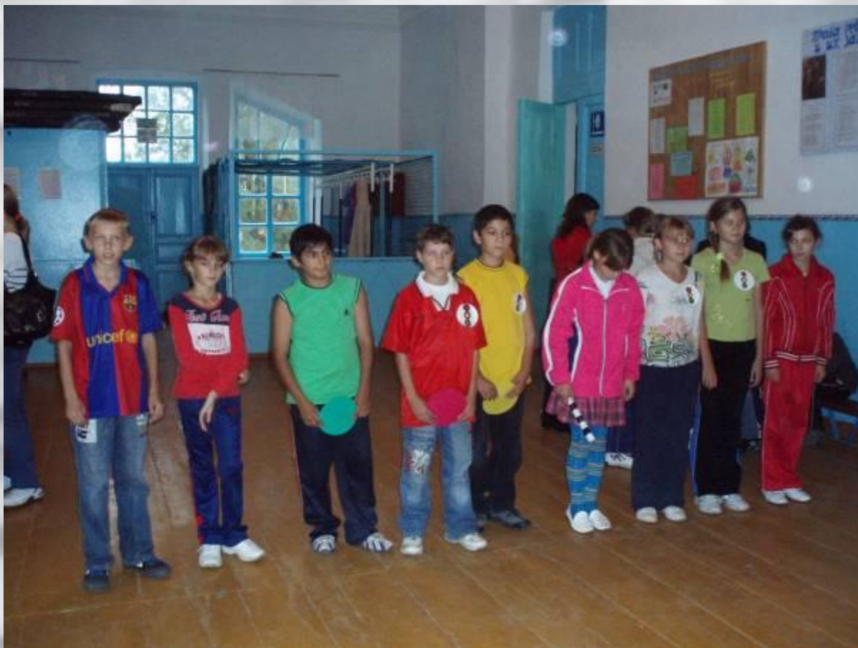
Команда ЮИД «Светофорик» 5 «А» класса