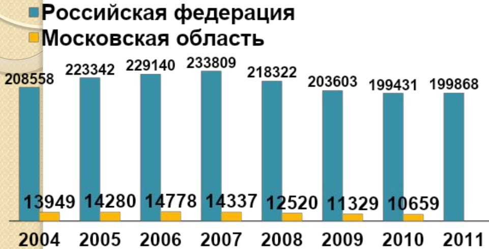
Общее число ДТП