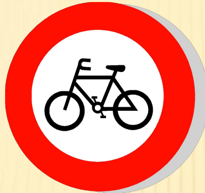
Движение на велосипедах запрещено