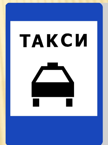
Место стоянки легковых такси