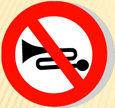
Подача звукового сигнала запрещена