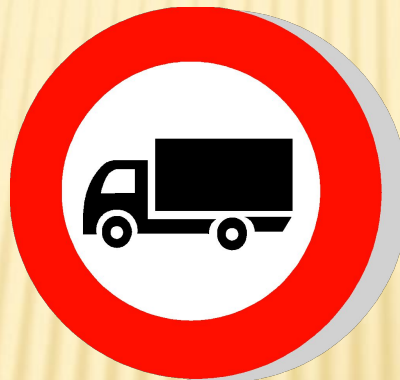
Движение грузовых автомобилей запрещено

Эти знаки что-либо запрещают водителю. Например, обгон, въезд, остановку. Они представляют собой белые или синие круги с красной каймой. На многих из них есть красная перечёркивающая линия.