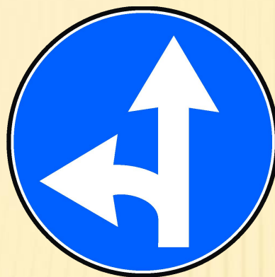
Движение прямо и налево

Эти знаки предписывают водителю в какую сторону можно двигаться по дороге. Они представляют собой синие круги с белым рисунком.