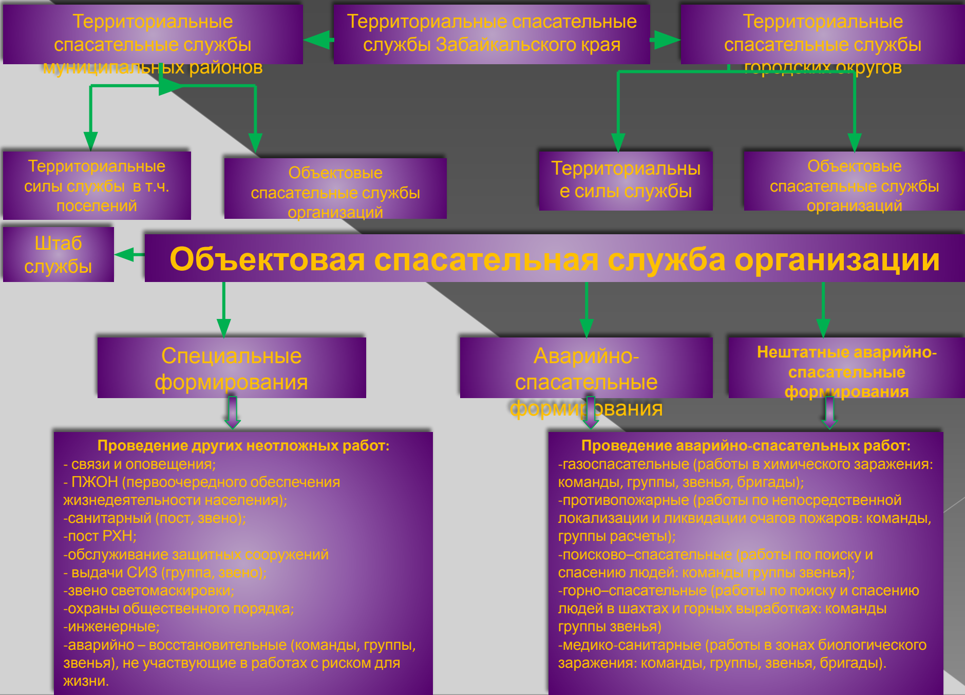
Схема организации спасательных служб Забайкальского края