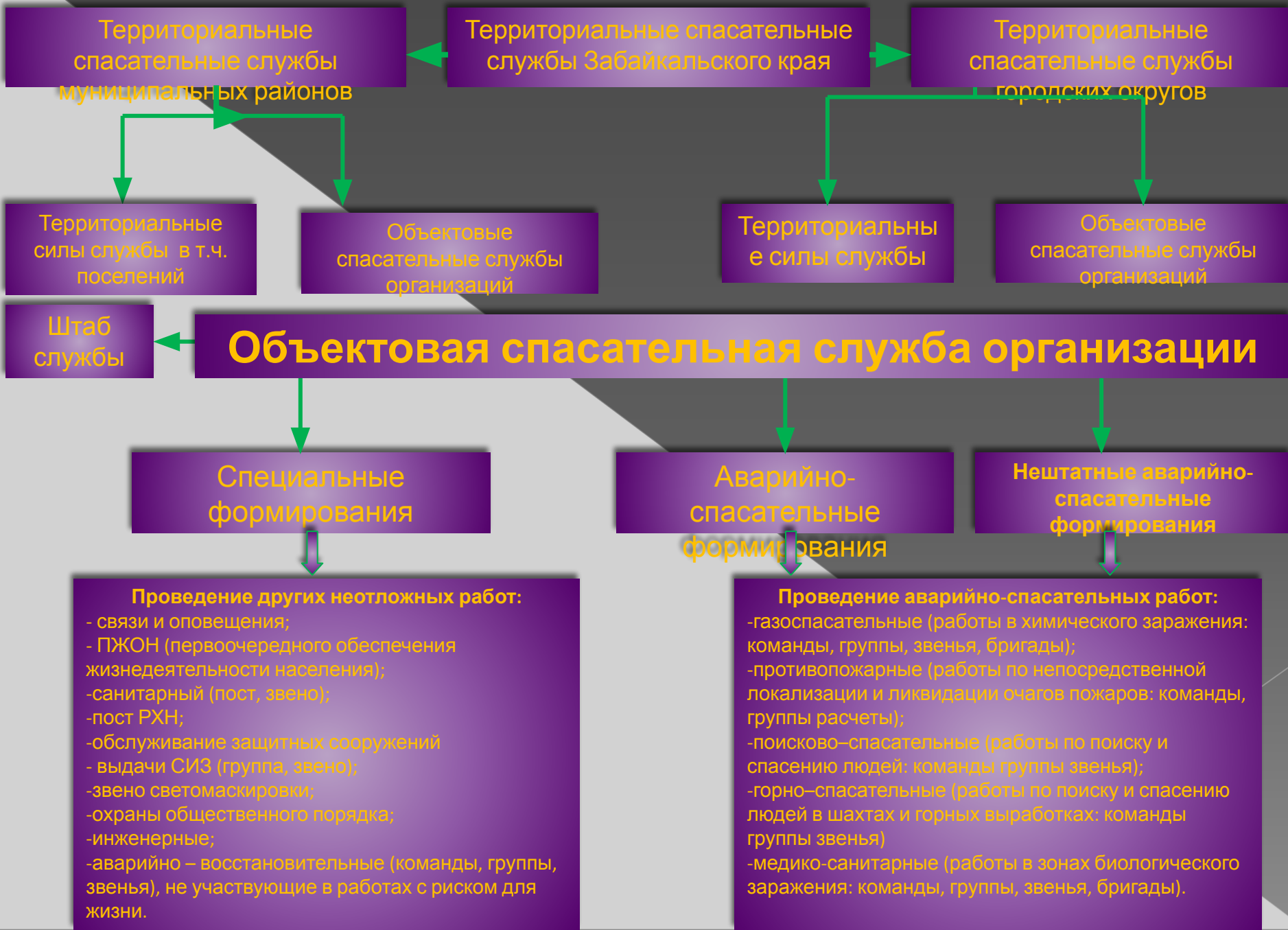
Схема организации спасательных служб Забайкальского края