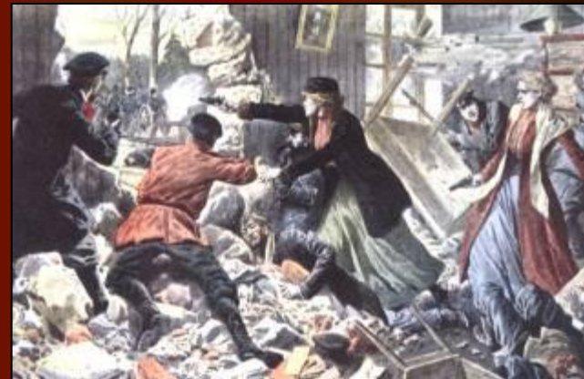
схема "Революция 1905-1907 года"

Разрозненность сил, отсутствие лидера, планов революции, стихийность, отсутствие поддержки восставших военными.