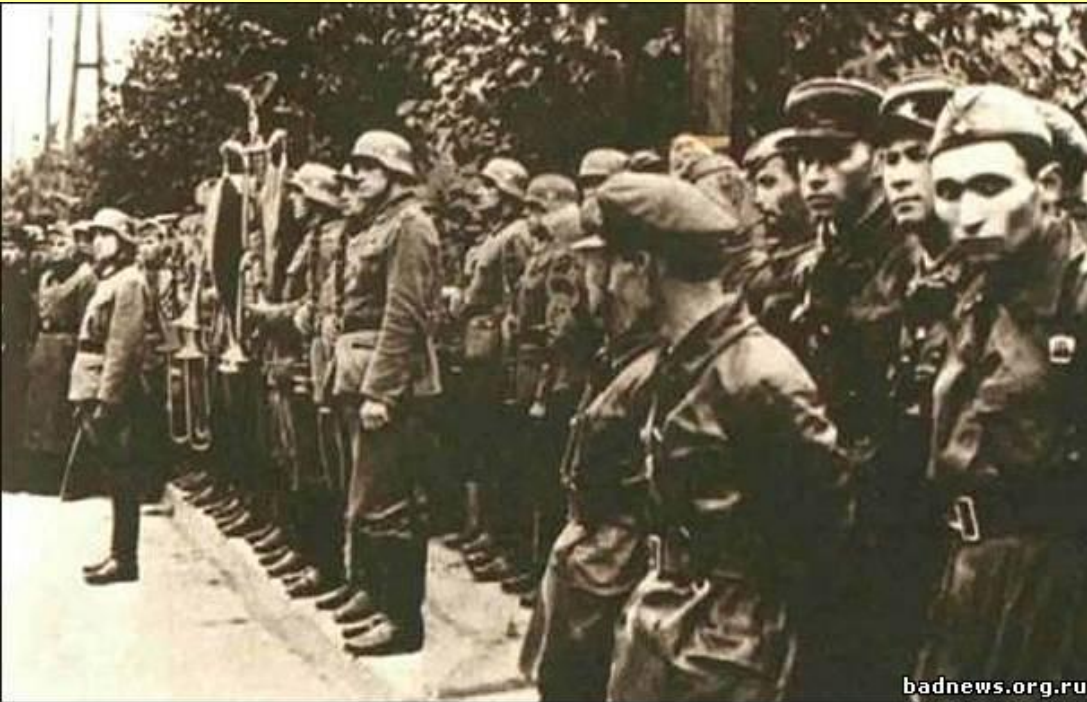
Совместный парад немецких и советских войск в г. Бресте. Сентябрь 1939 г.

К моменту вступления Красной Армии в Польшу германские войска далеко перешли демаркационную линию, установленную пактом