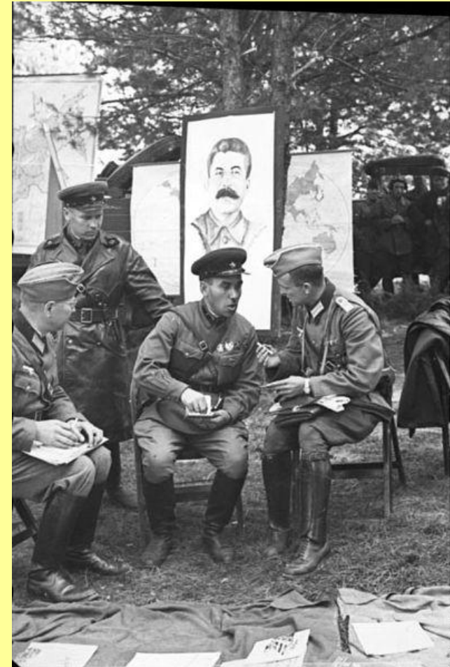
Советские и немецкие солдаты в Бресте. Сентябрь 1939 г.