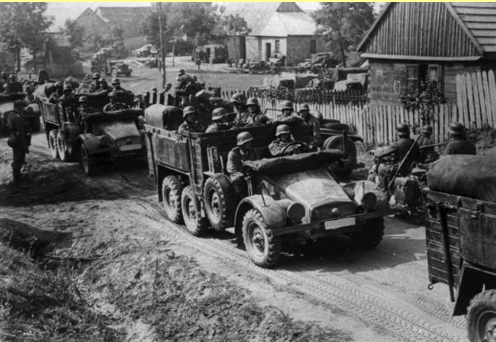
Немецкие войска в Польше. Сентябрь 1939 г.

Военные историки полагают, что поражение Польши было predeterminedено не столько численностью немецких войск, сколько их превосходством в танках и средствах механизации, что позволило совершать глубокие прорывы на обширных открытых пространствах Польши.