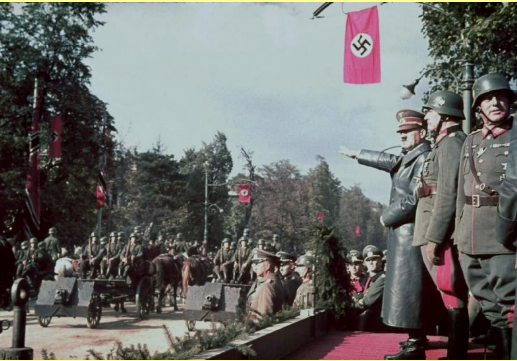
А. Гитлер принимает парад немецких войск в Варшаве. 4 октября 1939 г.

Польское правительство покинуло Варшаву еще 5 сентября и 17 сентября прибыло в Румынию.