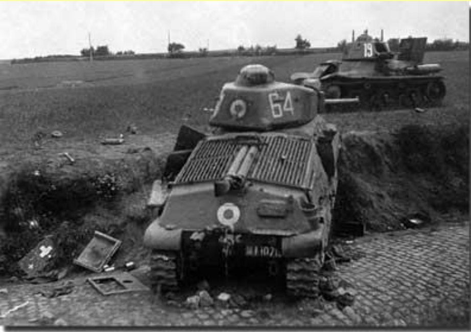
Французские танки «Гочкис» Н-35 и Сомуа S-35

Потери на линии Мажино за сентябрь-декабрь 1939 г. (убитые и раненые):