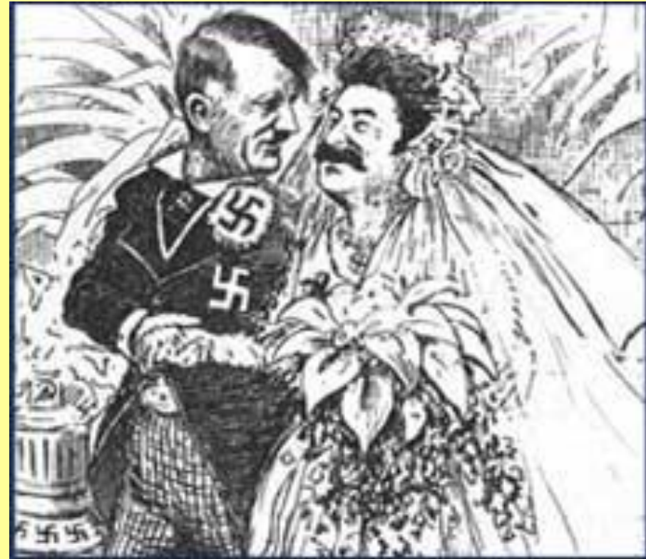
«Как долго продлится медовый месяц?» Английская карикатура на Гитлера и Сталина.