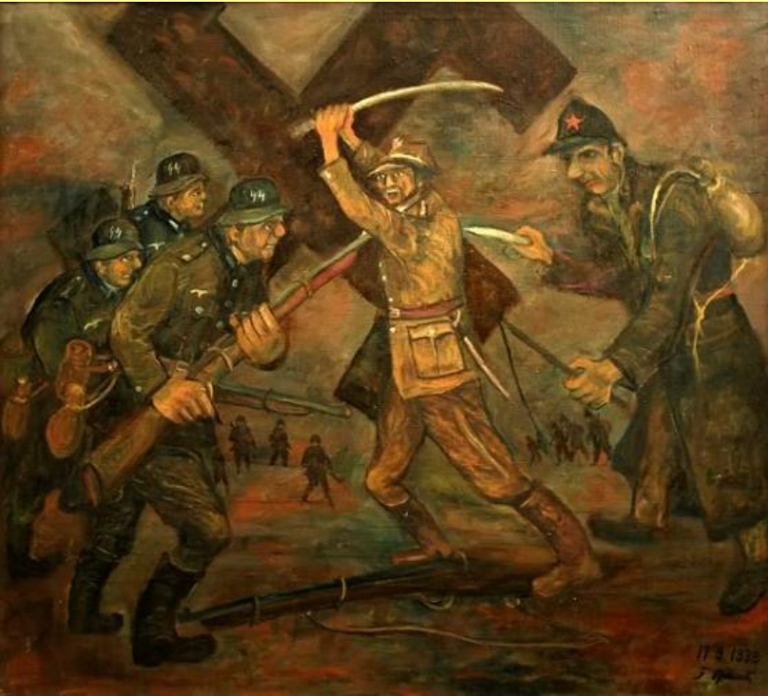
«Советский нож в спину. 17 сентября 1939 г.» Худ. Ф. Адамик.

Польское командование приказало своим войскам не оказывать сопротивления Красной Армии.