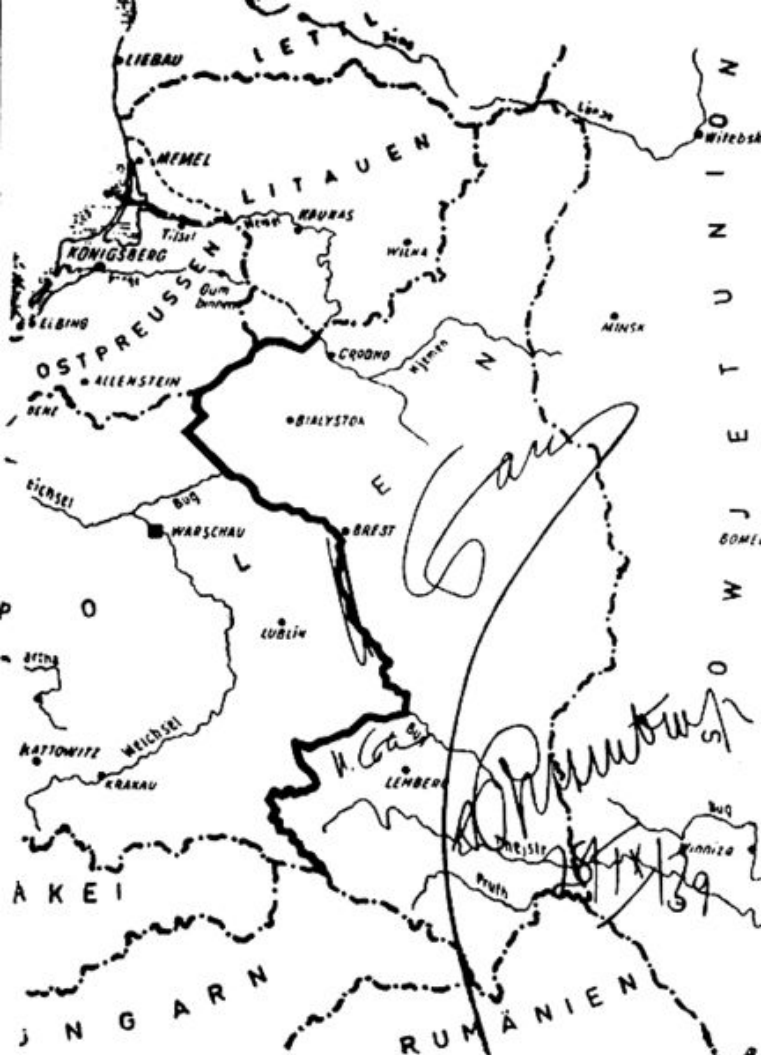
Карта раздела Восточной Европы по секретному протоколу к советско-германскому пакту от 28.09.1939 г.

Виленская область Польши, как и было решено 23 августа, перешла к Литве.