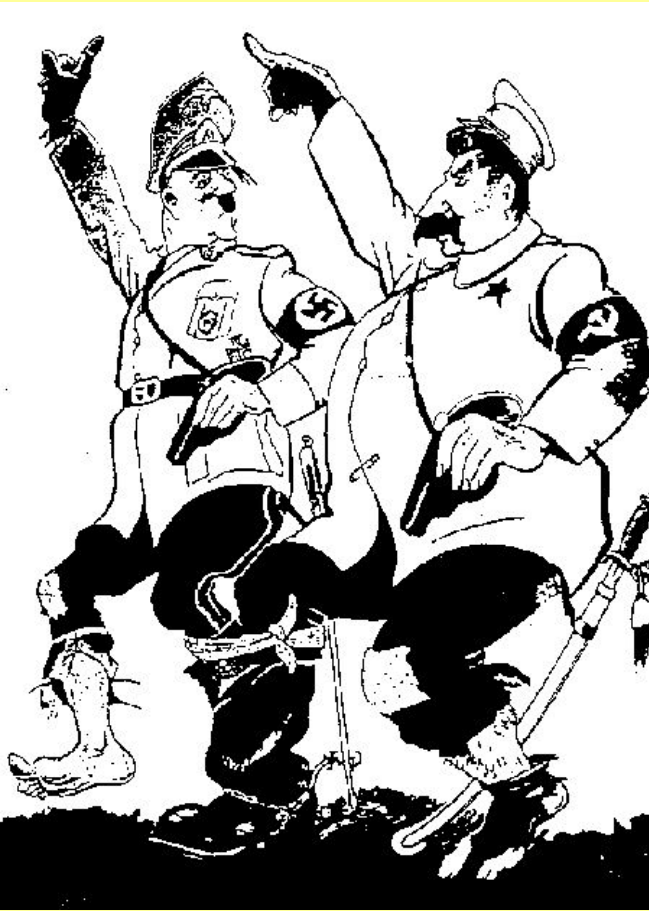
Английская карикатура на Гитлера и Сталина.