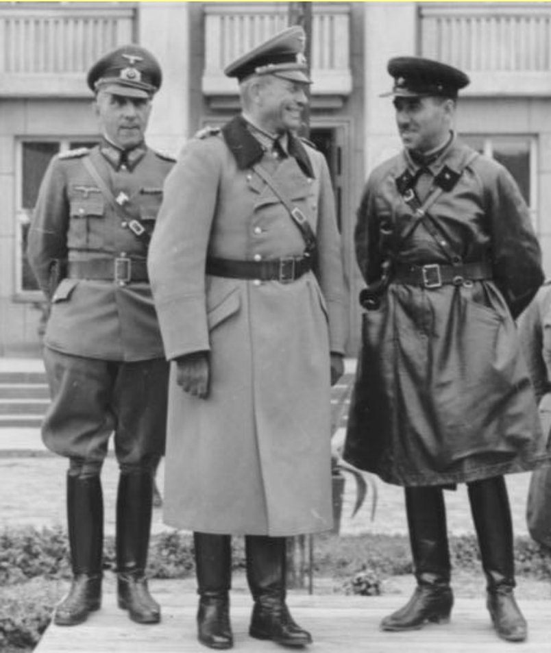
Генерал Г. Гудериан и комбриг Кривошеин на параде в Бресте. Сентябрь 1939 г.