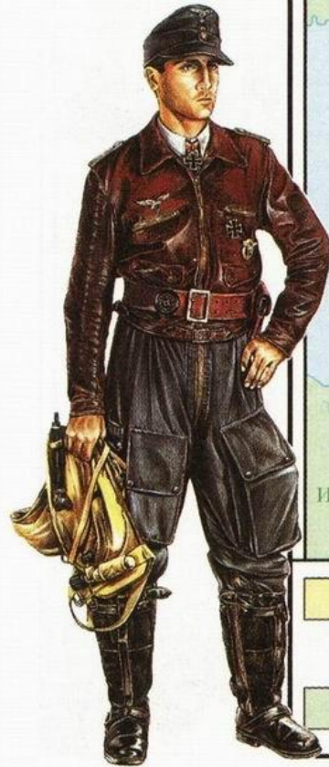
Немецкий военный лётчик времён Второй мировой войны.