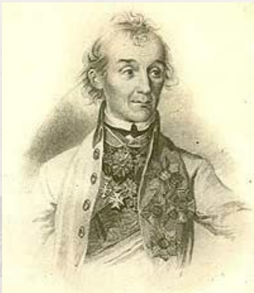
Суворов А. В. (1730-1800гг)

Из-за создаваемых Державиным образов полководцев – Репнина, Суворова, Румянцева – как бы выступает очертания всего русского народа.