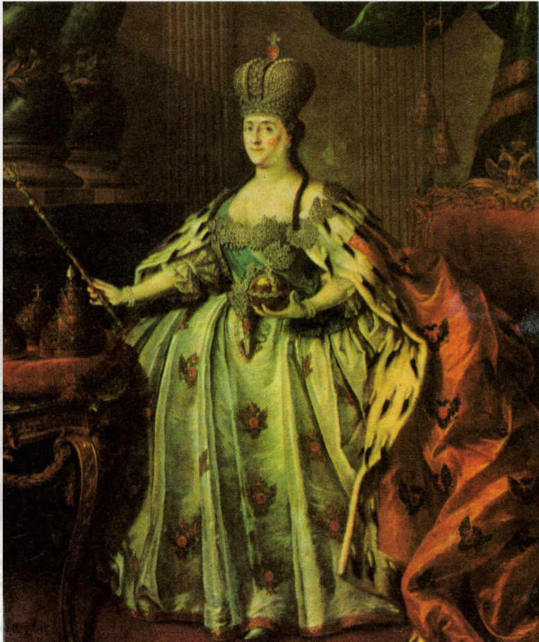
Екатерина II (1729 – 1796гг)

Под Фелицей подразумевалась Екатерина II. Многие писатели современники, в особенности литературная молодежь, восторженно приветствовали автора «Фелицы» за то, что он проложил «на Парнас» «путь непротоптанный и новый».