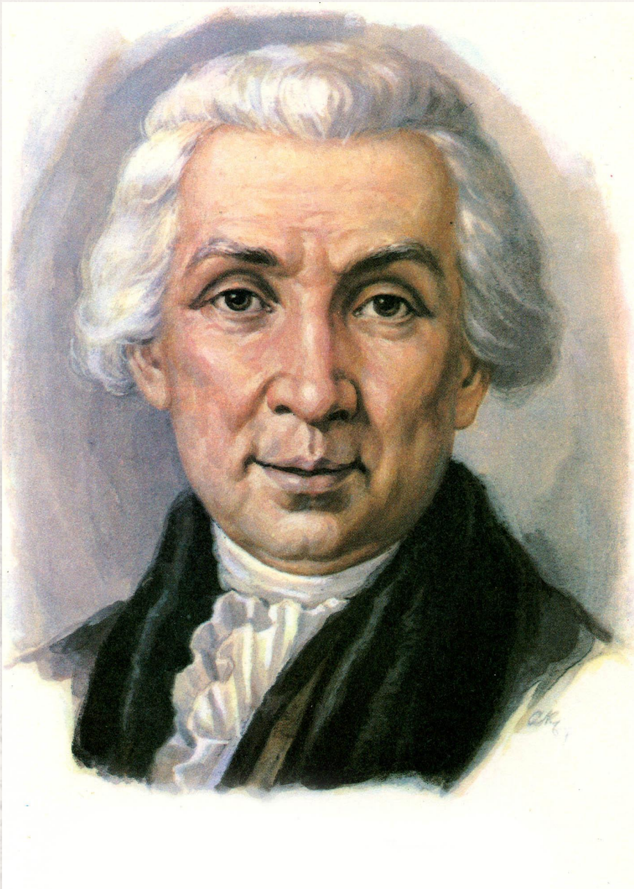
Гаврила Романович Державин (1743–1816гг)