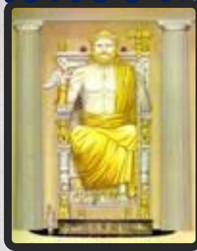
Статуя Зевса Олимпийского