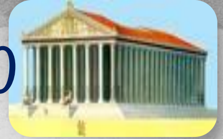
Храм Артемиды Эфесской