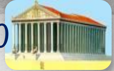
Храм Артемиды Эфесской