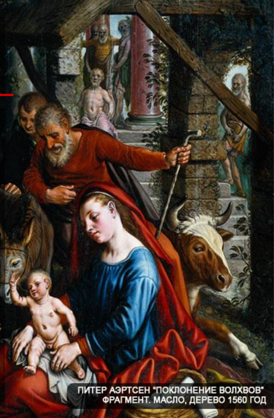
ПИТЕР АЭРТСЕН "ПОКЛОНЕНИЕ ВОЛХВОВ" ФРАГМЕНТ. МАСЛО, ДЕРЕВО 1560 ГОД

- Идите и тщательно все разузнайте о младенце. Когда вы Его найдете, известите и меня, чтобы я смог пойти и поклониться Ему.