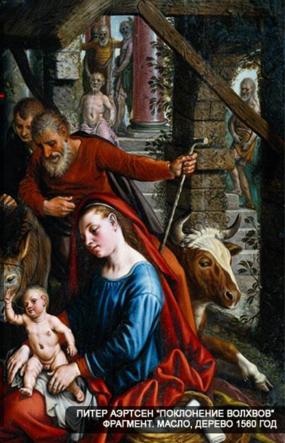
ПИТЕР АЭРТСЕН "ПОКЛОНЕНИЕ ВОЛХВОВ" ФРАГМЕНТ. МАСЛО, ДЕРЕВО 1560 ГОД

Выслушав наказ царя, мудрецы отправились в путь. Звезда, которую они видели на востоке, шла впереди них, пока наконец не остановилась над местом, где был младенец. Увидев, что звезда остановилась, мудрецы очень обрадовались. Когда они вошли в дом и увидели младенца и Его мать Марию, они поклонились Ему и поднесли Ему подарки: золото, ладан и смирну. Ночью во сне они были предупреждены о том, что им нельзя возвращаться к Ироду, и вернулись в свою страну другим путем.