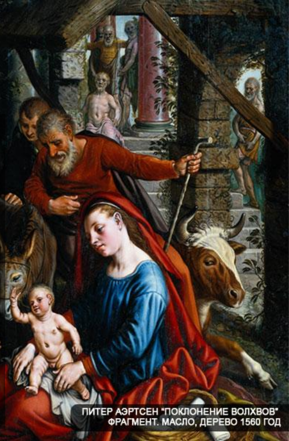
ПИТЕР АЭРТСЕН "ПОКЛОНЕНИЕ ВОЛХВОВ" ФРАГМЕНТ. МАСЛО, ДЕРЕВО 1560 ГОД

Услышав об этом, царь Ирод встревожился, а с ним и весь Иерусалим. Царь созвал к себе всех первосвященников и учителей закона и спросил их, где должен родиться Мессия.