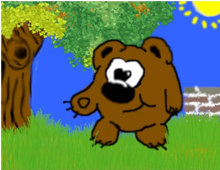
ГИМНАЗИЯ Г. ВЕРЕЩАГИНО