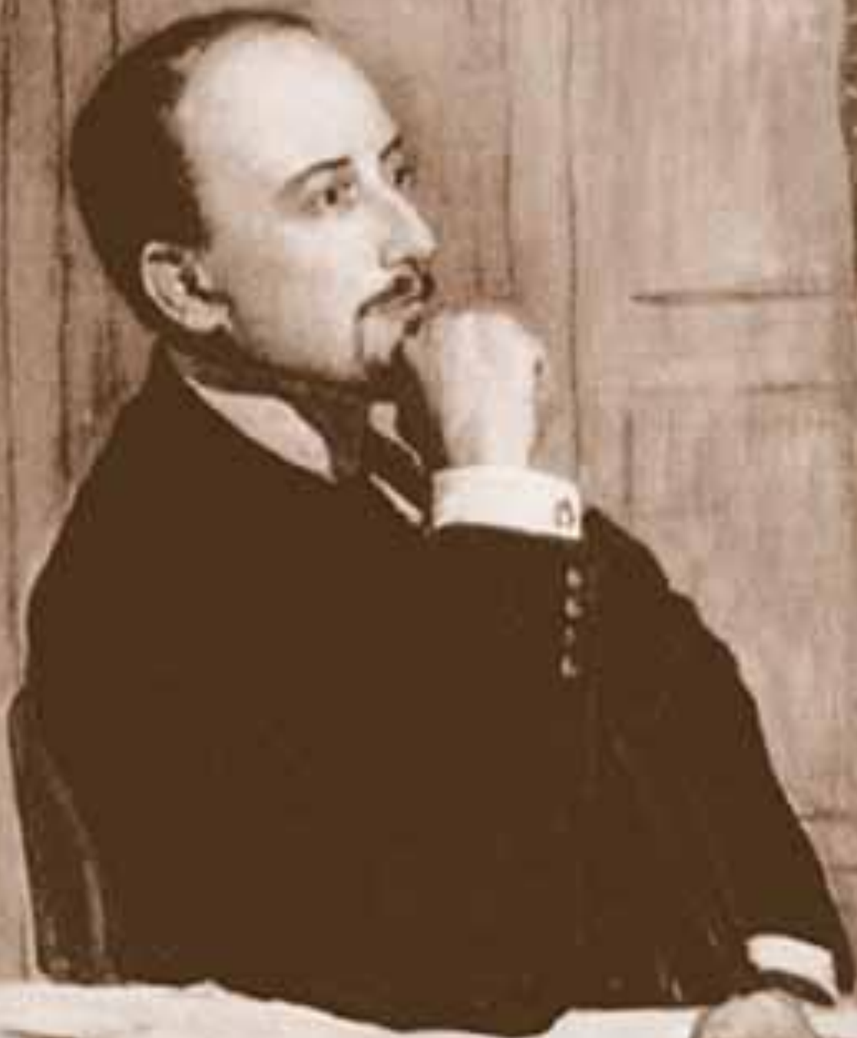
Евгений Евгеньевич Лансере (1875-1946) художник-иллюстратор