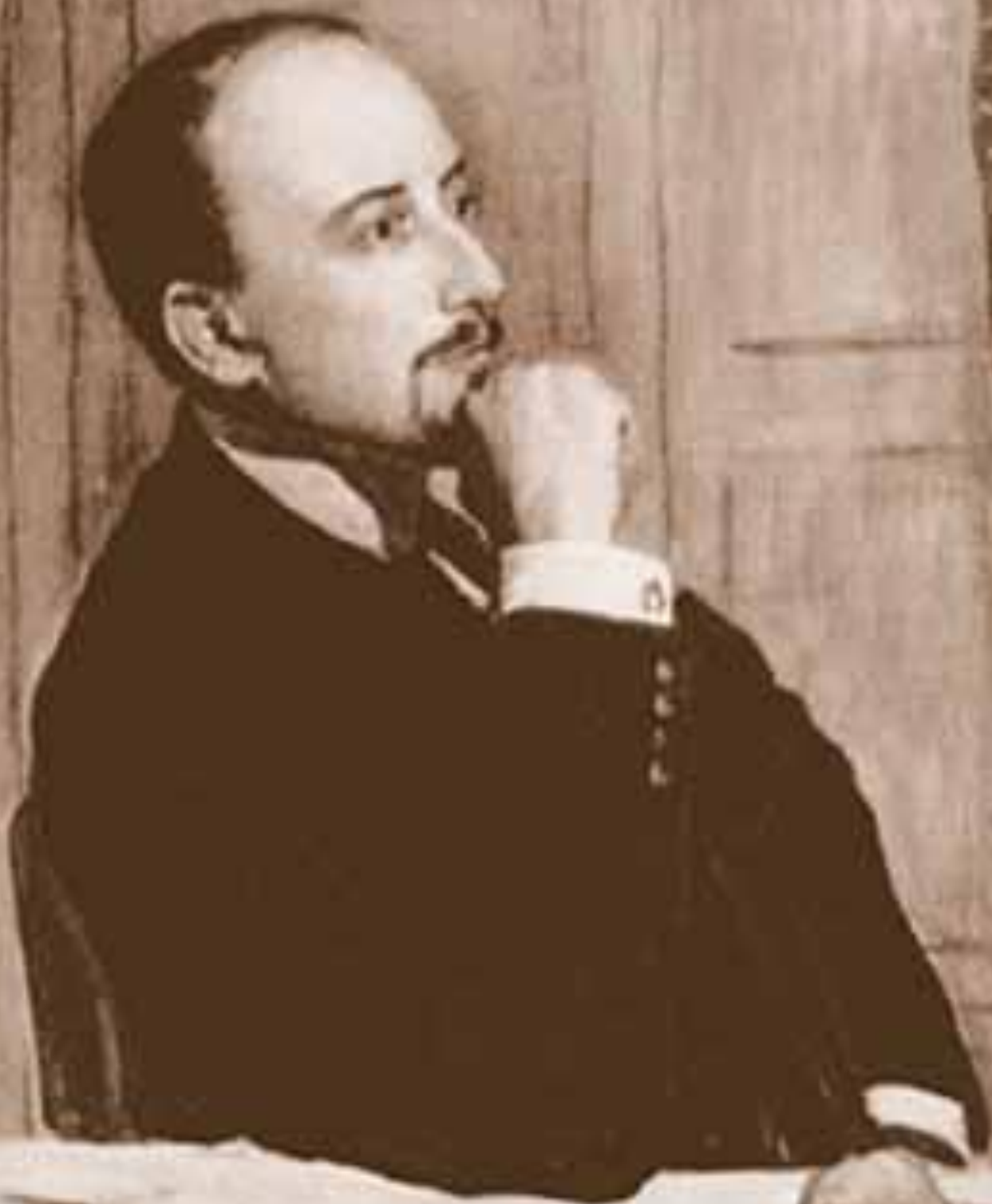
Евгений Евгеньевич Лансере (1875-1946) художник-иллюстратор