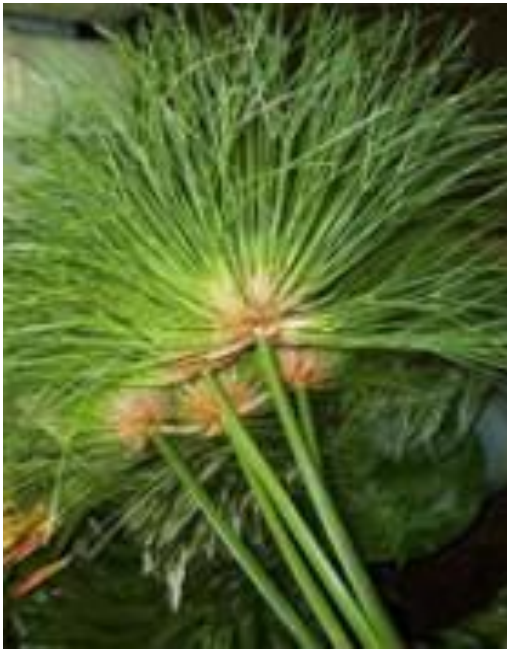
Стебли папируса Папирус – водный травяной цветок