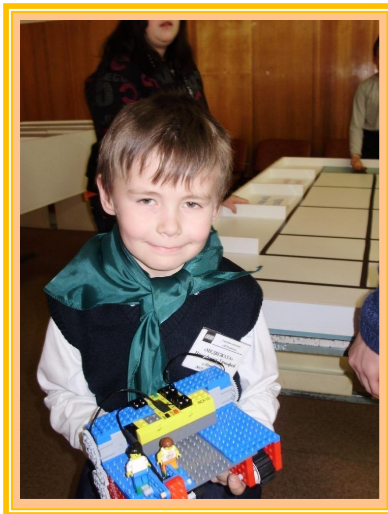
Первая победа в городском туре состязаний лего-роботов «Золотая осень». Ноябрь, 2011год