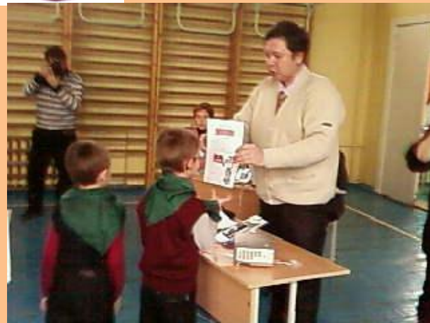
Наше первое участие в городских соревнованиях. Ноябрь, 2010 год