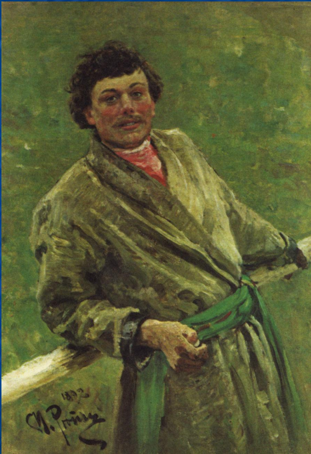
ИЛЬЯ ЕФИМОВИЧ РЕПИН БЕЛОРУС