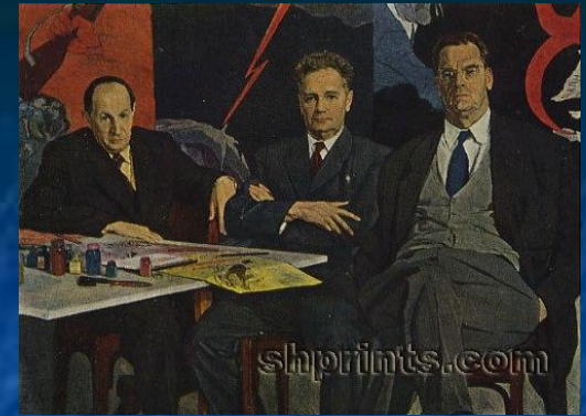
А.М. Корин «Кукрыниксы»