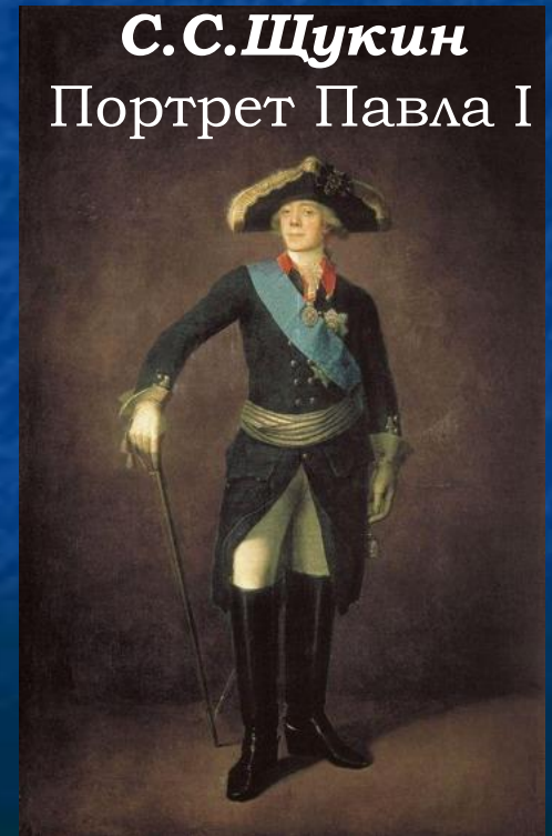
С.С. Щукин Портрет Павла I