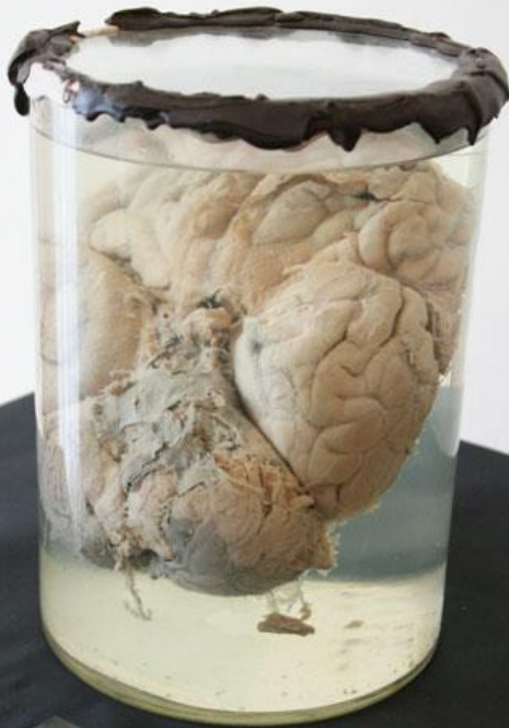
...ТОВНОЙ МОЗГ. ИНСУЛЬТ ...как выкладывает или ...его черепицу ...испит от