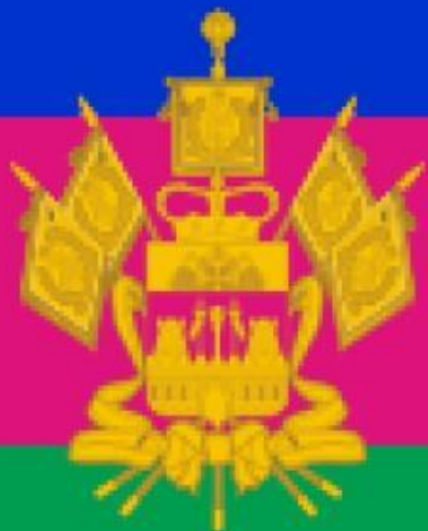
Флаг Краснодарского края