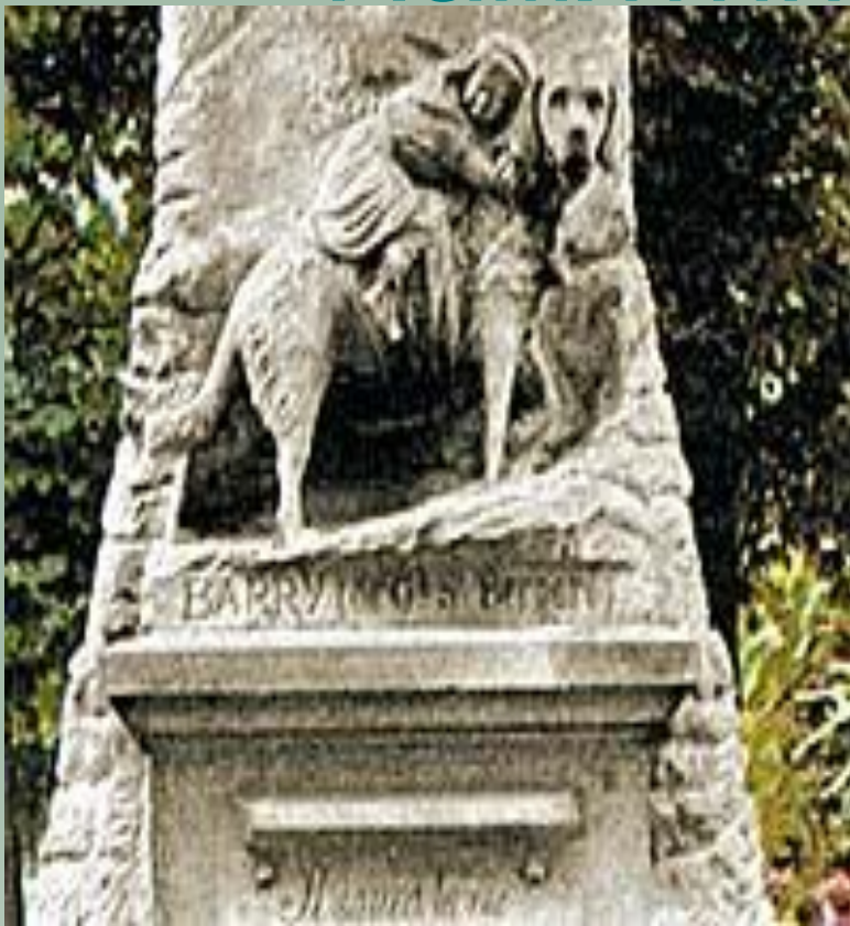
Сенбернару Барри, спасшему сорок человек в Альпах