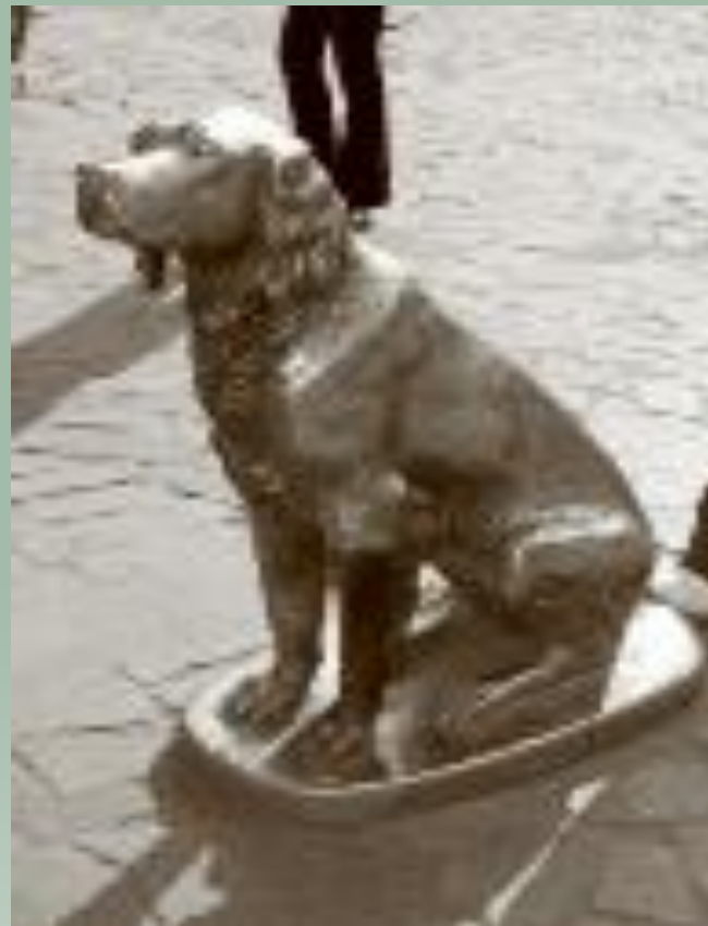
Белому Биму Черное ухо