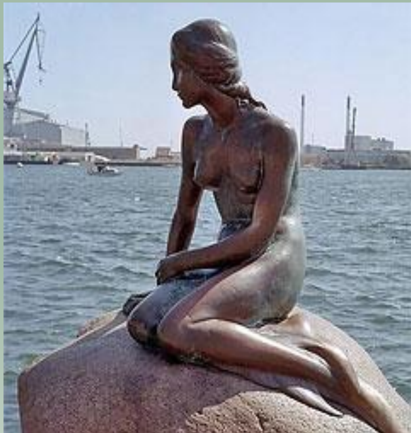
Русалочке Г. Х. Андерсена