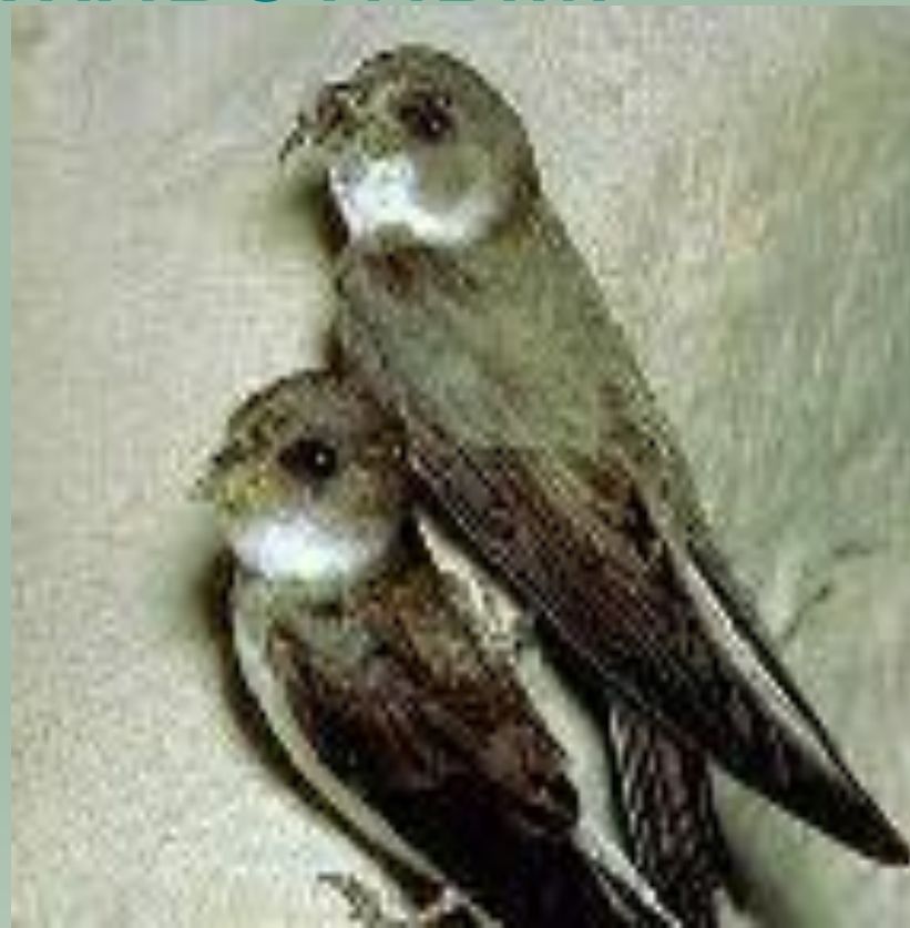
Ласточкам за уничтожение комаров