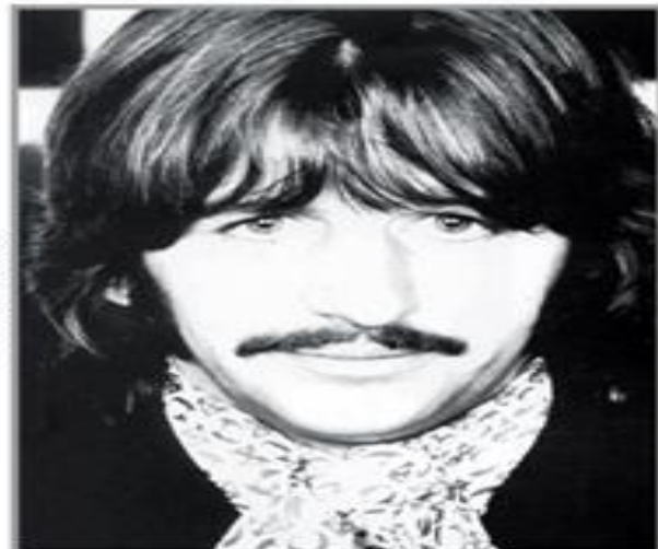
Джордж Харрисон 25.02.1943 – 29.11.2001 вокал, гитара, ситар, клавишник