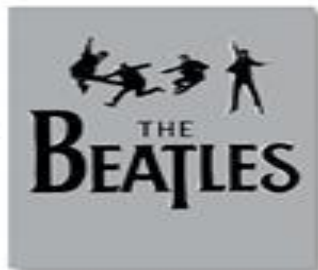
Ринго Старр настоящее имя Ринго Старри род. 07.07.1940 вокал, ударник, перкуссия, клавишник