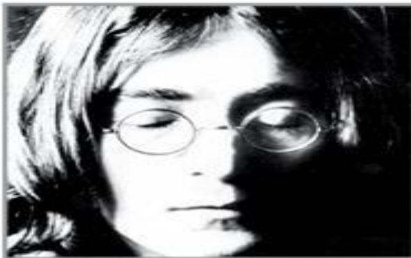
ДЖОН ЛЕННОН полное имя Джон Уинстон Леннон 09.10.1940 – 08.12.1980 вокала, гитара, гармоника, клавишник