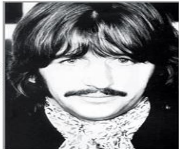
Джордж Харрисон 25.02.1943 – 29.11.2001 вокала, гитара, ситар, клавишник