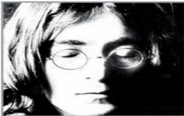
ДЖОН ЛЕННОН полное имя Джон Уинстон Леннон 09.10.1940 – 08.12.1980 вокал, гитара, гармоника, клавишник