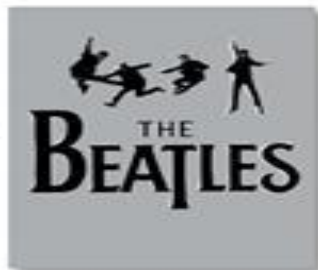
Ринго Старр настоящее имя Ринго Старри род. 07.07.1940 вокала, ударник, перкуссия, клавишник