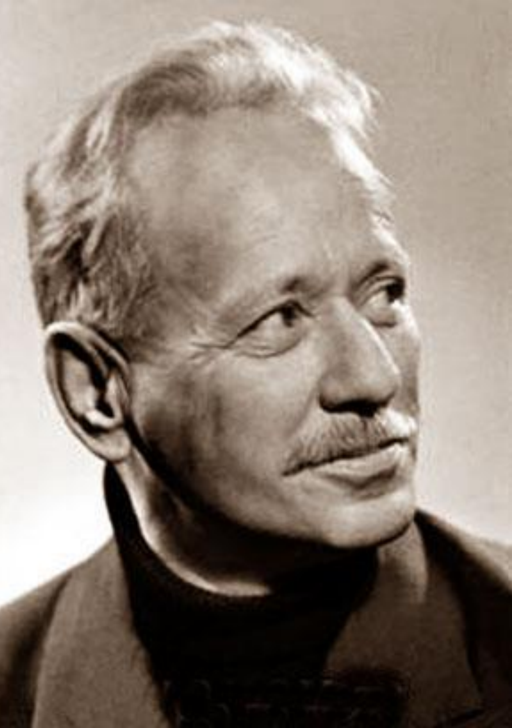
Михаил Александрович Шолохов ( 1905 – 1984)