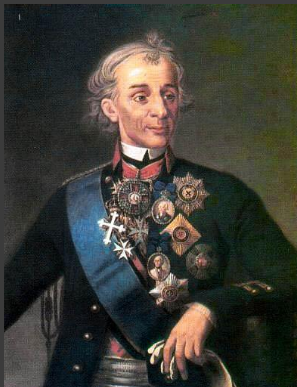
Генералиссимус князь Александр Васильевич Италийский, граф Суворов-Рымникский