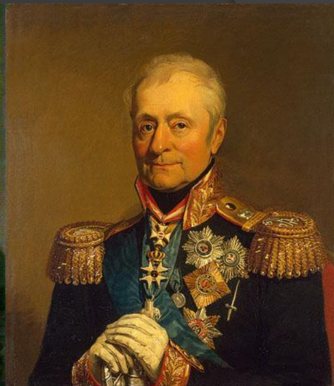
Генерал от кавалерии граф Леонтий Леонтьевич Беннигсен