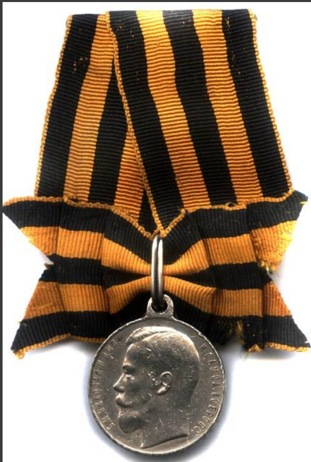
Георгиевская медаль «За храбрость» 3- й ст.

Учреждена 10 августа 1913 года вместо медали «За храбрость», и причислена к Ордону Св. Георгия.