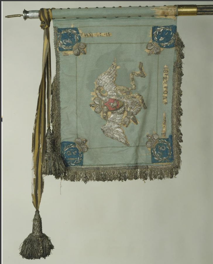
Георгиевский штандарт лейб-гвардии Кирасирского Его Величества полка.