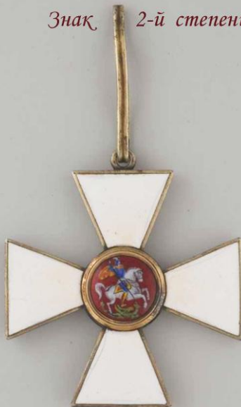
Знак 2-й степени