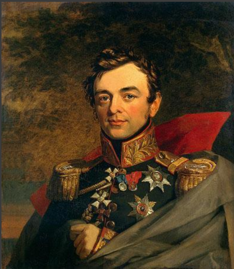
Генерал-фельдмаршал светлейший князь Иван Фёдорович Варшавский, граф Паскевич-Эриванский