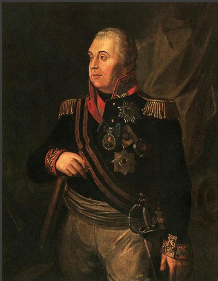
Генерал-фельдмаршал светлейший князь Михаил Илларионович Голенищев- Кутузов-Смоленский