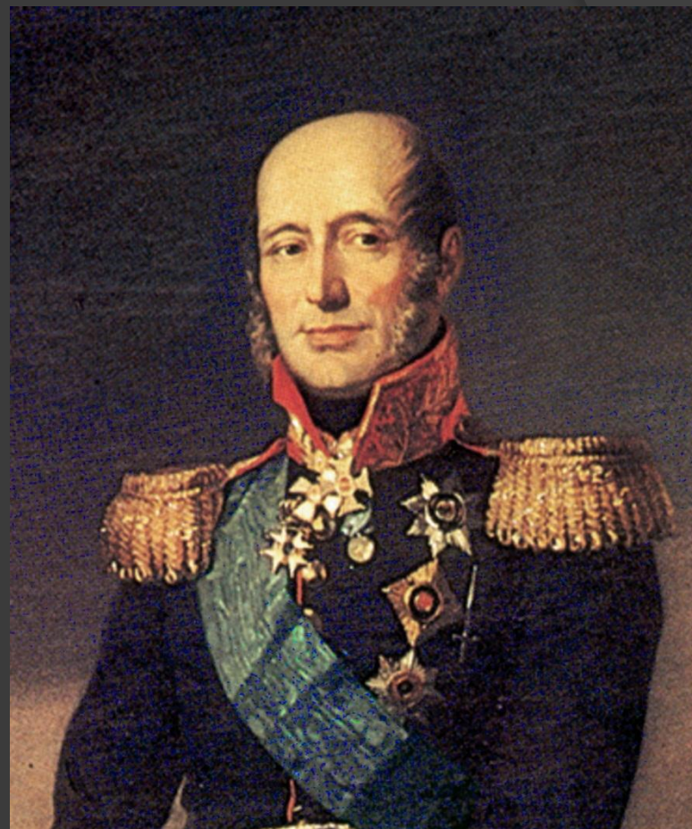
Генерал-фельдмаршал князь Михаил Богданович Барклай-де-Толли