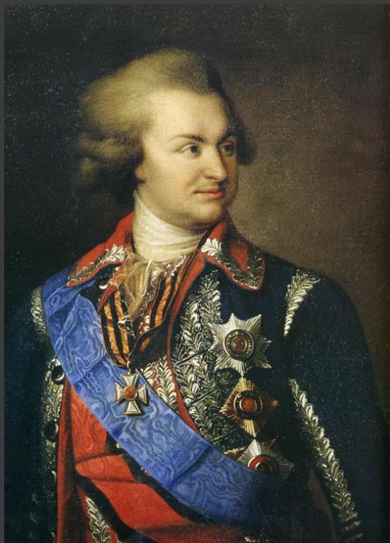
Генерал-фельдмаршал светлейший князь Григорий Александрович Потёмкин-Таврический