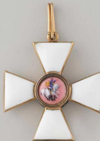
Знак 3-й степени