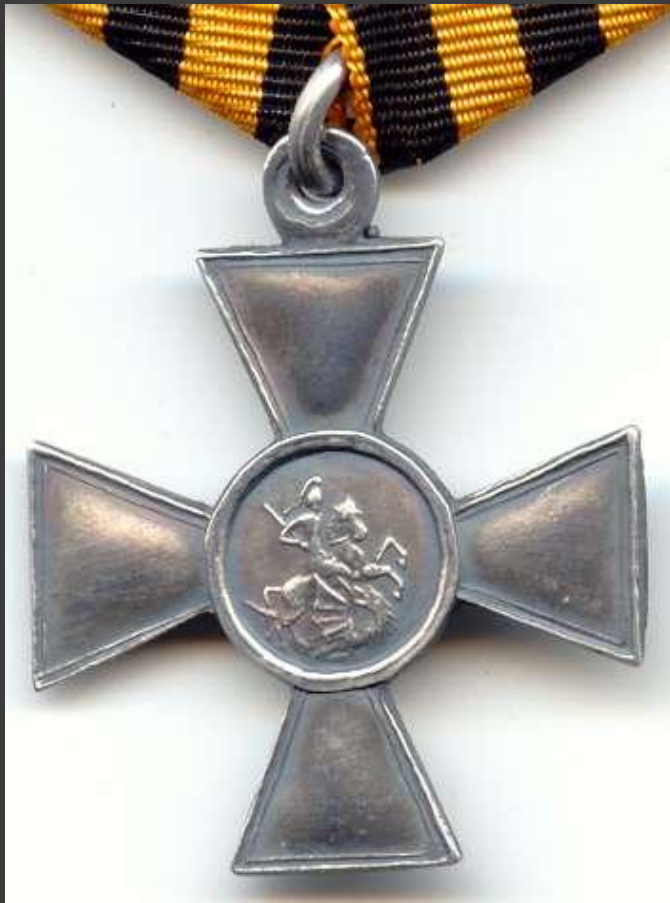
Знак Отличия Военного ордена (солдатский Георгий) 4-й степени

1807 г. – Знак Отличия Военного ордена Св. Георгия для нижних чинов.