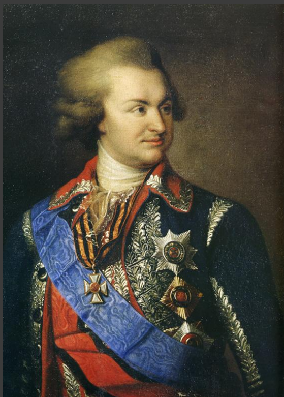
Генерал-фельдмаршал светлейший князь Григорий Александрович Потёмкин-Таврический