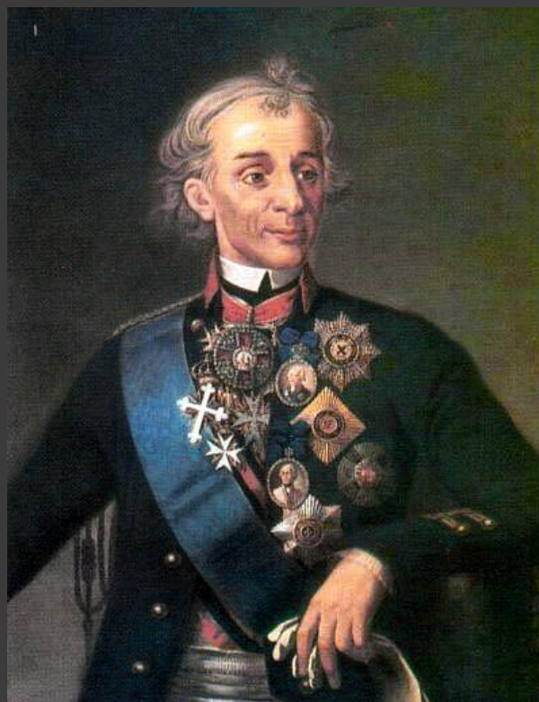
Генералиссимус князь Александр Васильевич Италийский, граф Суворов-Рымникский