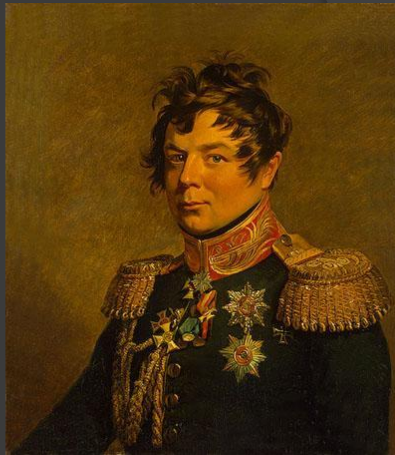
Генерал-фельдмаршал граф Иван Иванович Дибич- Забалканский