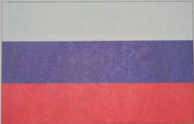
Гос. флаг до 1917 го

Гос. Флаг с XVII до 1917 года (вверху). С 1858 по 1883 года не являлся государственным флагом. Вместо него был фамильный флаг дома Романовых (внизу)