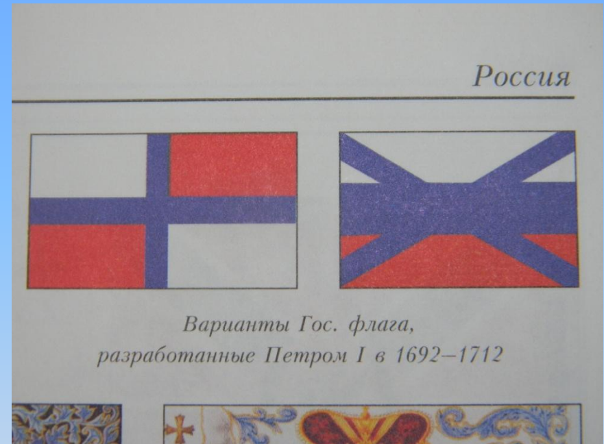
Варианты государственного флага, Разработанные Петром I в 1692-1712 годах