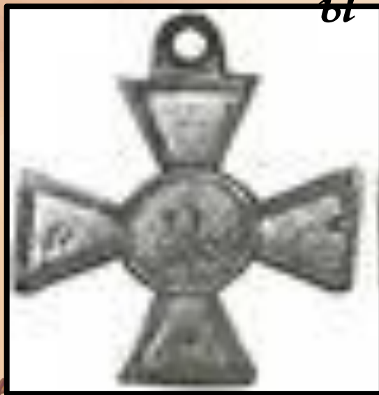
крест за взятие Плевны