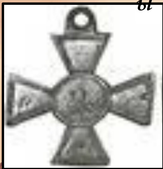
крест за взятие Плевны