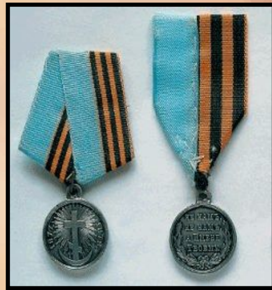
серебряные медали в память о войне