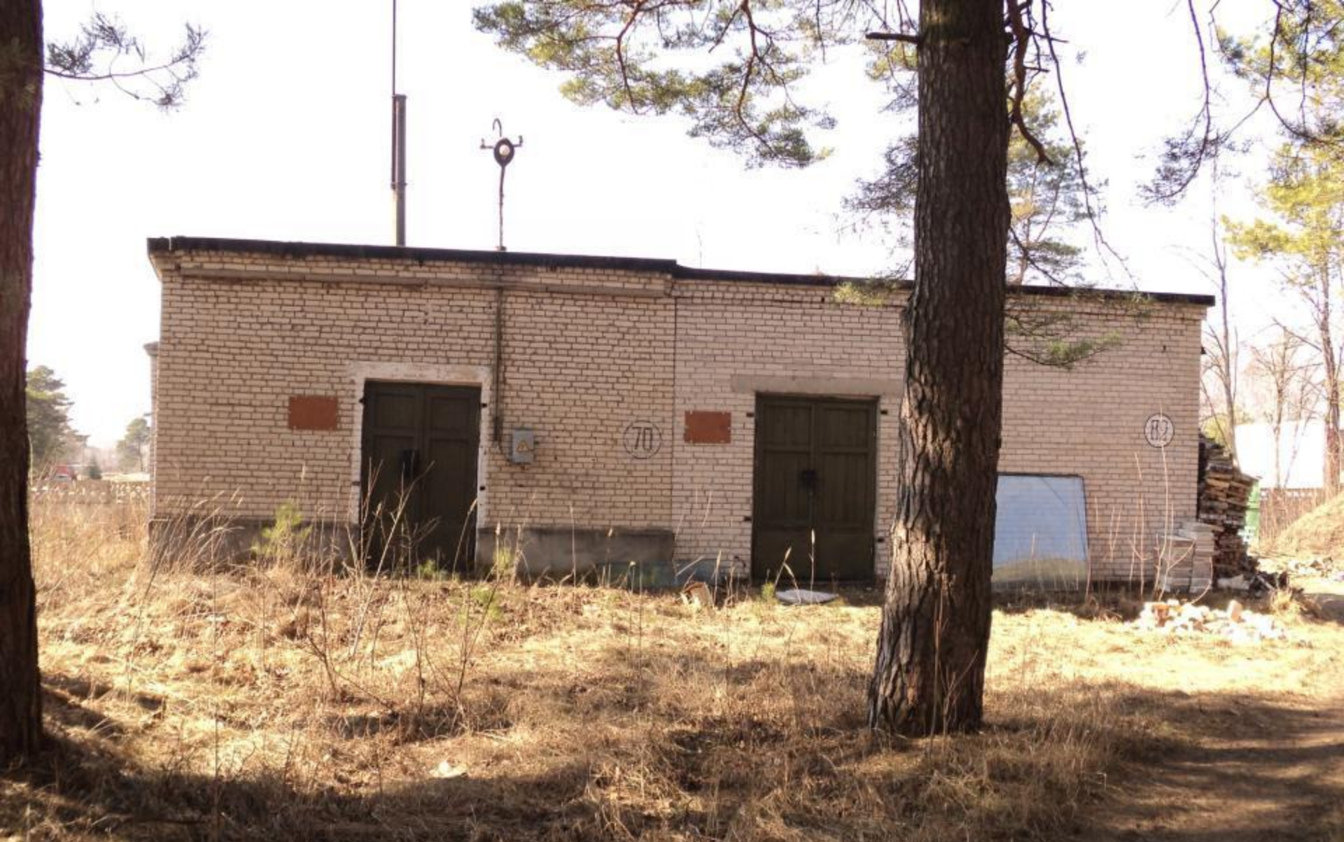
Хранилище имущества, инв.номер 412/С-1049, год ввода 1981, площадь застройки – 87 м.кв., общая площадь – 71,6 м.кв.