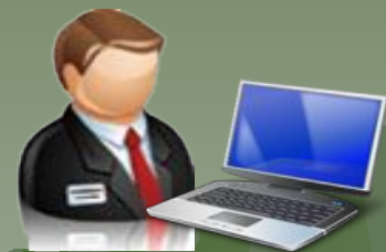
Государственный инспектор по использованию и охране земель