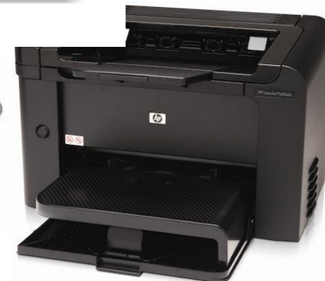
Принтеры HP моделей: HP Officejet Pro 8500A HP LaserJet P1606 HP LaserJet P1006 HP LaserJet P1102 HP LaserJet P1022