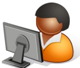
Служба ведения договоров