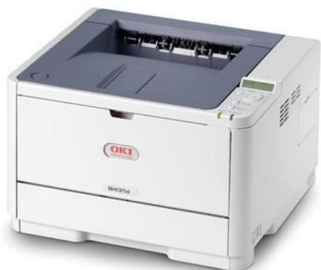
Принтеры OKI моделей B431d или B431dn