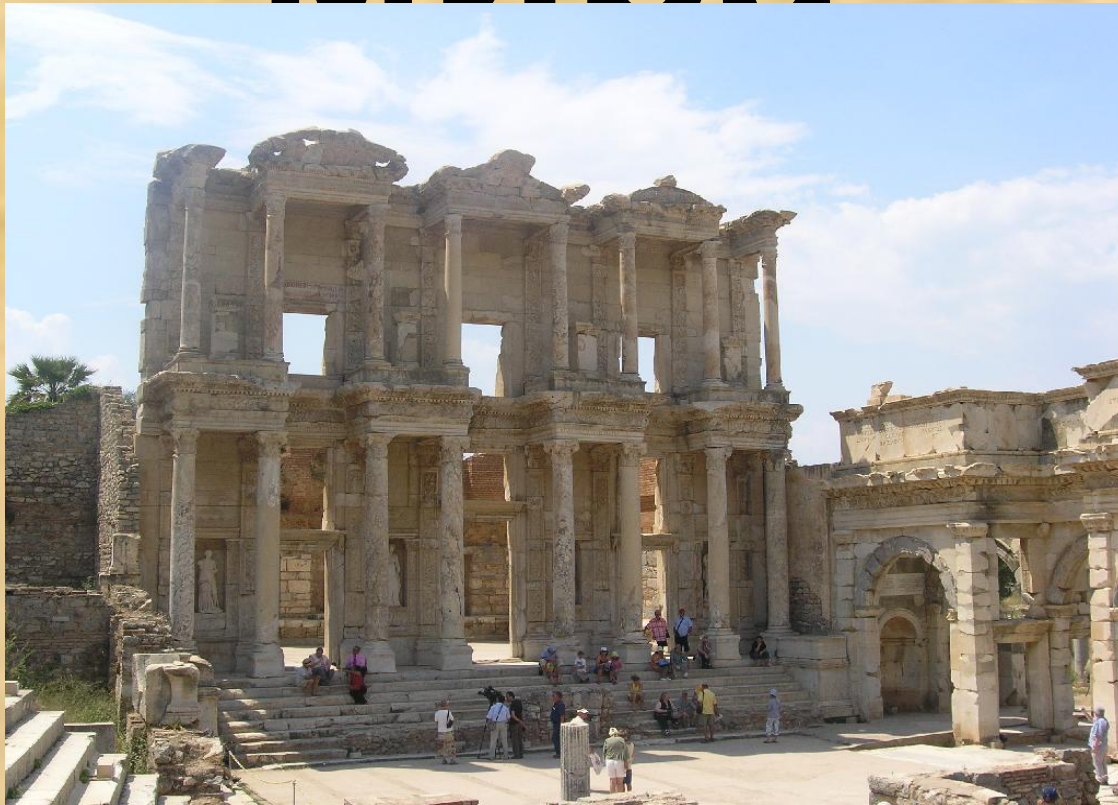
Библиотека Цельсиуса в Эфесе