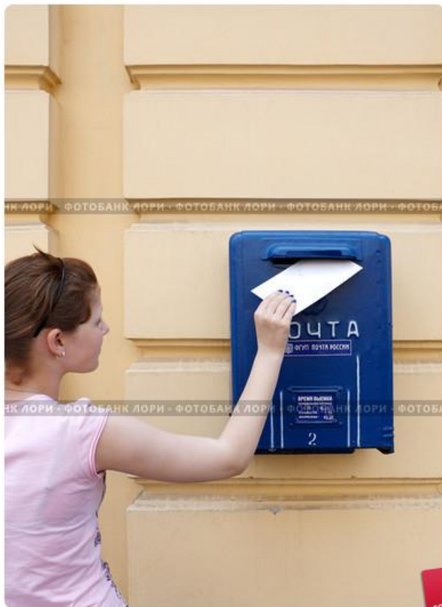
Девочка опускает письмо в почтовый ящик