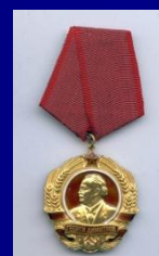
Орден «Георгий Димитров» НРБ