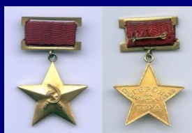
Герой Социалистического Труда НРБ