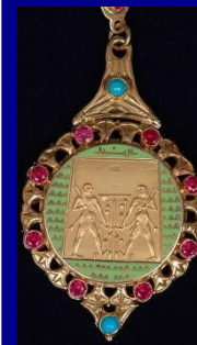
Орден Нила Египет