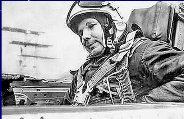
Фотография сделана 27 марта, перед вылетом МиГ-15УТИ

После защиты дипломной работы в академии Жуковского, Ю. А. Гагарин приступил к лётной практике — тренировочным полётам на самолёте МиГ-15УТИ. В период с 13 по 22 марта он совершил 18 полётов общей продолжительностью 7 часов. Перед самостоятельными вылетами ему оставались последние два контрольных полёта — с лётчиком-инструктором, командиром полка, Героем Советского Союза Владимиром Серёгиным.