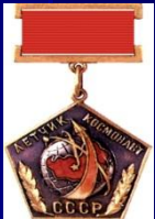
Летчик-космонавт СССР СССР