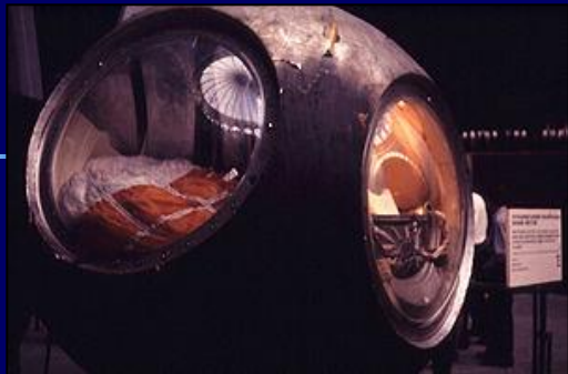
Макет спускаемого аппарата Гагарина в мемориальном музее космонавтики

Старт корабля «Восток - 1» был произведён в 09:07 12 апреля 1961 года по московскому времени с космодрома Байканур. Выполнив один оборот вокруг Земли в 10:55:34 на 108 минуте, корабль завершил плановый полёт (на одну секунду раньше, чем было запланировано). Позывной Гагарина был «Кедр». Из-за сбоя в системе торможения спускаемый аппарат с Гагариным приземлился не в запланированной области в 110 км от Сталинграда, а в Саратовской области, неподалёку от Энгельса в районе села Смеловка. Там такого высокого гостя никто не ждал. В 10:48 радар близлежащего военного аэродрома засёк неопознанную цель — это был спускаемый аппарат, — а чуть позже, за 7 км до земли, в соответствии с планом полёта Гагарин катапультировался, и целей на радаре появилось две.