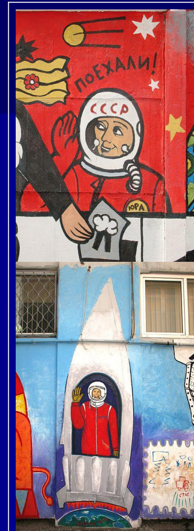
Граффити, посвященное Гагарину. Харьков, 2010