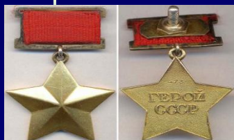
Герой Советского Союза СССР