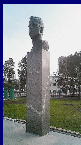
Памятник Юрию Гагарину на аллее Космонавтов в Москве