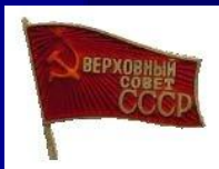
Знак депутата ВС СССР СССР