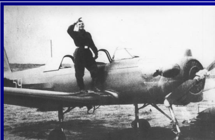
Юрий Алексеевич Гагарин-курсант Саратовского аэроклуба.