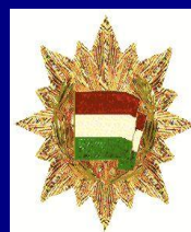
Орден Знамени ВНР