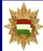
Орден Знамени ВНР