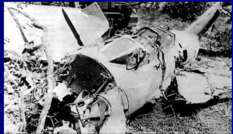
Обломки самолета МиГ-15УТИ, потерпевшего аварию.

В СССР был объявлен общенациональный траур. Это был первый случай в истории СССР, когда день траура был объявлен в случае смерти человека, не являвшегося на момент смерти действующим главой государства