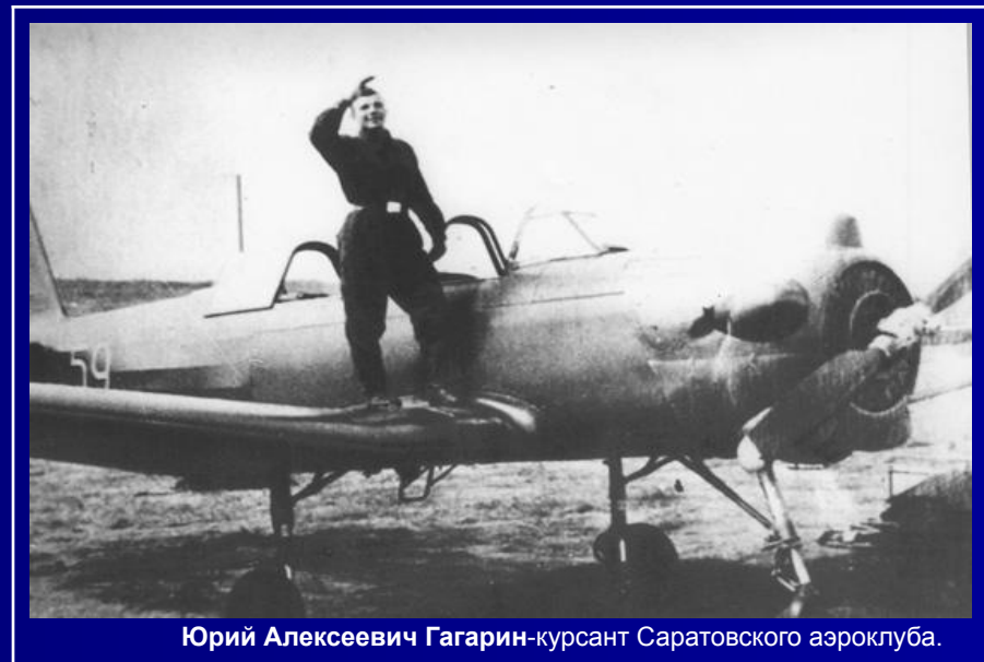
Юрий Алексеевич Гагарин-курсант Саратовского аэроклуба.