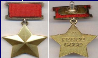
Герой Советского Союза СССР