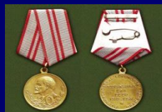
Юбилейная медаль «40 лет Вооружённых Сил СССР» СССР

Множество почётных званий, зарубежных наград