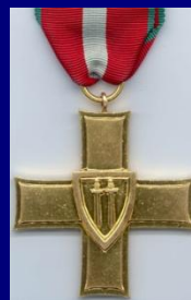
Орден «Крест Грюнвальда» Польша