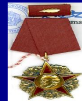
Орден Карла Маркса ГДР