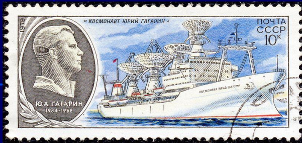
Научно-исследовательское судно «Космонавт Юрий Гагарин» и портрет Гагарина на почтовой марке СССР