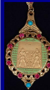
Орден Нила Египет