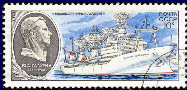
Научно-исследовательское судно «Космонавт Юрий Гагарин» и портрет Гагарина на почтовой марке СССР