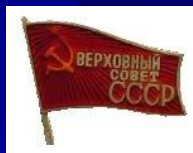
Знак депутата ВС СССР СССР