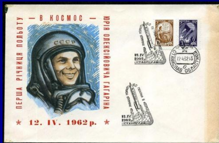
Почтовый конверт, посвященный Ю.Гагарину