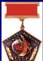
Летчик-космонавт СССР СССР