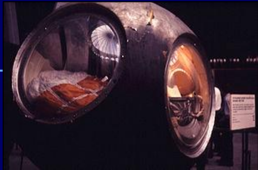
Макет спускаемого аппарата Гагарина в мемориальном музее космонавтики

Старт корабля «Восток - 1» был произведён в 09:07 12 апреля 1961 года по московскому времени с космодрома Байканур. Выполнив один оборот вокруг Земли в 10:55:34 на 108 минуте, корабль завершил плановый полёт (на одну секунду раньше, чем было запланировано). Позывной Гагарина был «Кедр». Из-за сбоя в системе торможения спускаемый аппарат с Гагариным приземлился не в запланированной области в 110 км от Сталинграда, а в Саратовской области, неподалёку от Энгельса в районе села Смеловка. Там такого высокого гостя никто не ждал. В 10:48 радар близлежащего военного аэродрома засёк неопознанную цель — это был спускаемый аппарат, — а чуть позже, за 7 км до земли, в соответствии с планом полёта Гагарин катапультировался, и целей на радаре появилось две.