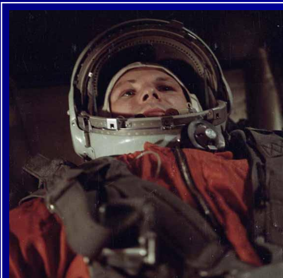
Космонавт Гагарин Ю.А. В Скафандре перед стартом на КК «Восток»

Тем временем из Энгельского аэропорта вылетел вертолёт Ми - 4, в его задачу входило найти и подобрать Гагарина. Они первыми и обнаружили спускаемый аппарат, но Гагарина рядом не было, ситуацию прояснили местные жители, они сказали, что Гагарин уехал на грузовике в Энгельс. Вертолёт взлетел и взял курс на город. По дороге с него увидели грузовик, с которого махал руками Гагарин. Гагарина забрали, и вертолёт полетел на базу в Энгельсский аэропорт, передав радиogramму: «Космонавт взят на борт, следую на аэродром»