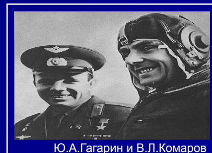
Ю.А.Гагарин и В.Л.Комаров

Гагарин учился в Военно-воздушной инженерской академии имени Н.Е. Жуковского и поэтому некоторое время не имел лётной практики, также сказывалась и общественная деятельность.