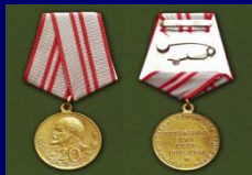
Юбилейная медаль «40 лет Вооружённых Сил СССР» СССР

Множество почётных званий, зарубежных наград