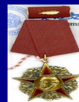
Орден Карла Маркса ГДР