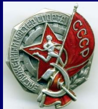
Заслуженный мастер спорта СССР