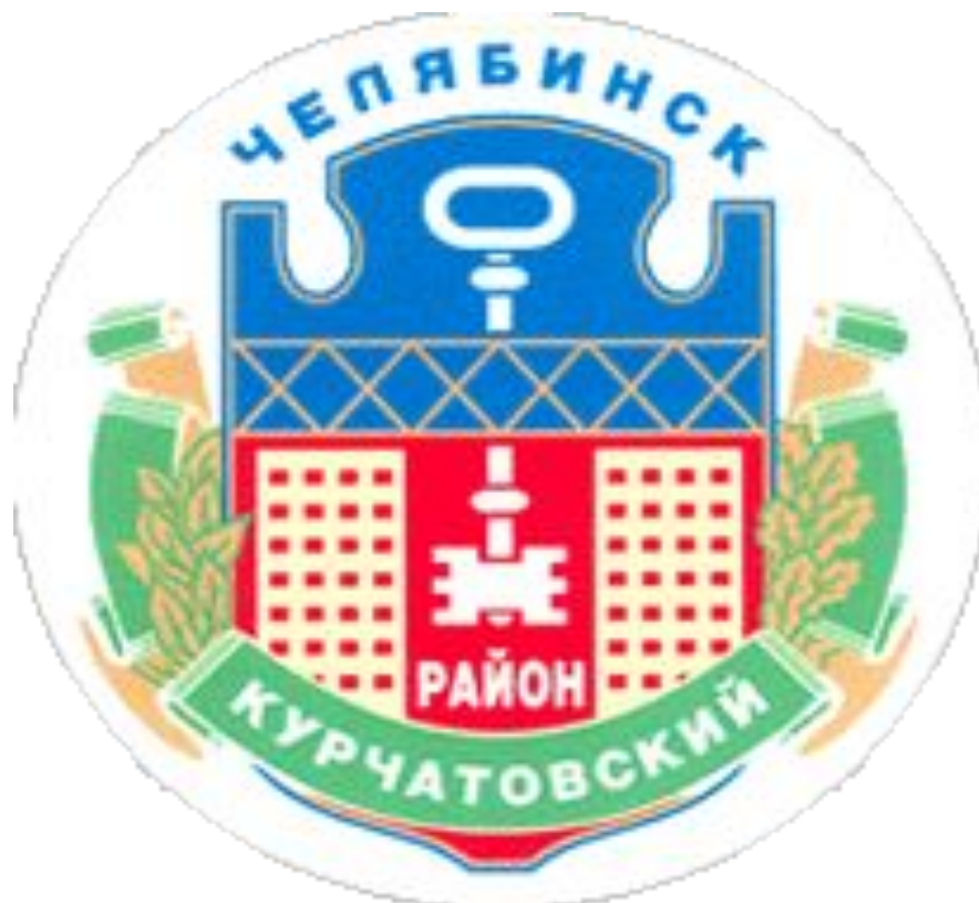
Герб Курчатовского района