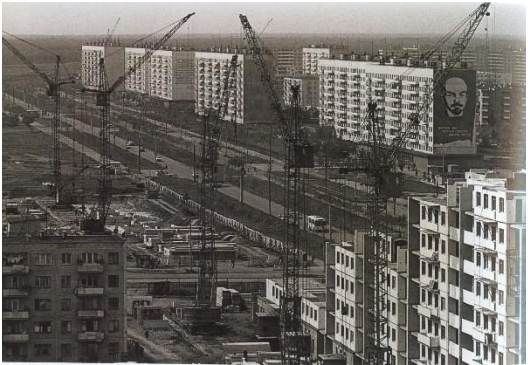
Застройка Курчатовского района