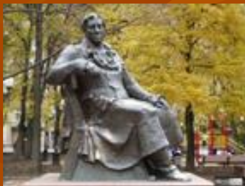
Памятник на Патриарших прудах