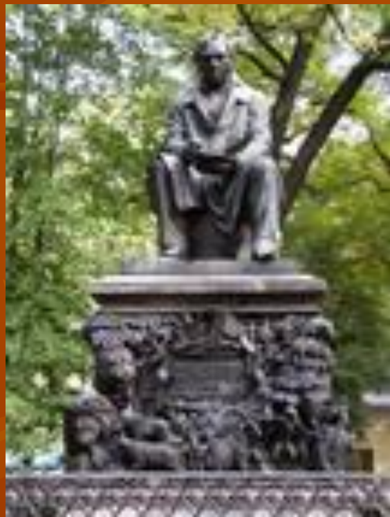
Памятник И.А.Крылову В Летнем саду Санкт-Петербурга