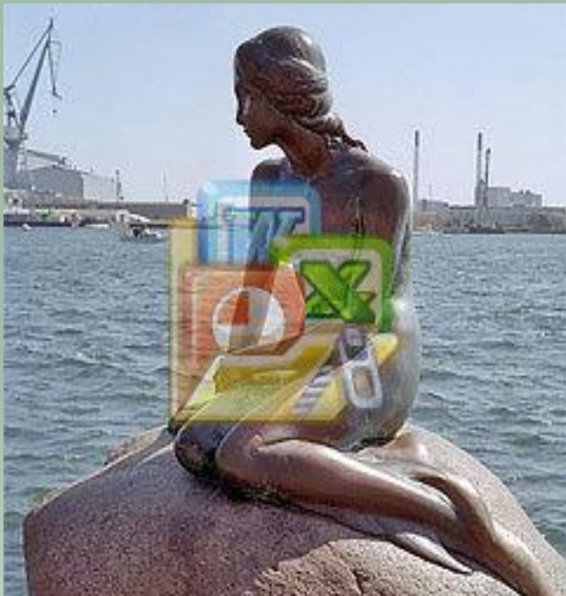
Русалочке Г. Х. Андерсена