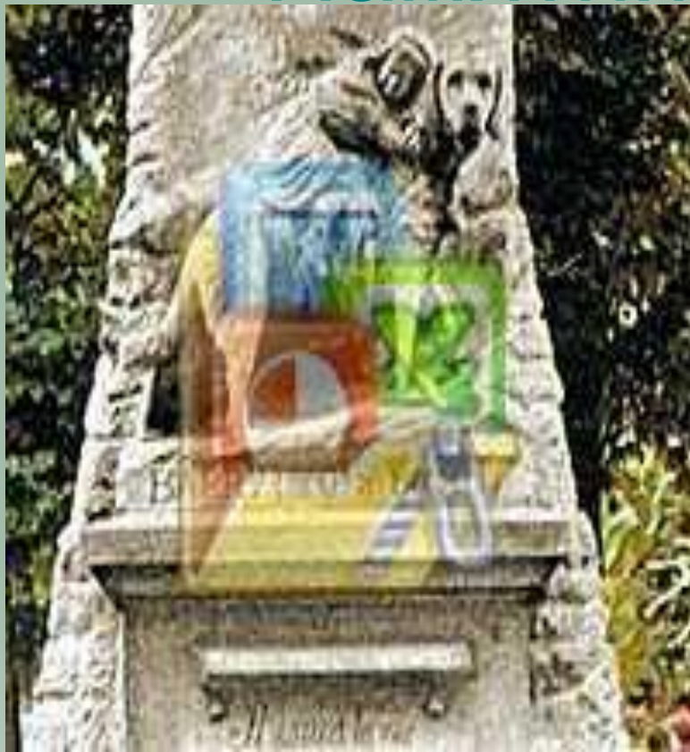
Сенбернару Барри, спасшему сорок человек в Альпах