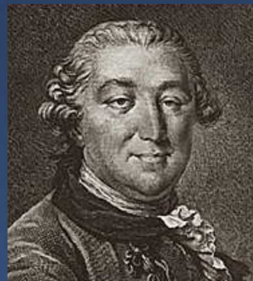
фаворит Екатерины II

После рождения Павла отношения с Петром и Елизаветой Петровной окончательно испортились. Пётр открыто заводил любовниц, впрочем, не препятствуя делать это и Екатерине, у которой в этот период возникла связь с Станиславом Понятовским — будущим королём Польши. 9 (20) декабря 1758 года Екатерина родила дочь Анну, что вызвало сильное недовольство Петра, произнёсшего при известии о новой беременности: «Бог знает, откуда моя жена беременеет; я не знаю, наверное, мой ли этот ребенок и должен ли я признавать его своим». Смерть Елизаветы Петровны (25 декабря 1761 (5 января 1762)) и восшествие на престол Петра Фёдоровича под именем Петра III ещё больше отдалили супругов. Пётр III стал открыто жить с любовницей Елизаветой Воронцовой, поселив жену в другом конце Зимнего дворца. Когда Екатерина забеременела, от Орлова это уже нельзя было объяснить случайным зачатием от мужа, так как общение супругов прекратилось к тому времени совершенно. Беременность свою Екатерина скрывала, а когда пришло время рожать, её преданный камердинер Василий Григорьевич Шкурин поджёг свой дом. Любитель подобных зрелищ Пётр с двором ушли из дворца посмотреть на пожар; в это время Екатерина благополучно родила. Так появился на свет божий первый на Руси граф Бобринский — основатель известной фамилии.