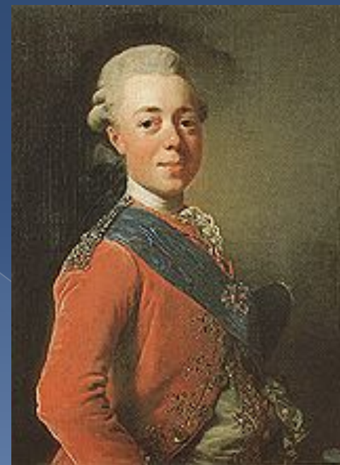
Павел I Петрович, сын Екатерины (1777)

20 сентября (1 октября) 1754 году Екатерина родила сына, которого называют Павлом (будущий император Павел I ). Её лишают возможности воспитывать сына, а позволяют только изредка видеть.