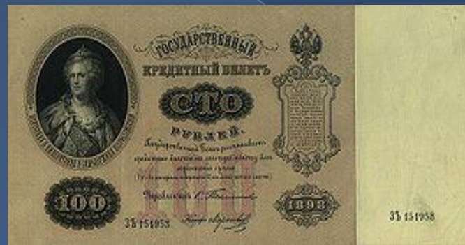
Екатерина Великая на Катеньке — царской стурублёвке 1898 и 1910 г.

Большое значение имело введённое императрицей государственное регулирование цен на соль. Сенат законодательно установил цену на соль в размере 30 копеек за пуд (вместо 50 копеек) и 10 копеек за пуд в регионах массовой засолки рыбы. Не вводя государственную монополию на торговлю солью, Екатерина рассчитывала на усиление конкуренции и улучшение, в конечном итоге, качества товара.