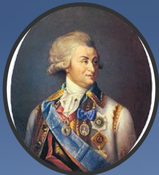
Г. А. Потемкин