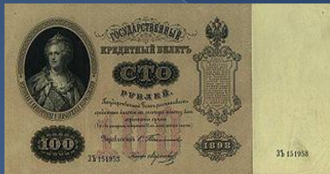
Екатерина Великая на Катеньке — царской стурублёвке 1898 и 1910 г.

Большое значение имело введённое императрицей государственное регулирование цен на соль. Сенат законодательно установил цену на соль в размере 30 копеек за пуд (вместо 50 копеек) и 10 копеек за пуд в регионах массовой засолки рыбы. Не вводя государственную монополию на торговлю солью, Екатерина рассчитывала на усиление конкуренции и улучшение, в конечном итоге, качества товара.