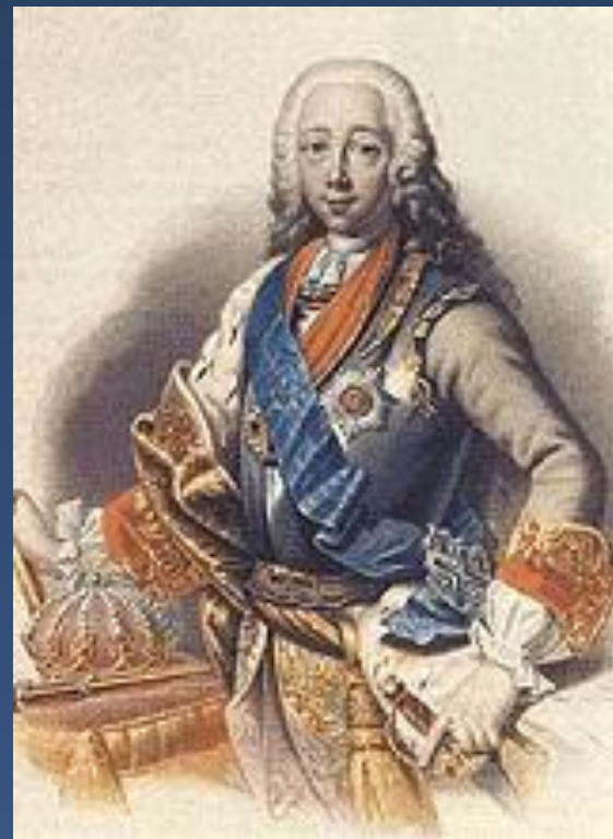
Пётр III Фёдорович , супруг Екатерины

Если бы он хотел быть любимым, это было бы для меня нетрудно: я от природы была склонна и привычна исполнять свои обязанности, но для этого мне нужно было бы иметь мужа со здоровым смыслом, а у моего этого не было.