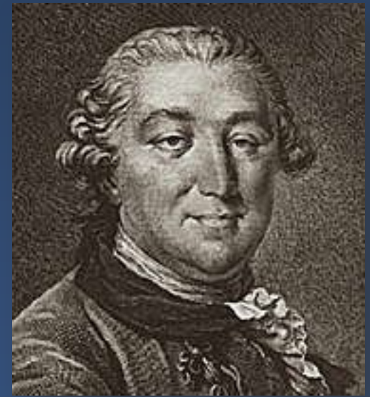
фаворит Екатерины II