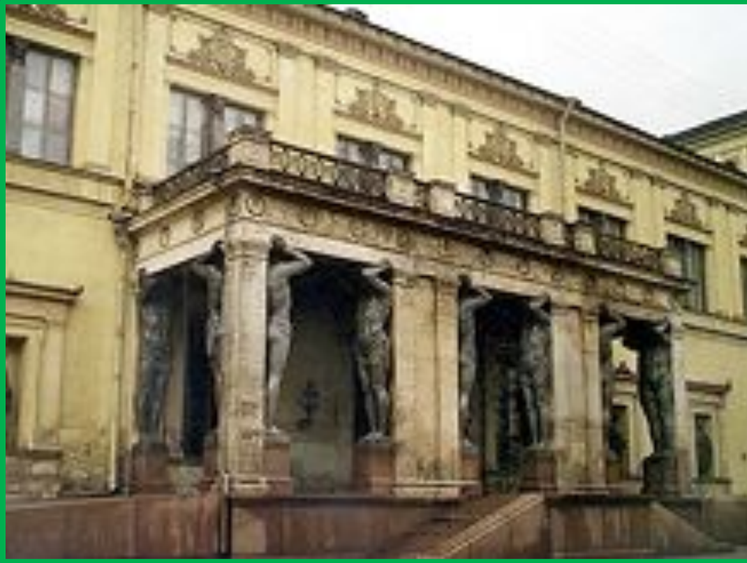
Портик нового Эрмитажа 1839 - 1852 гг. Архитектор Л. Фон Кленце Был открыт для посетителей в 1852г.