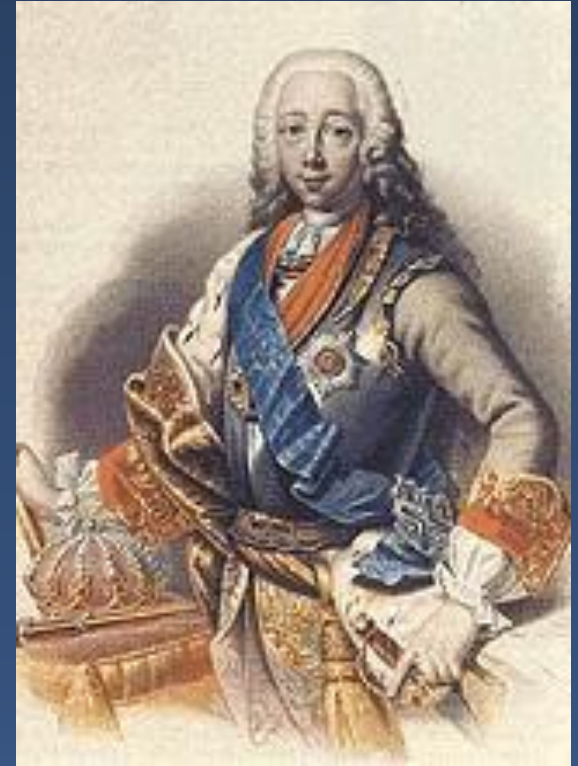
Пётр III Фёдорович , супруг Екатерины

Если бы он хотел быть любимым, это было бы для меня нетрудно: я от природы была склонна и привычна исполнять свои обязанности, но для этого мне нужно было бы иметь мужа со здоровым смыслом, а у моего этого не было.