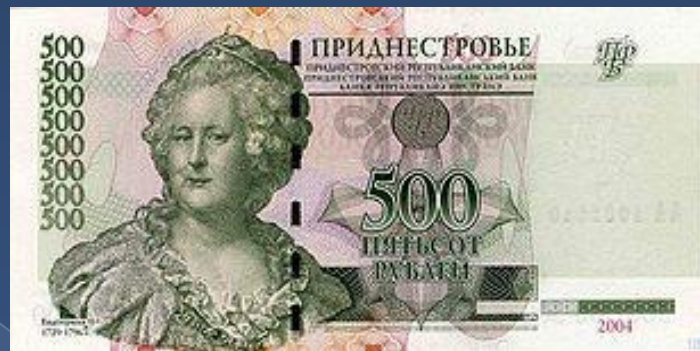
Екатерина на пятистах приднестровских рублях 2004

Возросла роль России в мировой экономике — в Англию стало в больших количествах экспортироваться российское парусное полотно, в другие европейские страны увеличился экспорт чугуна и железа (потребление чугуна на внутри российском рынке также значительно возросло).