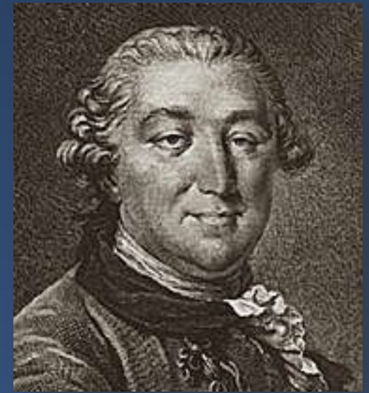
фаворит Екатерины II