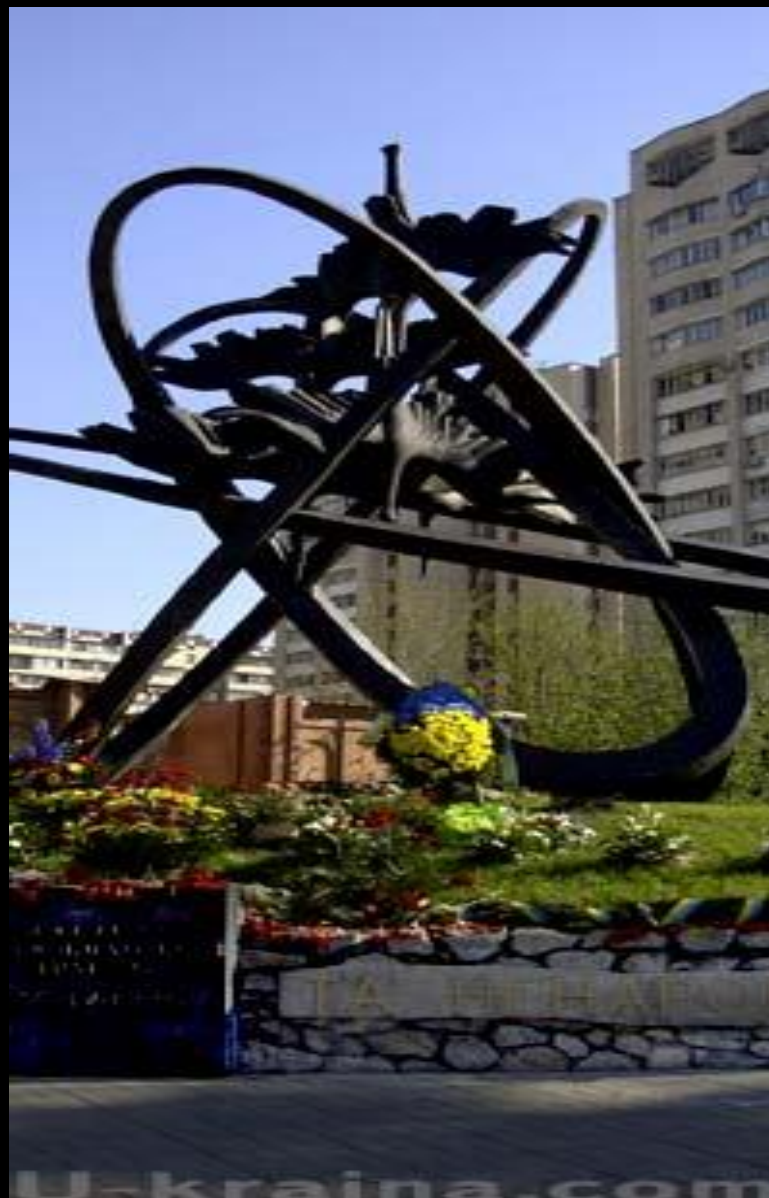
Монумент на ул. Чернобыльской (Киев)