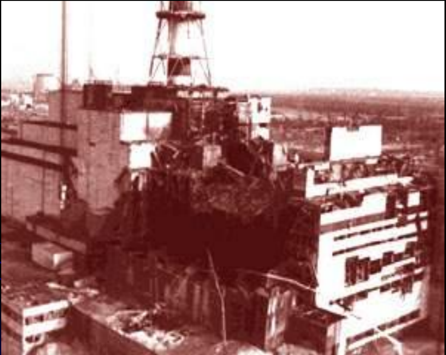
Разрушенный 4ый реактор АЭС